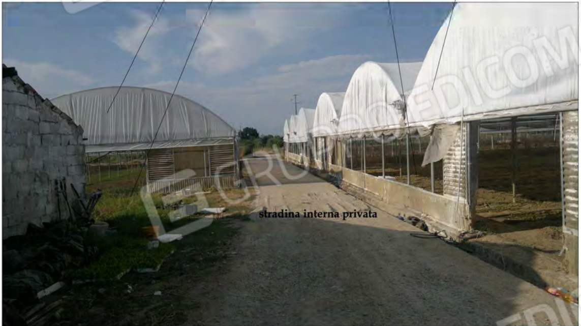
stradina interna privata