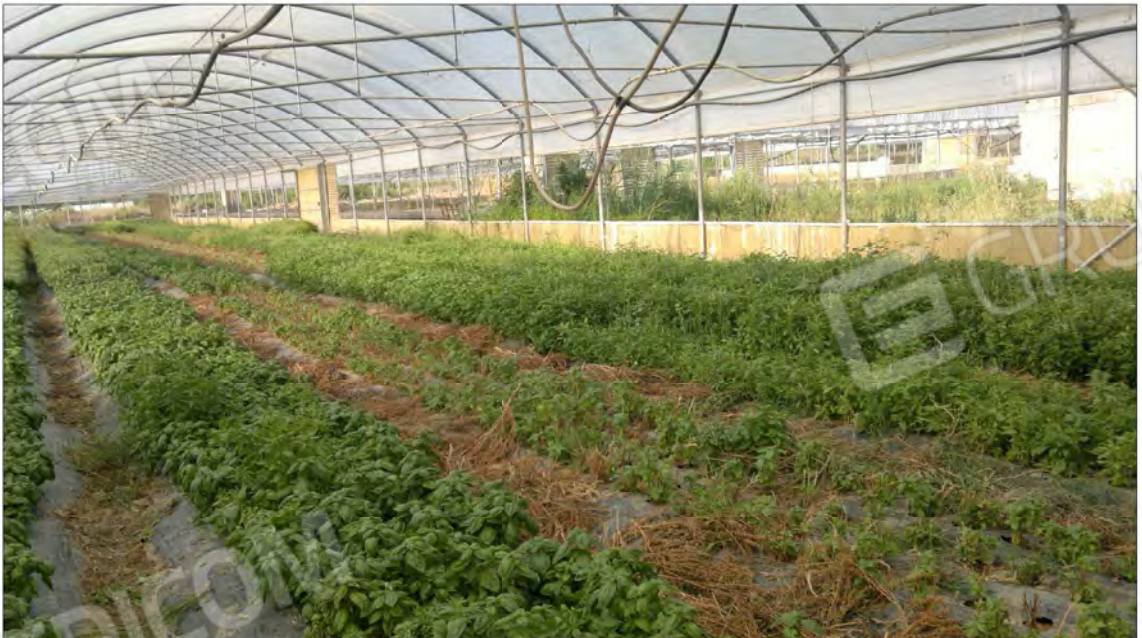
Vista interna Serre tunnel