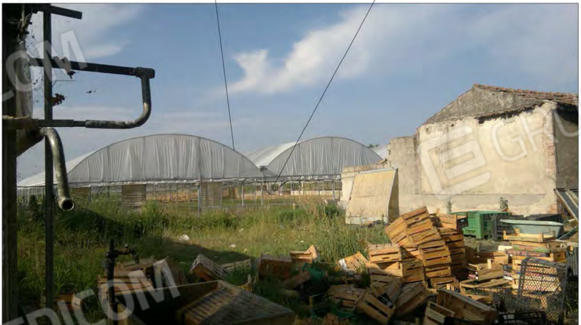
Appezamento di terreno in oggetto