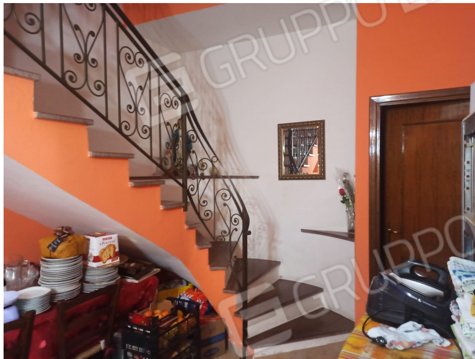
Foto 13_Vista interna vano scala