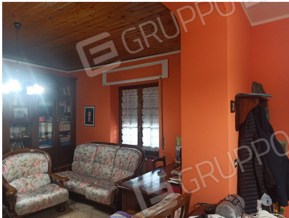
Foto 11_Vista interna salone