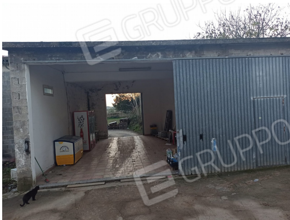
Foto 5_Prospetto deposito merci