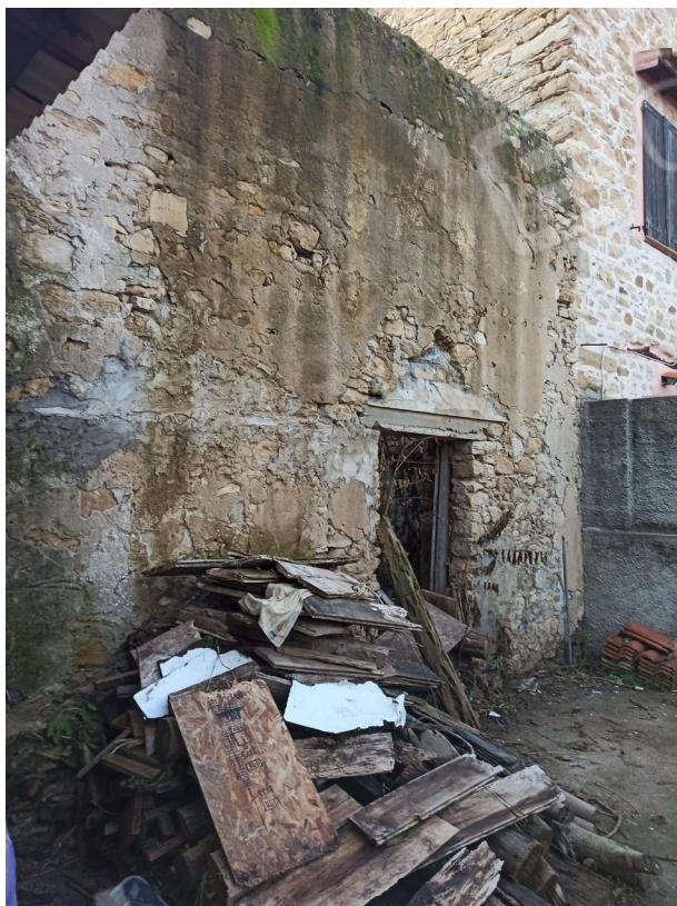
Foto 7 _ Vista esterna locale di sgombero collabente