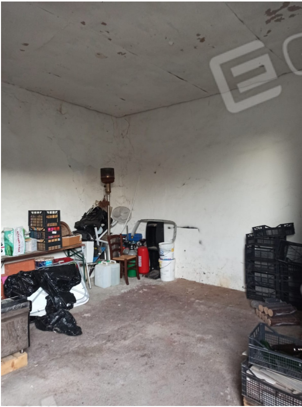
Foto 20 _ Vista interna locale di sgombero