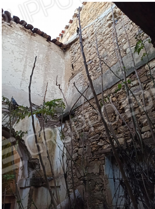
Foto 9 _ Vista interna locale di sgombero collabente Foto 10 _ Vista interna locale di sgombero collabente

Studio tecnico di ingegneria e architettura: Gianluigi Porcu, Ingegnere