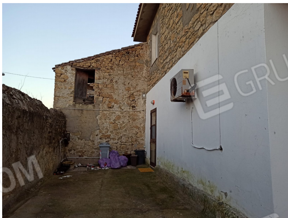
Foto 4 _Prospetto laterale abitazione con vista locale di sgombero collabente

Studio tecnico di ingegneria e architettura: Gianluigi Porcu, Ingegnere