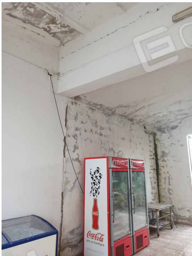
Foto 22 _ Vista interna deposito merci