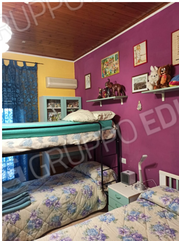
Foto 19 _ Vista interna camera