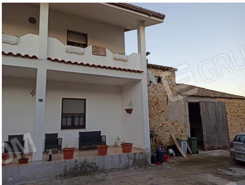
Foto 2 _Prospetto principale con vista locale di sgombero