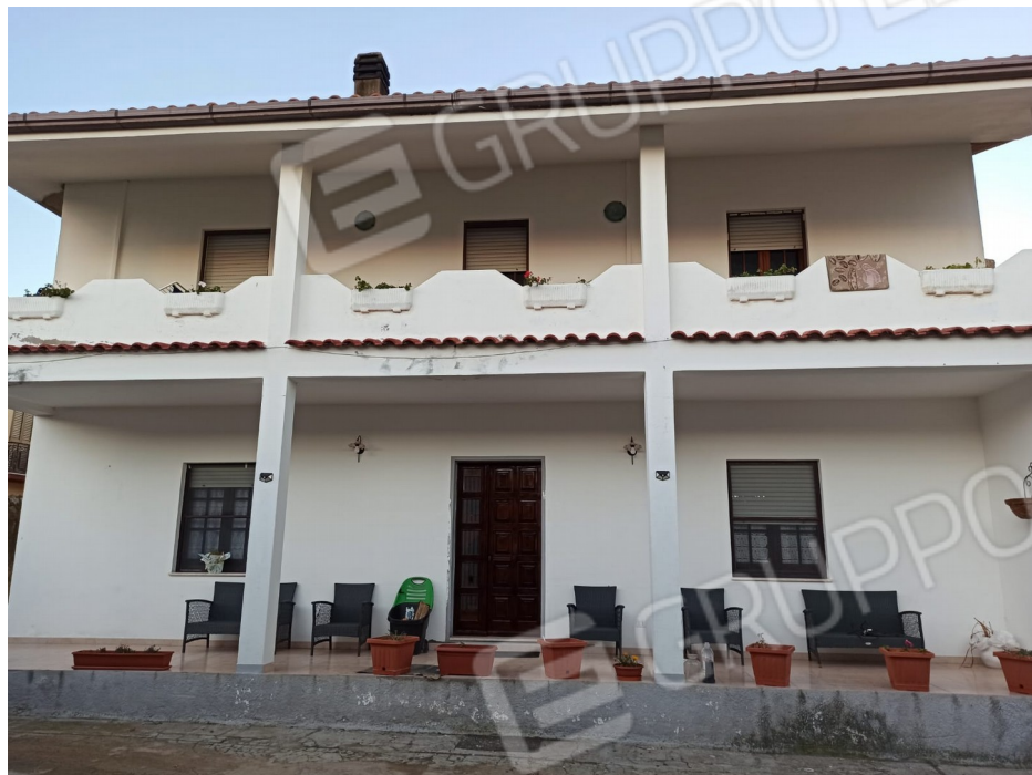
Foto 1 _Prospetto principale