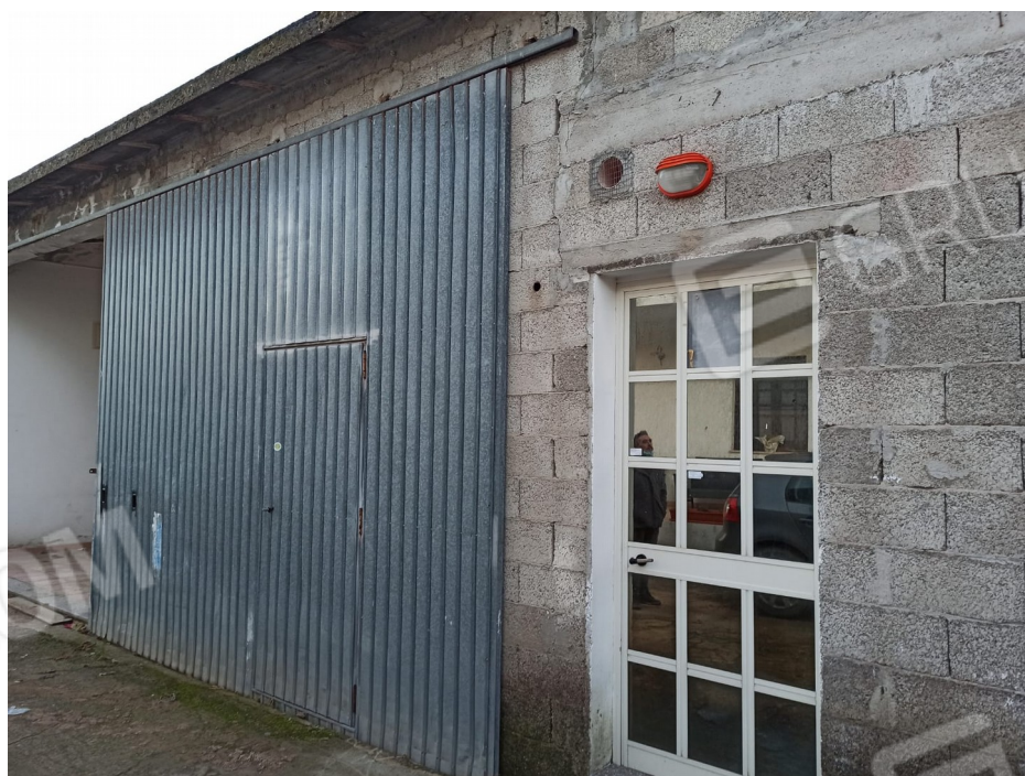
Foto 6_Prospetto deposito merci e ingresso ufficio