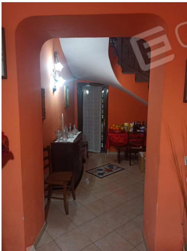
Foto 14 _ Vista interna verso vano scala