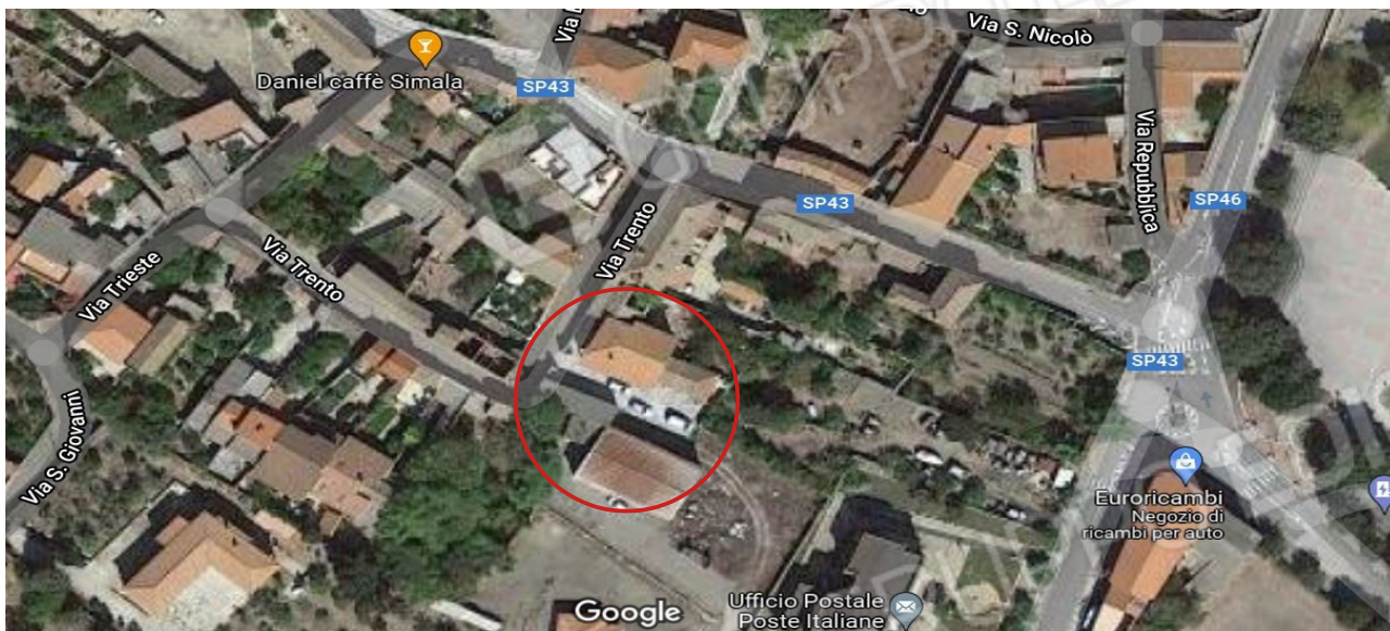
Inquadramento urbanistico su foto aerea

Studio tecnico di ingegneria e architettura: Gianluigi Porcu, Ingegnere