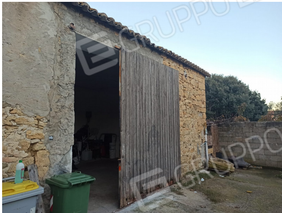
Foto 3 _Prospetto locale di sgombero