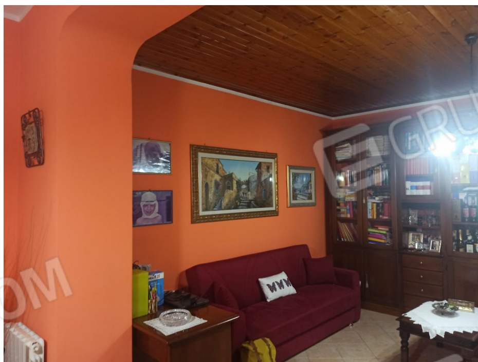
Foto 12_Vista interna salone