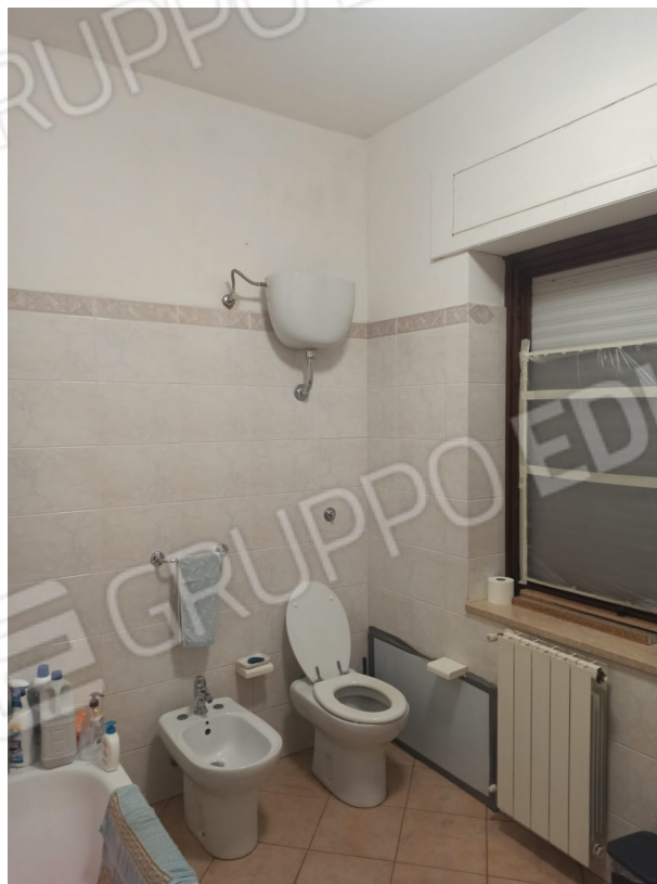
Foto 15 _ Vista interna bagno piano terra