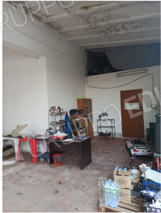
Foto 21 _ Vista interna deposito merci