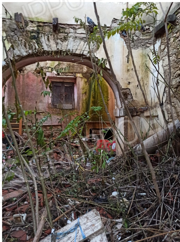
Foto 8 _ Vista interna locale di sgombero collabente