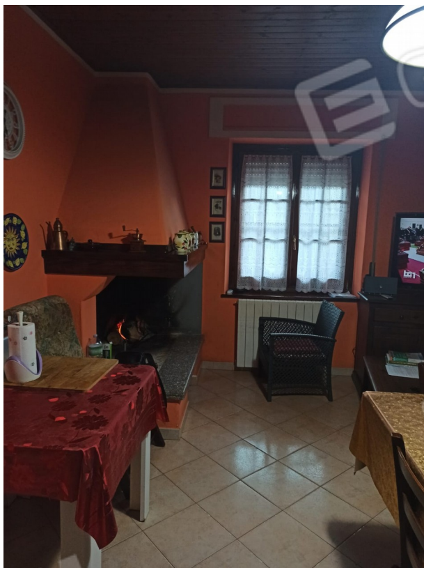
Foto 16 _ Vista interna cucina