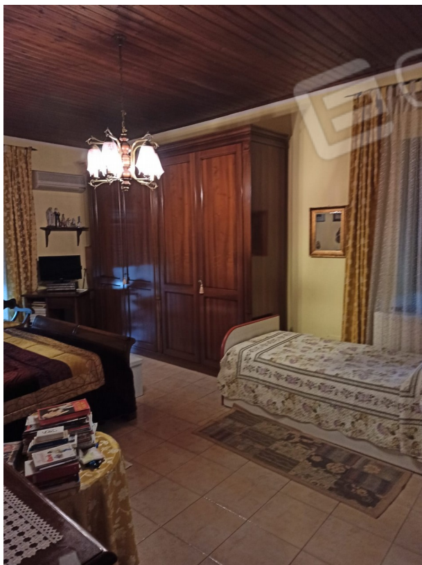
Foto 18 _ Vista interna camera matrimoniale