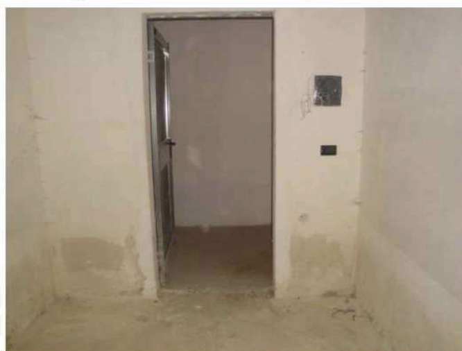
Cantinola piano interrato – segni di umidità da risalita

IMMOBILE "I.B" - APPARTAMENTO UBICATO AL PIANO TERRA CONTRADDISTINTO CON IL SUB 18 DOCUMENTAZIONE FOTOGRAFICA – PAG. 2 DI 2