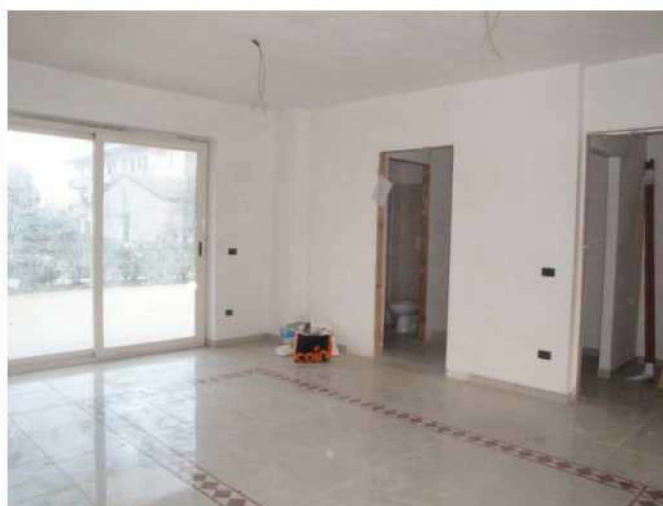
Soggiorno con angolo cottura