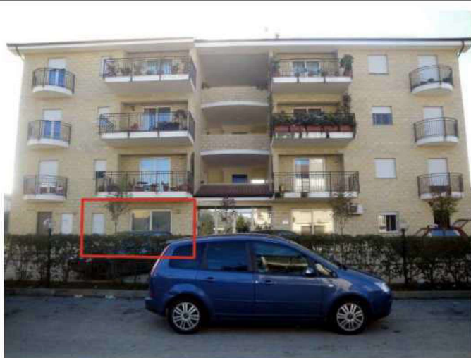
Individuazione appartamento su prospetto est

RELAZIONE DI STIMA DEGLI IMMOBILI ACQUISITI AL FALLIMENTO (SENTENZA N° 8/2013 R.F. TRIBUNALE DI COSENZA)