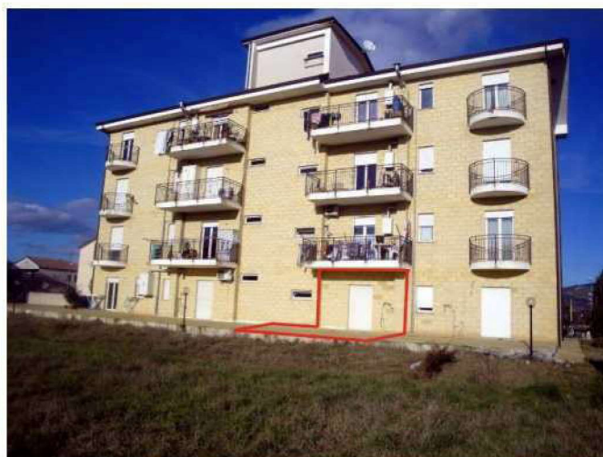
Individuazione appartamento su prospetto ovest