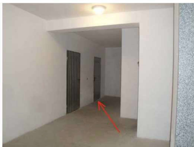
Ingresso cantinola da vano scala piano interrato