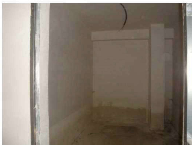
Cantinola piano interrato