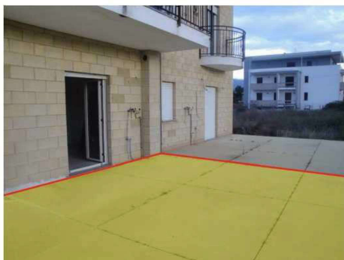
Corte esterna pertinenziale lato ovest