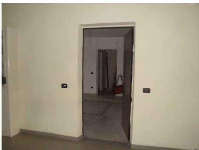
Ingresso appartamento da androne scale