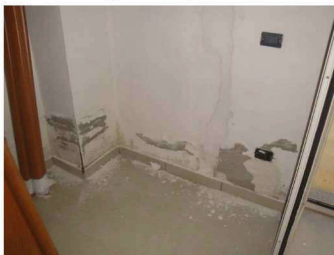
Camera – umidità su parete verso corte pertinenziale

IMMOBILE "I.B" - APPARTAMENTO UBICATO AL PIANO TERRA CONTRADDISTINTO CON IL SUB 18 DOCUMENTAZIONE FOTOGRAFICA – PAG. 1 DI 2