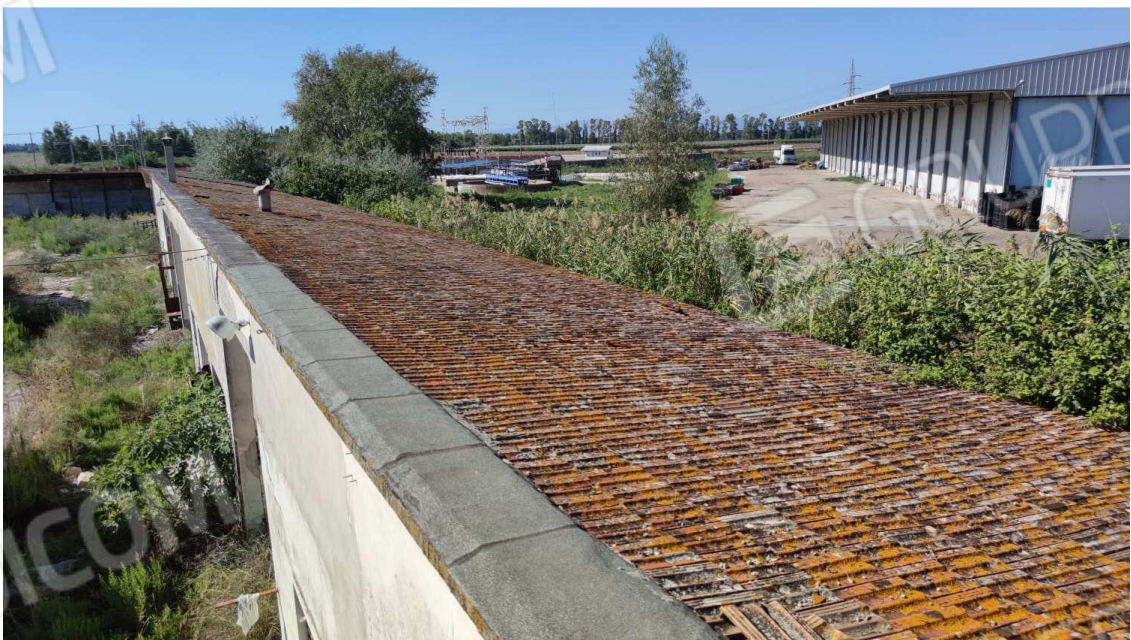
foto 14 – Metaponto, contrada Mercuragno - palazzina uso misto f. 43 ptc 182 sub. 1 e 2