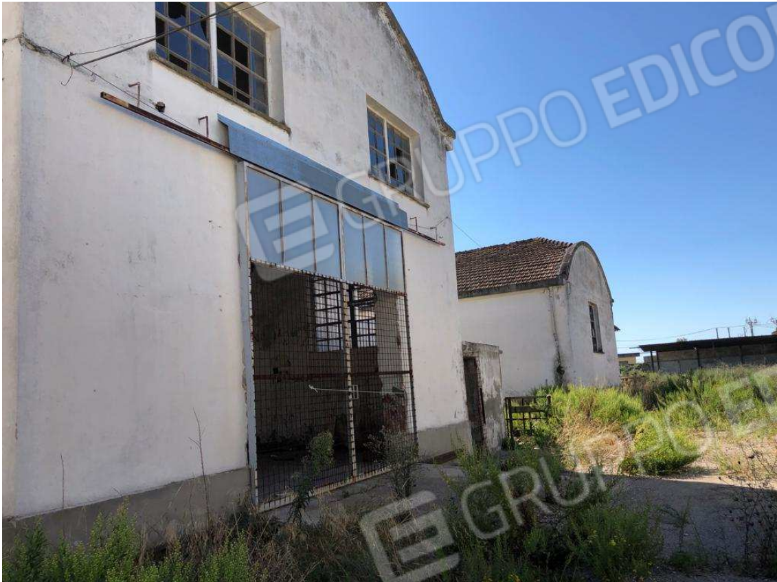
foto 9 – Metaponto, contrada Mercuragno - capannoni f. 43 pct. 180 e 181– prospetti anteriori