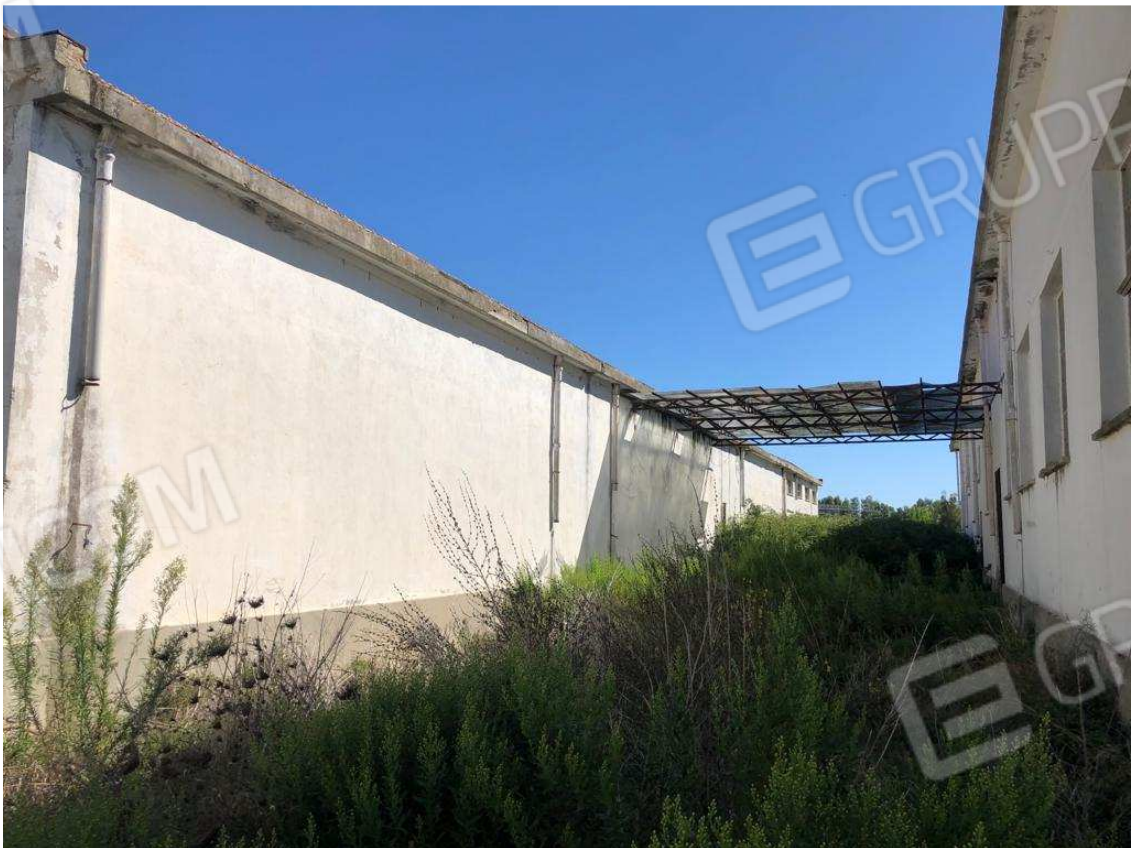
foto 10 – Metaponto, contrada Mercuragno - f. 43 capannoni ptcc. 180 e 181 – prospetti laterali