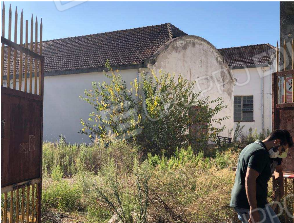
foto 7 – Contrada Mercuragno - capannone f. 43 pct. 179 – prospetto anteriore – stato attuale