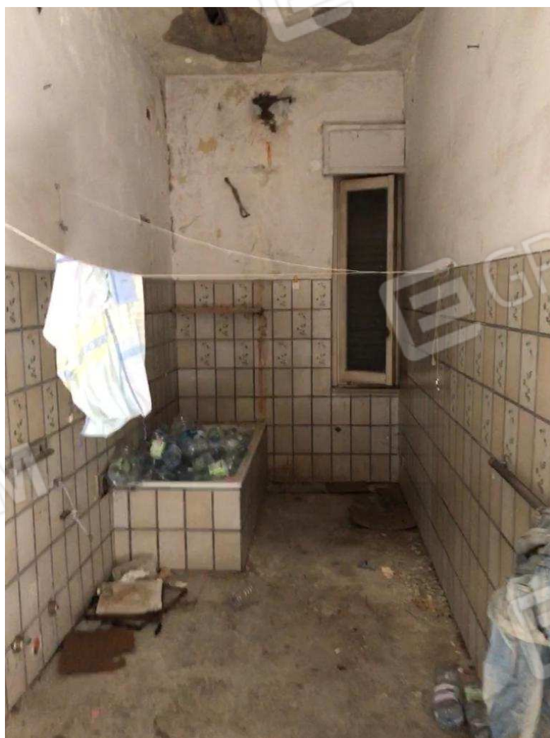
foto 16 – Metaponto, contrada Mercuragno ex palazzina uffici - f. 43 ptc 177 sub. 1 - interno