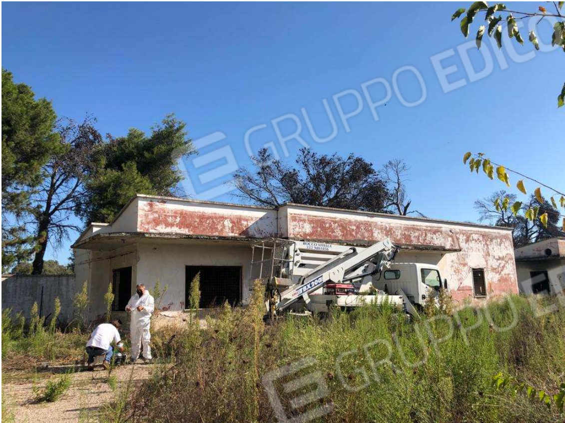
foto 11 – Metaponto, contrada Mercuragno -ex palazzina uffici f. 43 pct. 177 – prospetto anteriore