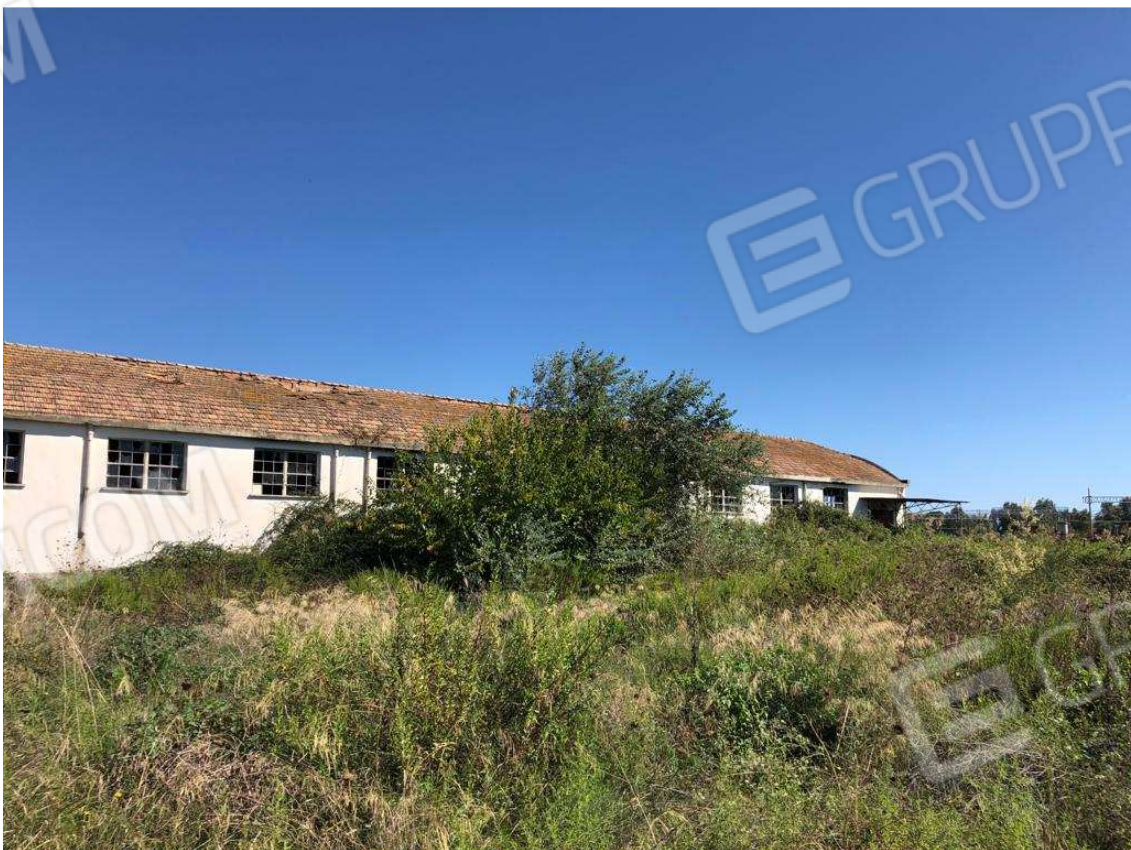
foto 18 – Metaponto, contrada Mercuragno - capannone - f. 43 ptc 181 – prospetto laterale