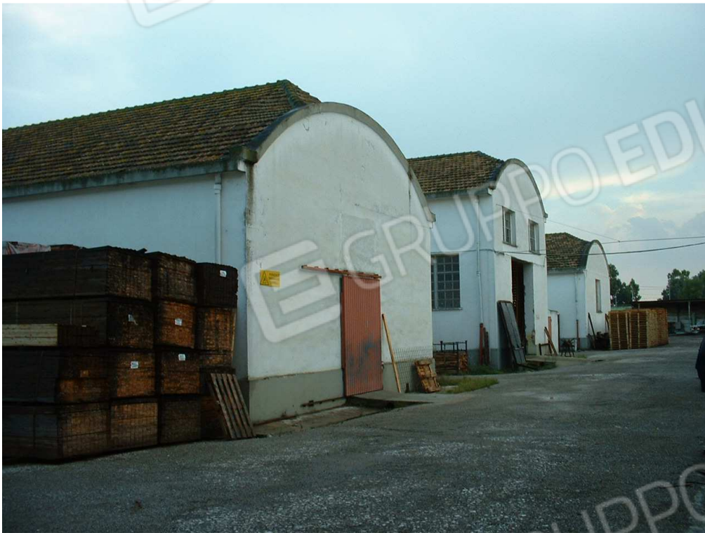
foto 5 – Contrada Mercuragno – foto d'archivio capannoni - f. 43 ptc. 179 -180 -181 fronte ovest