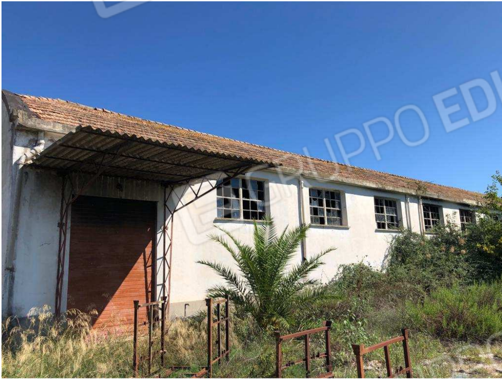
foto 19 – Metaponto, contrada Mercuragno - capannone - f. 43 ptc 181 – prospetto laterale