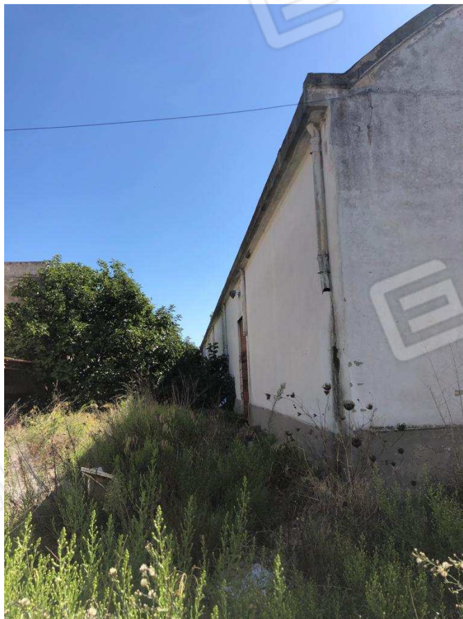
foto 6 – Metaponto, contrada Mercuragno - capannone f. 43 ptc. 179 – prospetto settentrionale