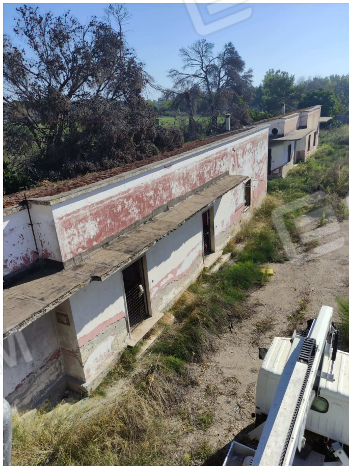
foto 8 – Metaponto, contrada Mercuragno – ex palazzina uffici e residenza f. 43 pct. 177 e 178