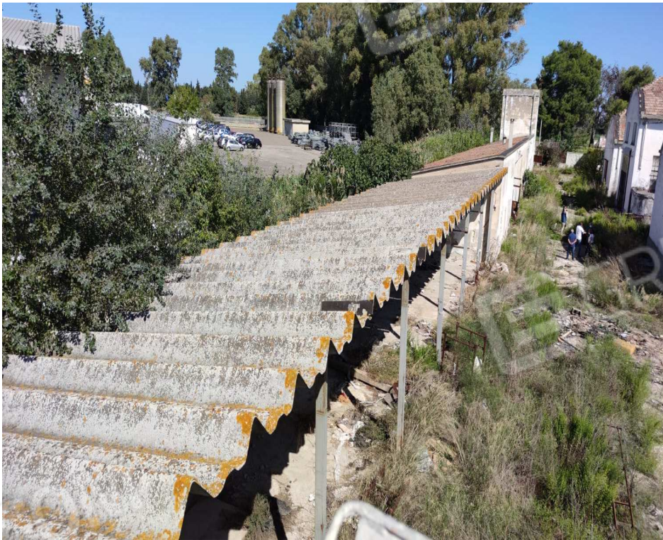
foto 20 – Metaponto, contrada Mercuragno - costruzione ad uso misto e tettoia