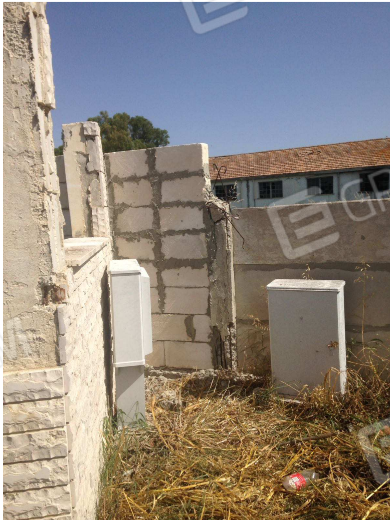
foto 4 – Metaponto, contrada Mercuragno – accesso pedonale murato