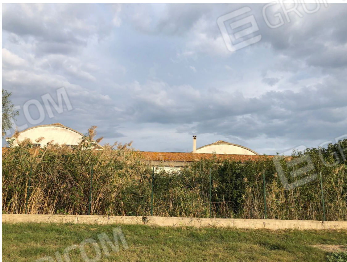
foto 2 – Metaponto, contrada Mercuragno – edificio misto f. 43 ptc. 182 – prospetto posteriore