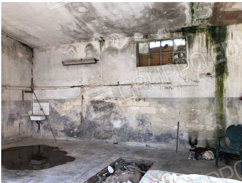
foto 15 – Metaponto, contrada Mercuragno - palazzina uso misto - f. 43 ptc 182 sub. 2 - interno