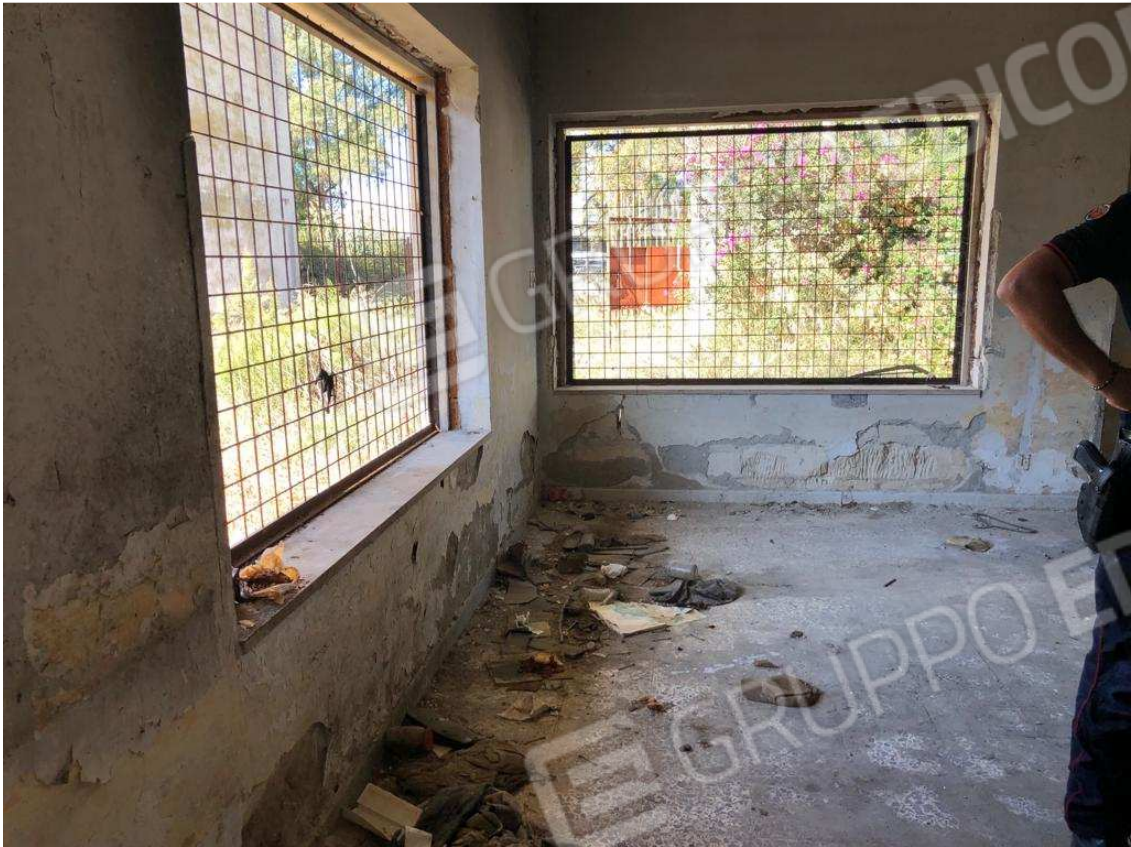
foto 13 – Metaponto, contrada Mercuragno - ex palazzina uffici f. 43 ptc. 177 - interno