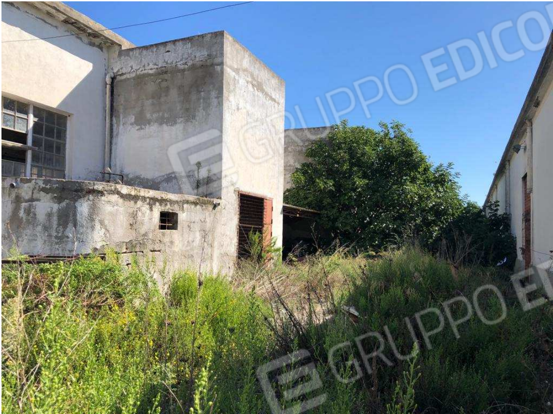
foto 17 – Metaponto, contrada Mercuragno - capannoni - f. 43 ptc 180 e 181 – prospetti laterali