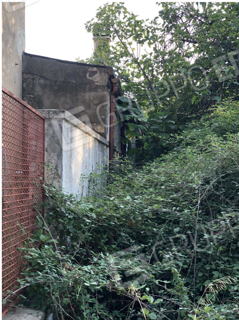
foto 1 – Metaponto, contrada Mercuragno – muro di cinta fronte ovest- f. 43 ptc. 182