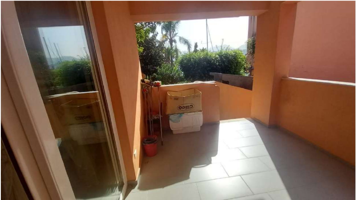
particolare del portico