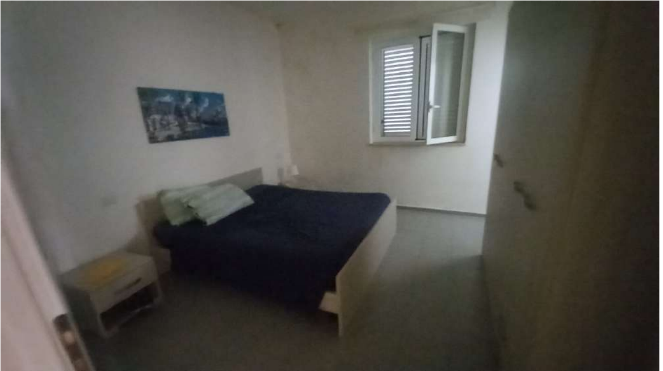
Camera matrimoniale con bagno in camera