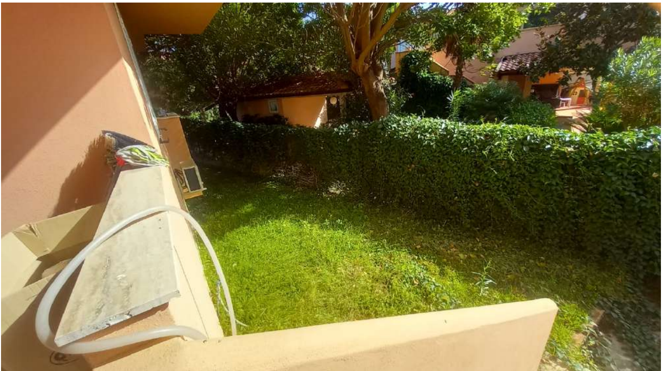
particolare del giardino esterno