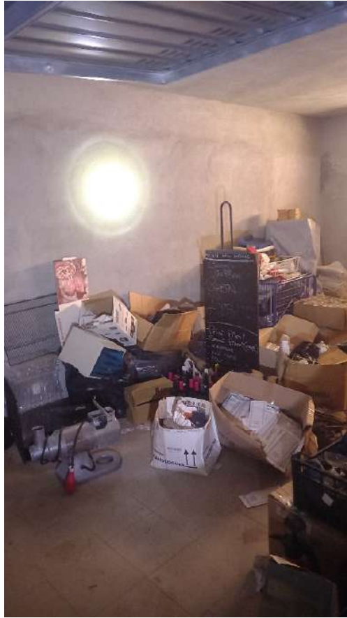
PARTICOLARE DELLA CANTINA SUB. 23 –