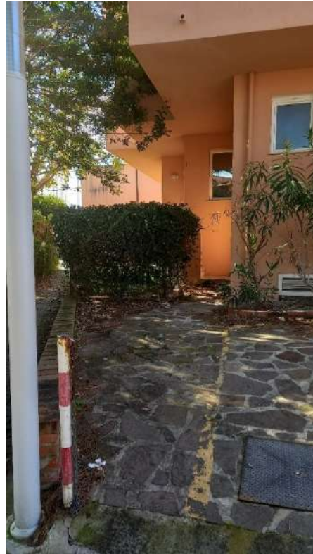
accesso pedonale dal parcheggio sub. 12