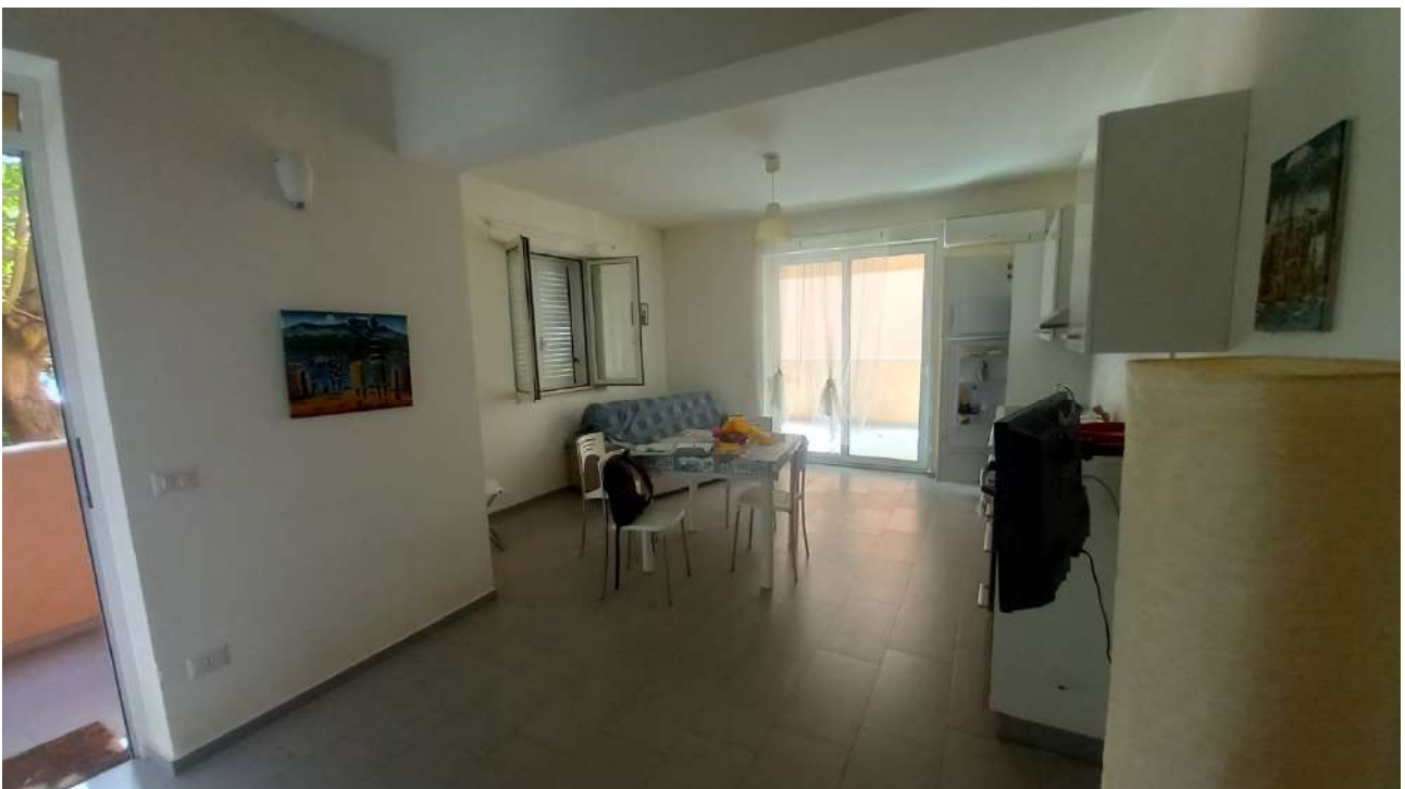
Pranzo soggiorno del villino