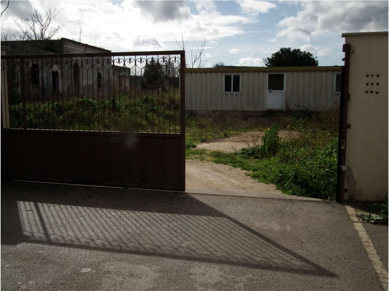
Foto 3: Cannello di accesso al residuo suolo della p.Ila 999 e alle p.Ile 628 e 69