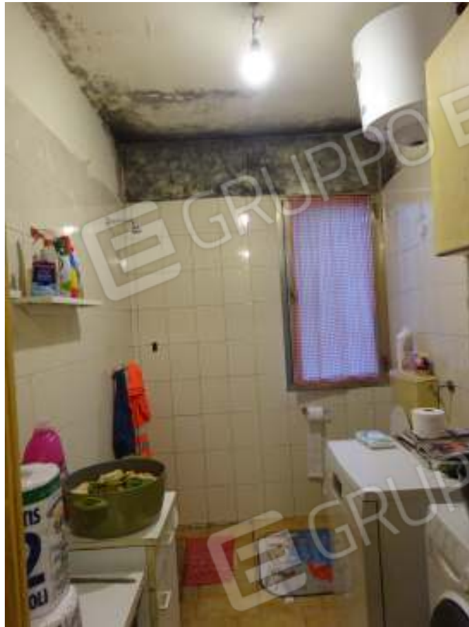
INTERNO FABBRICATO - SUBALTERNO N. 3