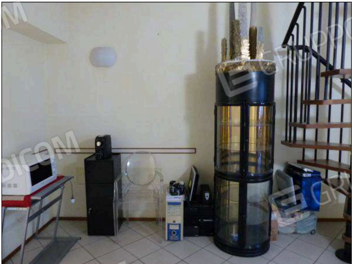
FOTO 35 – Piano secondo: disimpegno in fondo al corridoio, con scala priva di titolo edilizio.