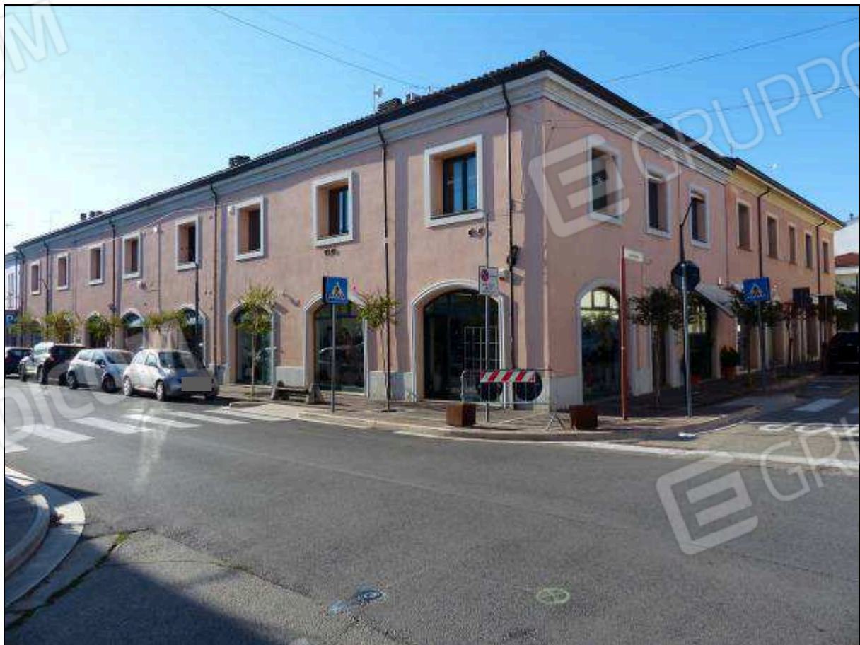
FOTO 2 – Prospetto su Via Bucci, angolo Via Colombari, dell'edificio a cui appartiene l'immobile di interesse.