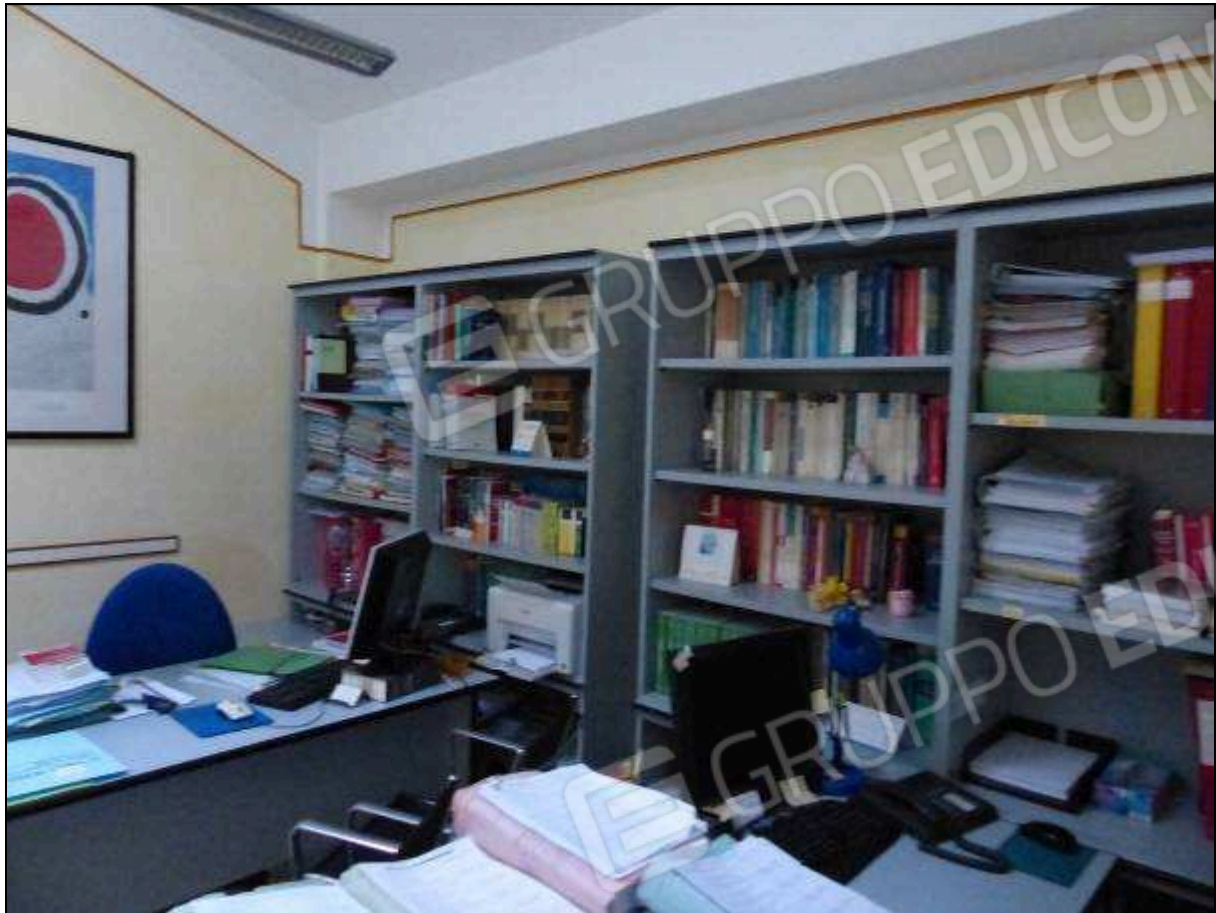
FOTO 28 – Piano secondo: secondo ripostiglio, attualmente arredato e utilizzato come ufficio.