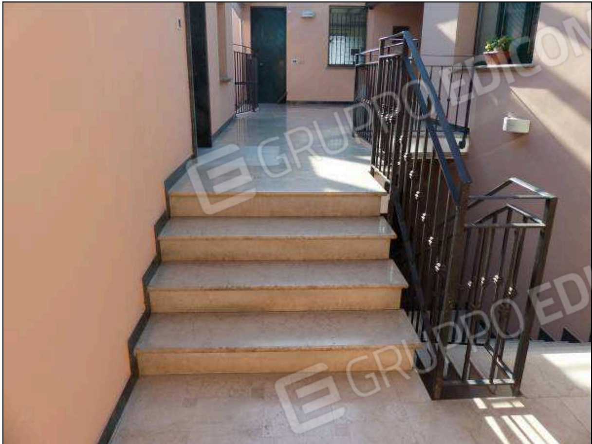
FOTO 10 – Scala condominiale, tra i piani primo e secondo, comune all'unità immobiliare di interesse.