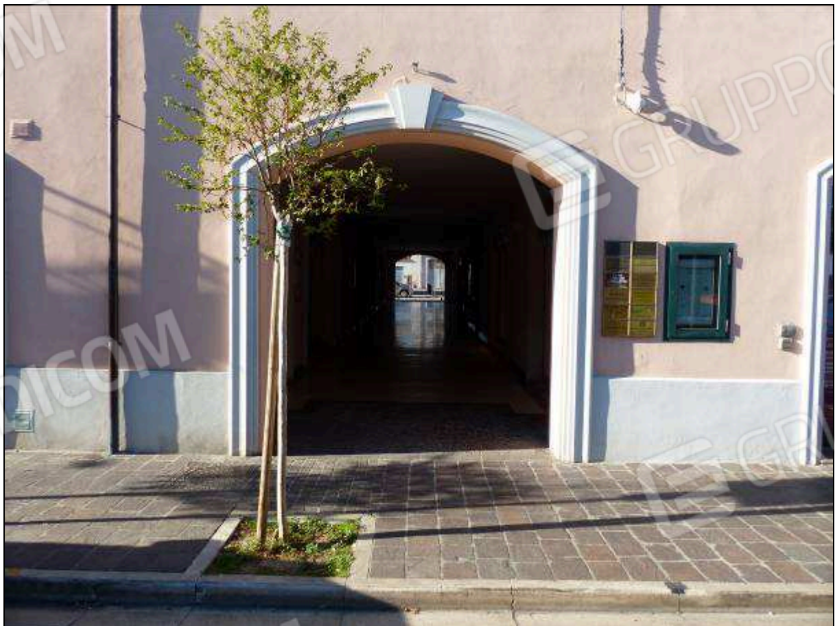
FOTO 4 – Portale di ingresso, in affaccio su Via Bucci, che conduce alla galleria comune.