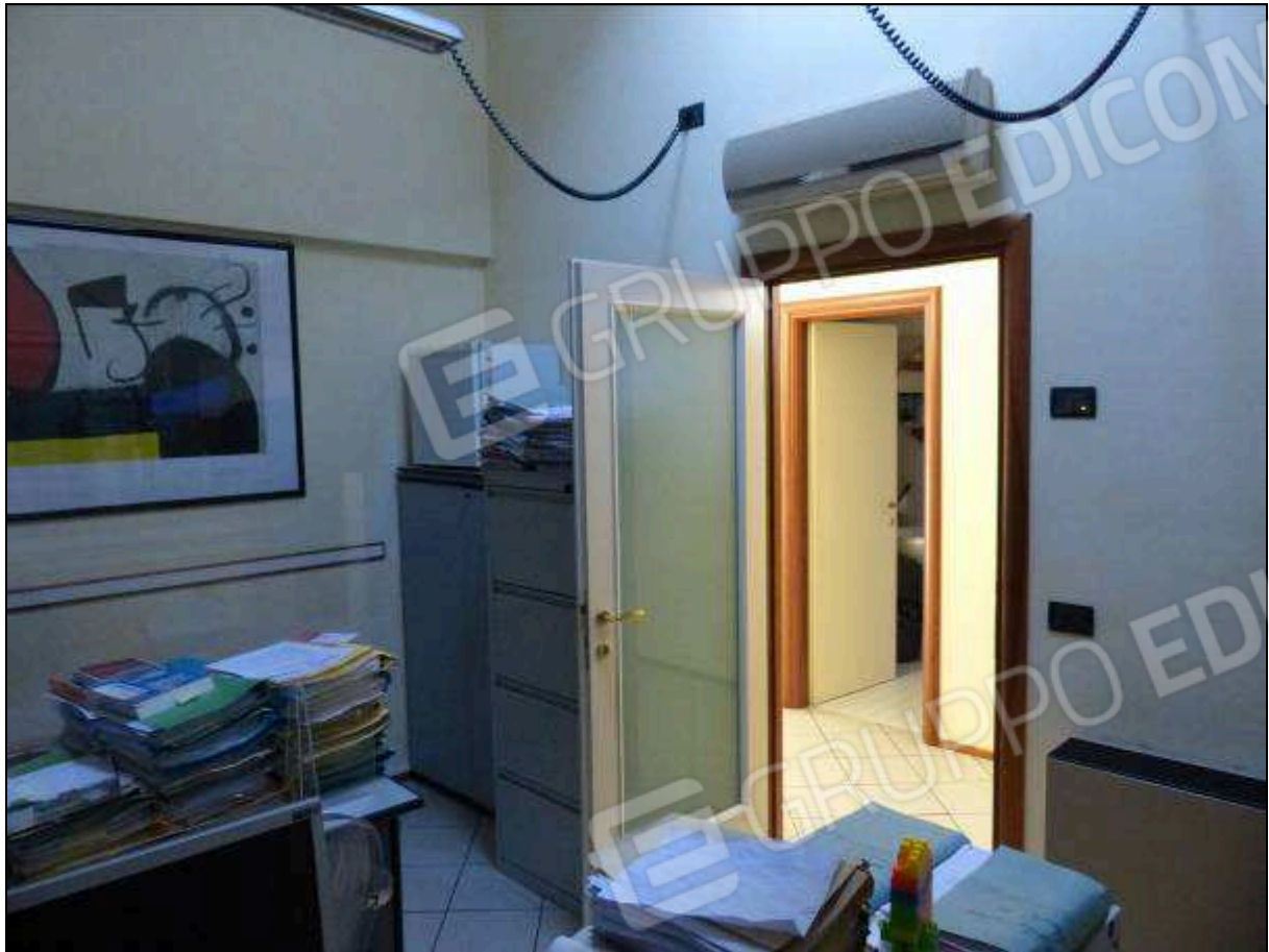
FOTO 23 – Piano secondo: primo ripostiglio, attualmente arredato e utilizzato come ufficio.