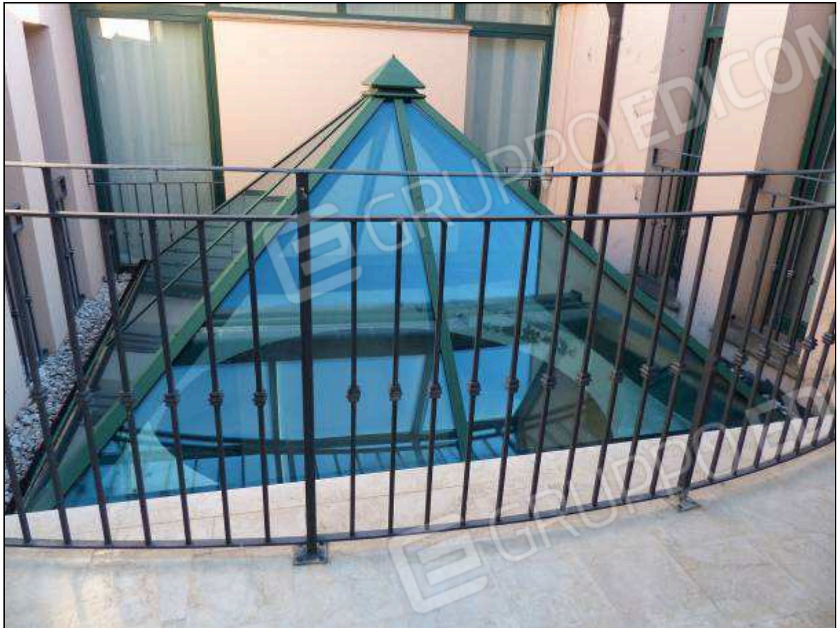
FOTO 12 – Piano secondo: pozzo di luce condominiale, comune all'unità immobiliare di interesse.