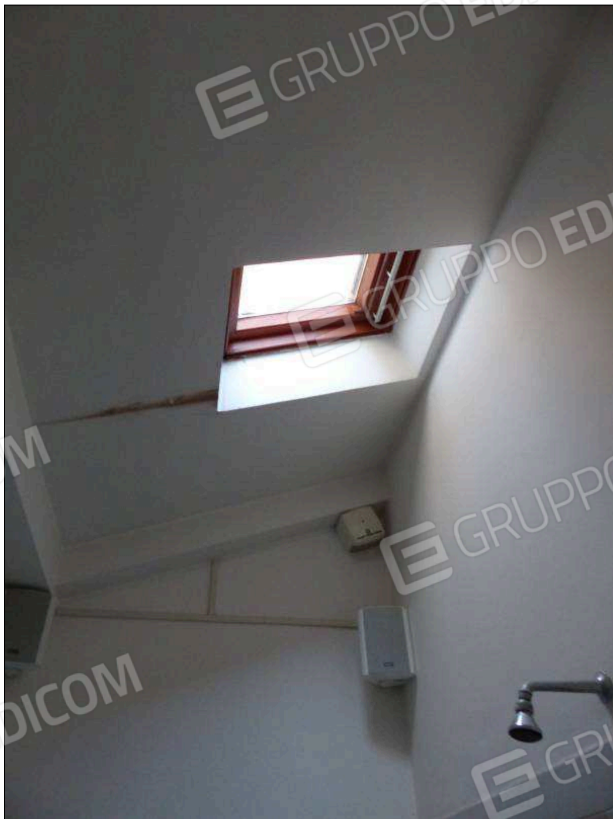
FOTO 22 – Piano secondo: bagno dell'unità immobiliare in oggetto, con lucernario non supportato dai necessari titoli edilizi (da assoggettare a sanatoria).