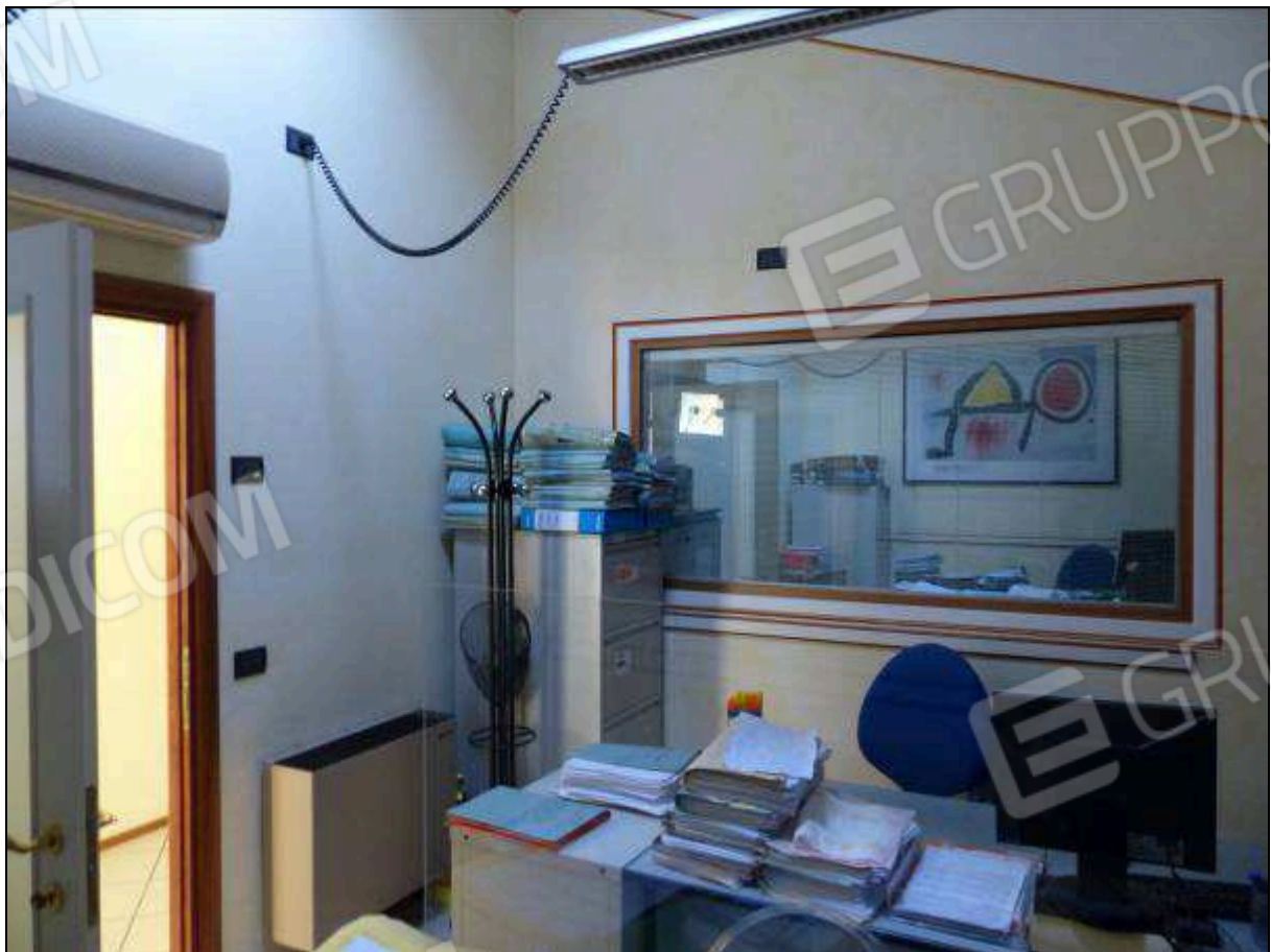
FOTO 24 – Piano secondo: primo ripostiglio, attualmente arredato e utilizzato come ufficio.