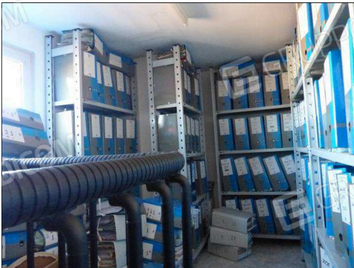
FOTO 38 – Piano terzo: ripostiglio, non supportato dai necessari titoli edilizi, da assoggettare a demolizione.