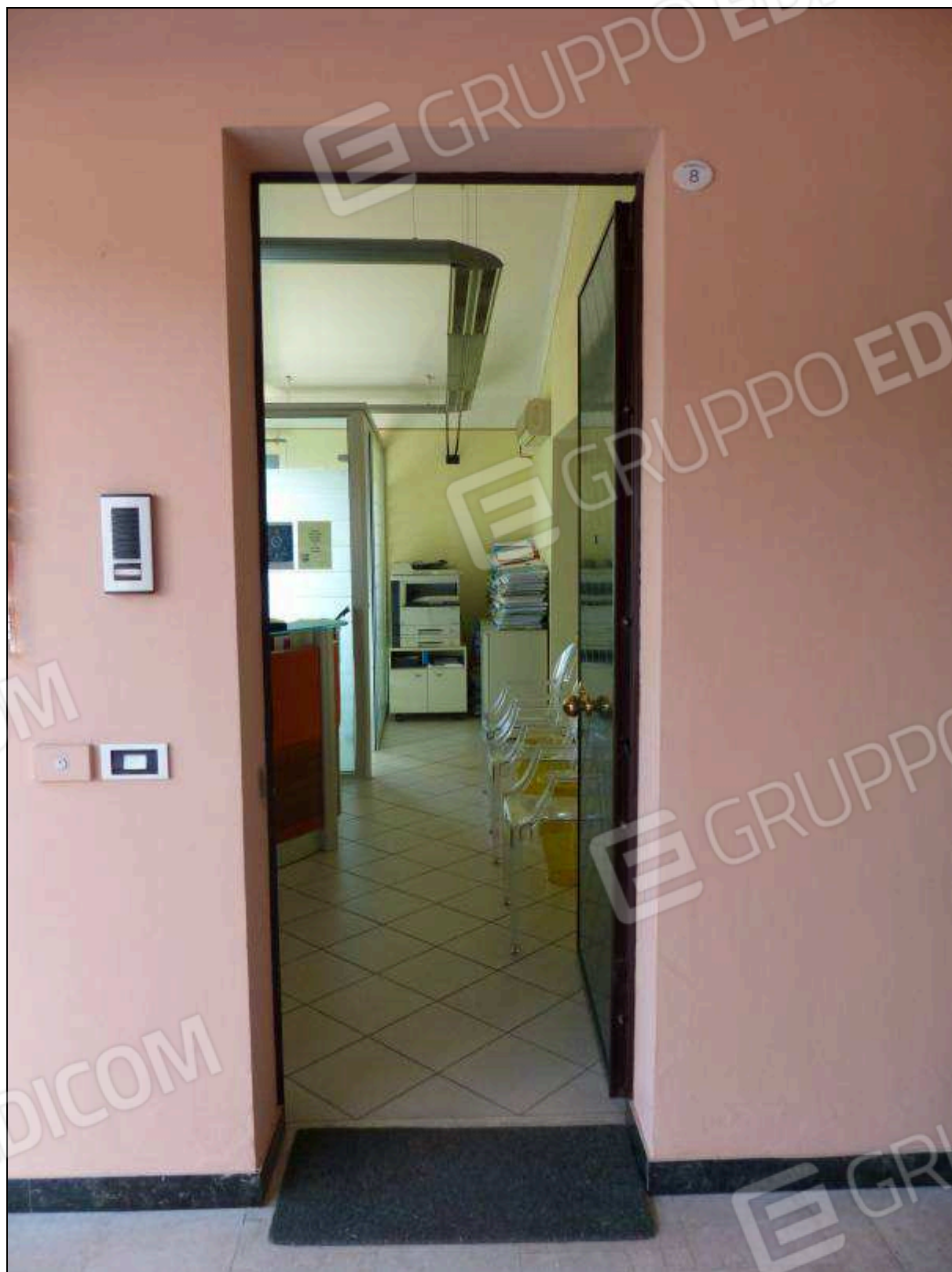
FOTO 14 – Piano secondo: ingresso all'unità immobiliare in oggetto.