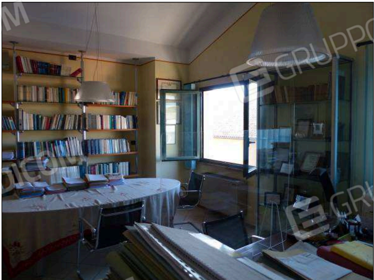
FOTO 31 – Piano secondo: ufficio sul retro dell'unità immobiliare in oggetto.