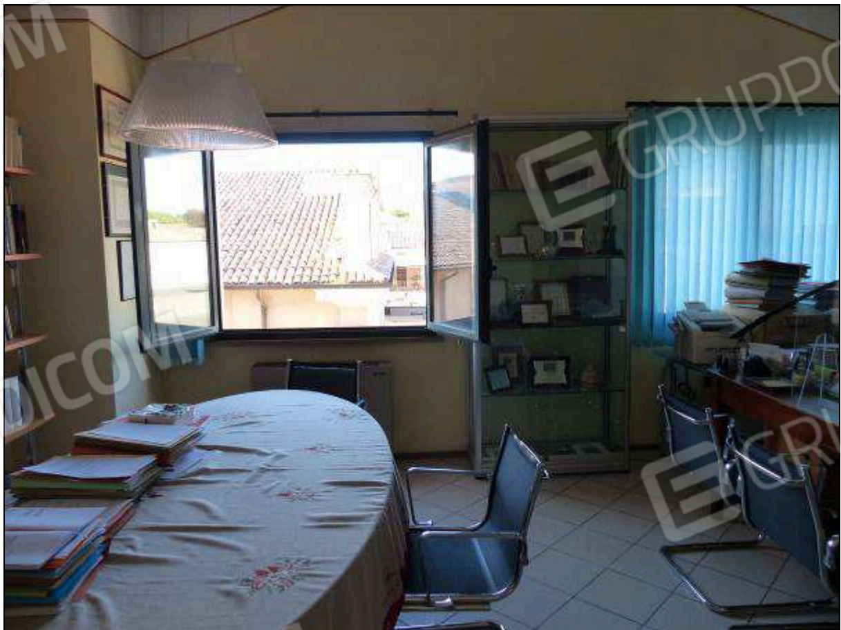
FOTO 33 – Piano secondo: ufficio sul retro dell'unità immobiliare in oggetto.