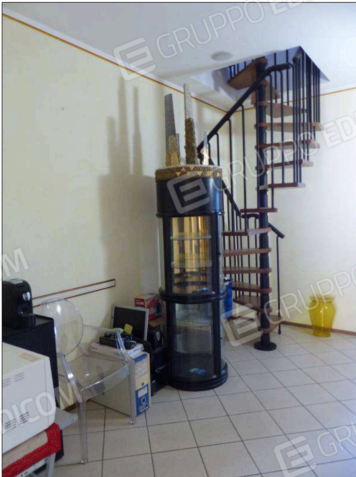
FOTO 36 – Piano secondo: scala interna, di collegamento al ripostiglio di piano terzo, non supportata dai necessari titoli edilizi (da assoggettare a rimozione per ripristino dei luoghi).