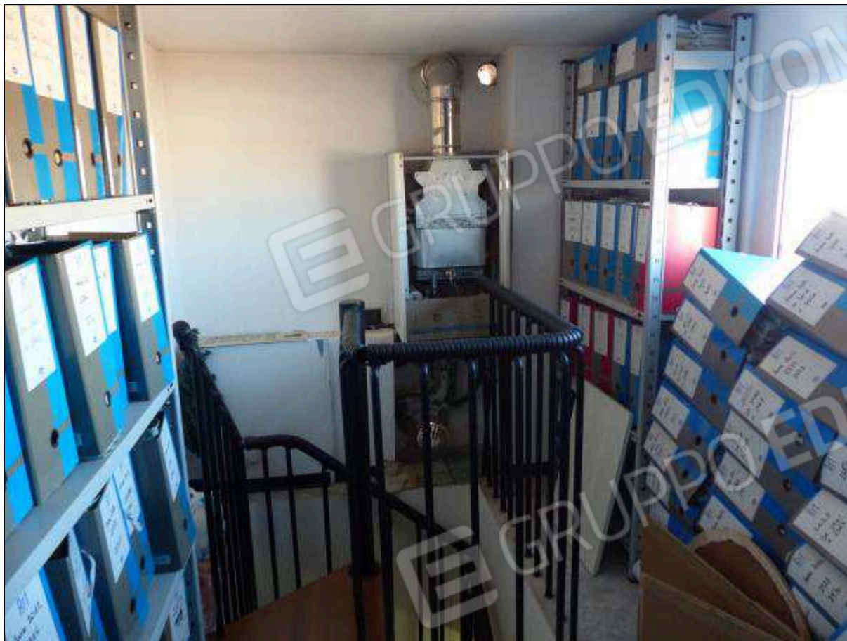
FOTO 37 – Piano terzo: ripostiglio, non supportato dai necessari titoli edilizi, da assoggettare a demolizione.