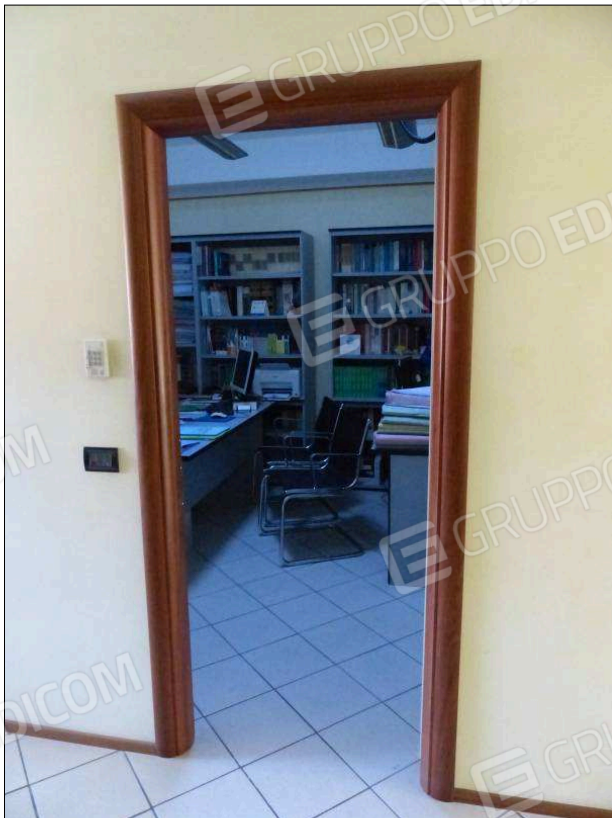
FOTO 25 – Piano secondo: ingresso del secondo ripostiglio, attualmente arredato e utilizzato come ufficio.