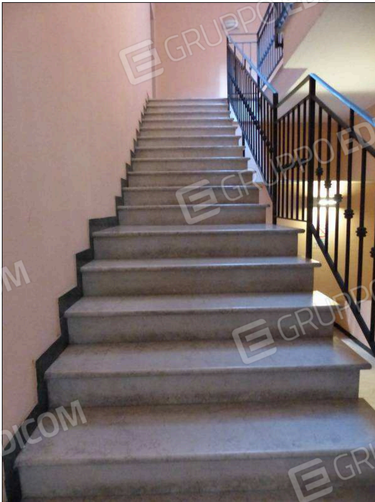
FOTO 7 – Scala condominiale, tra i piani terra e primo, comune all'unità immobiliare di interesse.