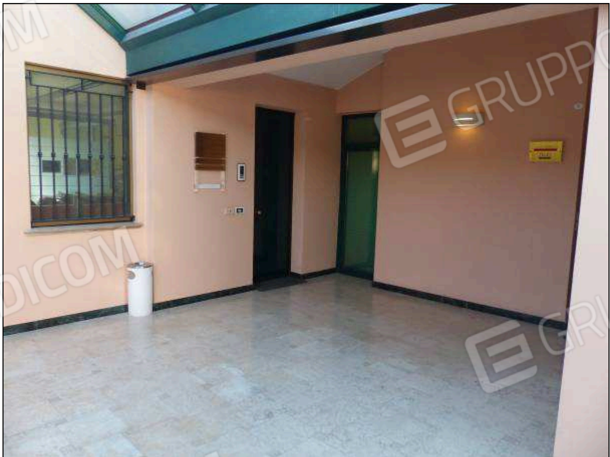
FOTO 13 – Piano secondo: pianerottolo comune di ingresso all'unità immobiliare di interesse.