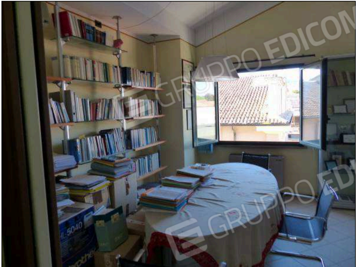
FOTO 30 – Piano secondo: ufficio sul retro dell'unità immobiliare in oggetto.