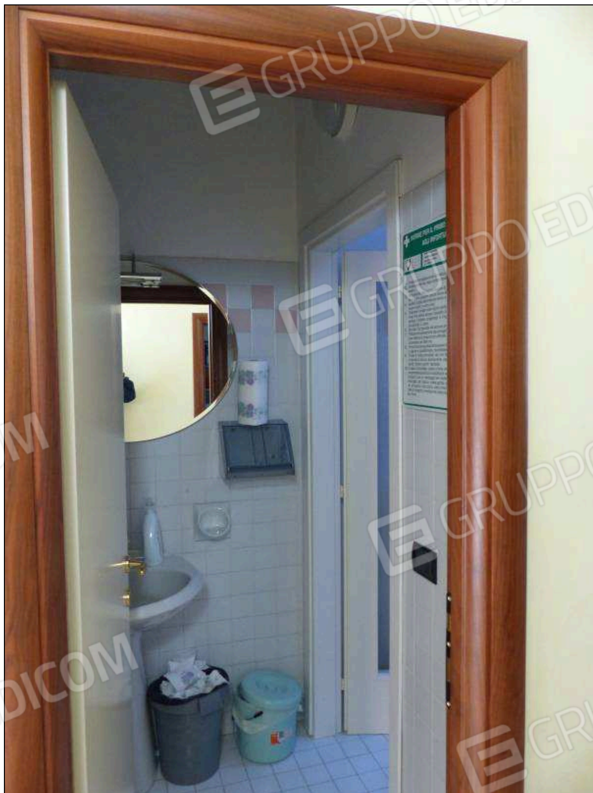
FOTO 20 – Piano secondo: anti bagno dell'unità immobiliare in oggetto.