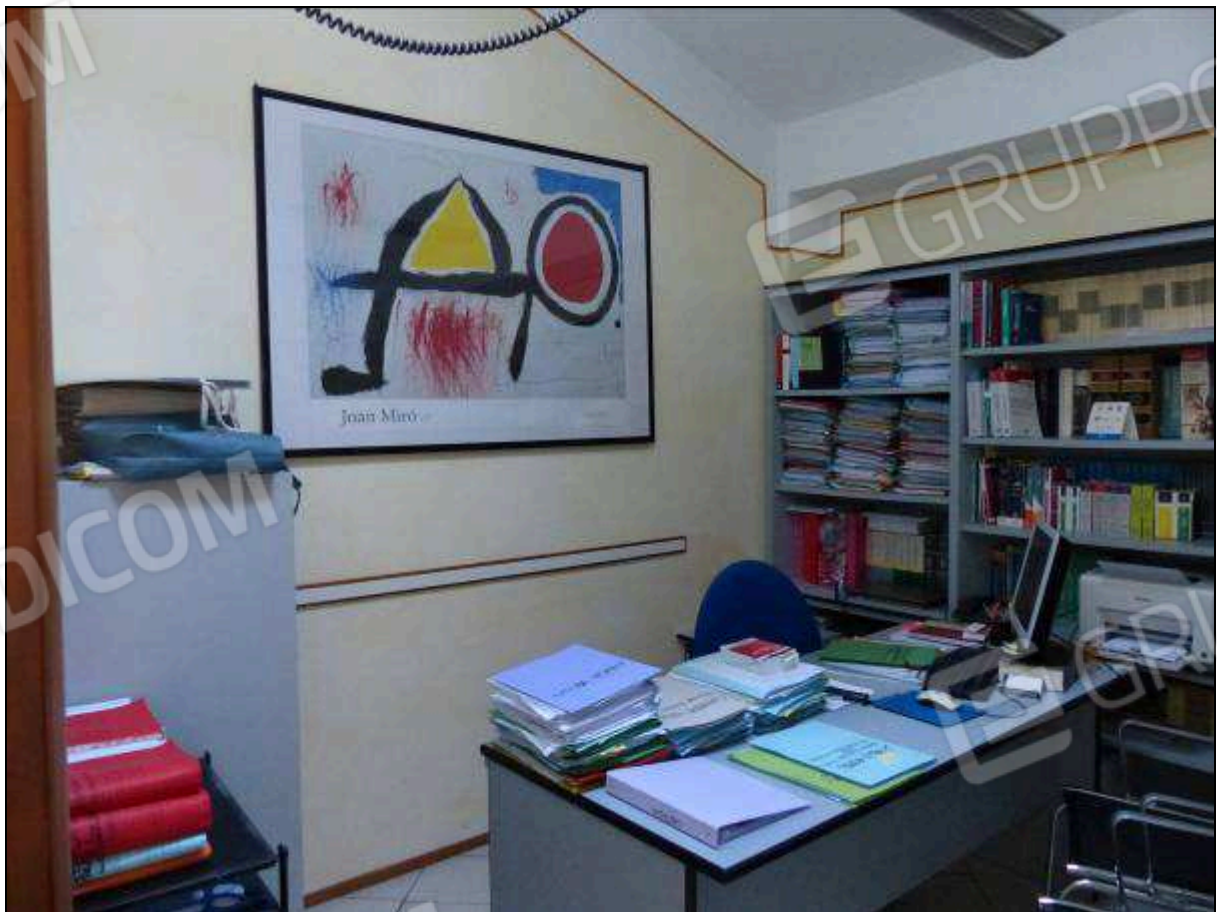
FOTO 27 – Piano secondo: secondo ripostiglio, attualmente arredato e utilizzato come ufficio.