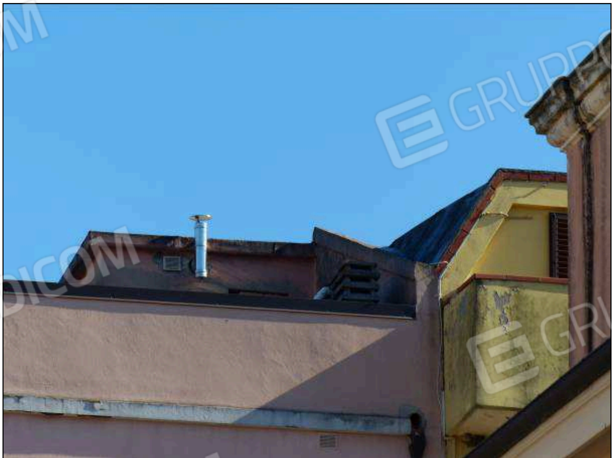
FOTO 40 – Prospetto retro: volume sulla copertura, non supportato dai necessari titoli edilizi, da rimuovere.