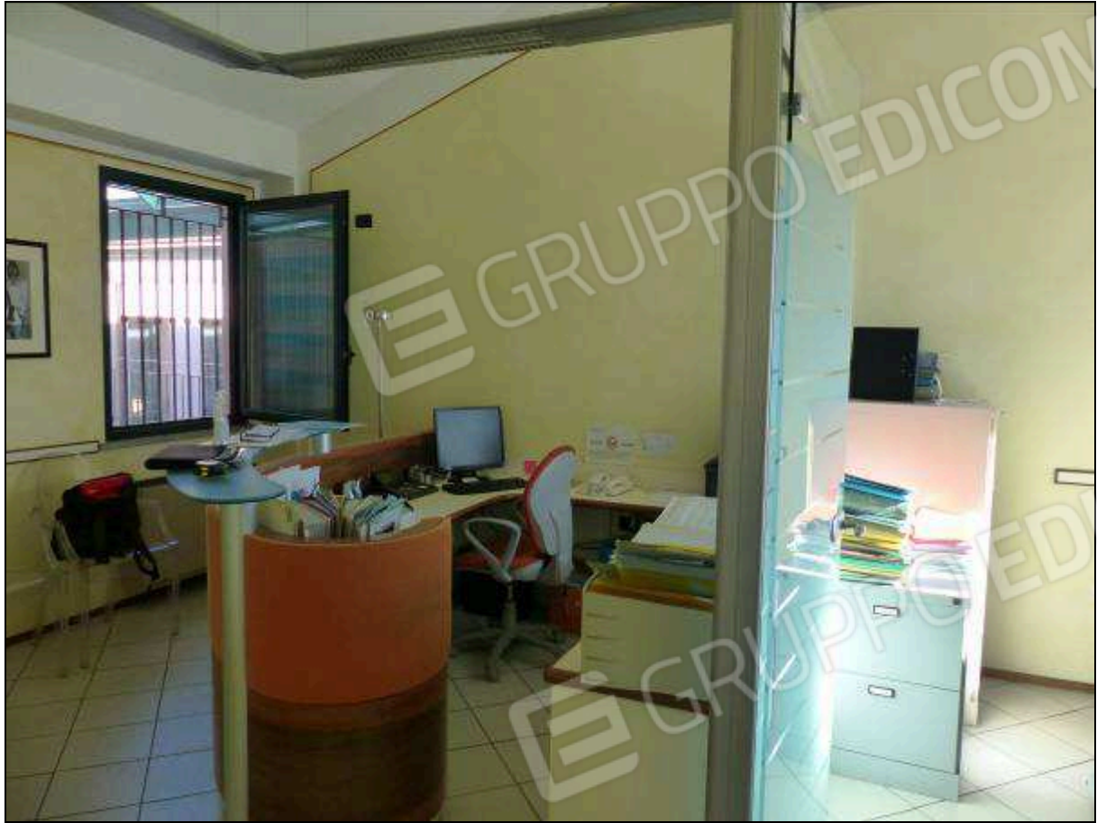
FOTO 17 – Piano secondo: ufficio all'ingresso dell'unità immobiliare in oggetto.