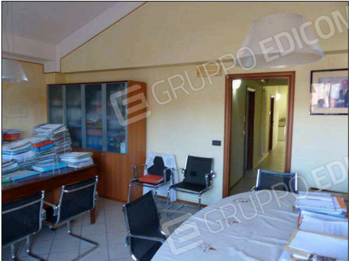
FOTO 34 – Piano secondo: ufficio sul retro dell'unità immobiliare in oggetto.