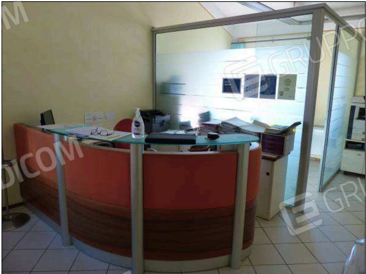
FOTO 16 – Piano secondo: ufficio all'ingresso dell'unità immobiliare in oggetto.