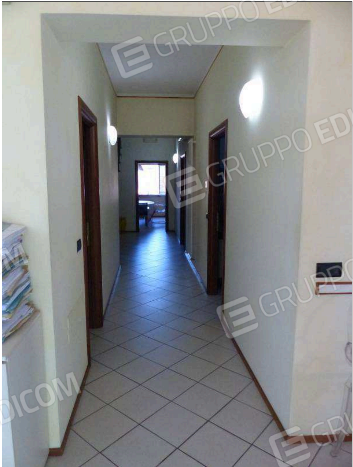
FOTO 19 – Piano secondo: corridoio di disimpegno dell'unità immobiliare in oggetto.