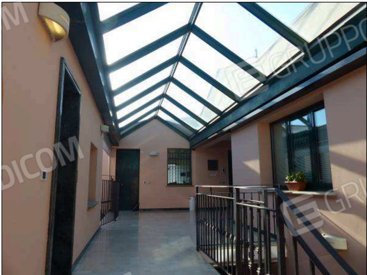
FOTO 11 – Piano secondo: ballatoio condominiale, comune all'unità immobiliare di interesse.