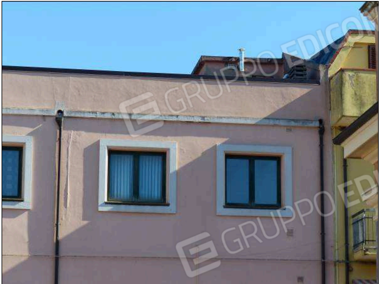
FOTO 39 – Prospetto retro: volume sulla copertura, non supportato dai necessari titoli edilizi, da rimuovere.