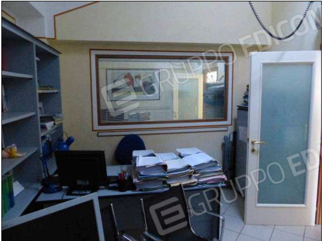
FOTO 26 – Piano secondo: secondo ripostiglio, attualmente arredato e utilizzato come ufficio.