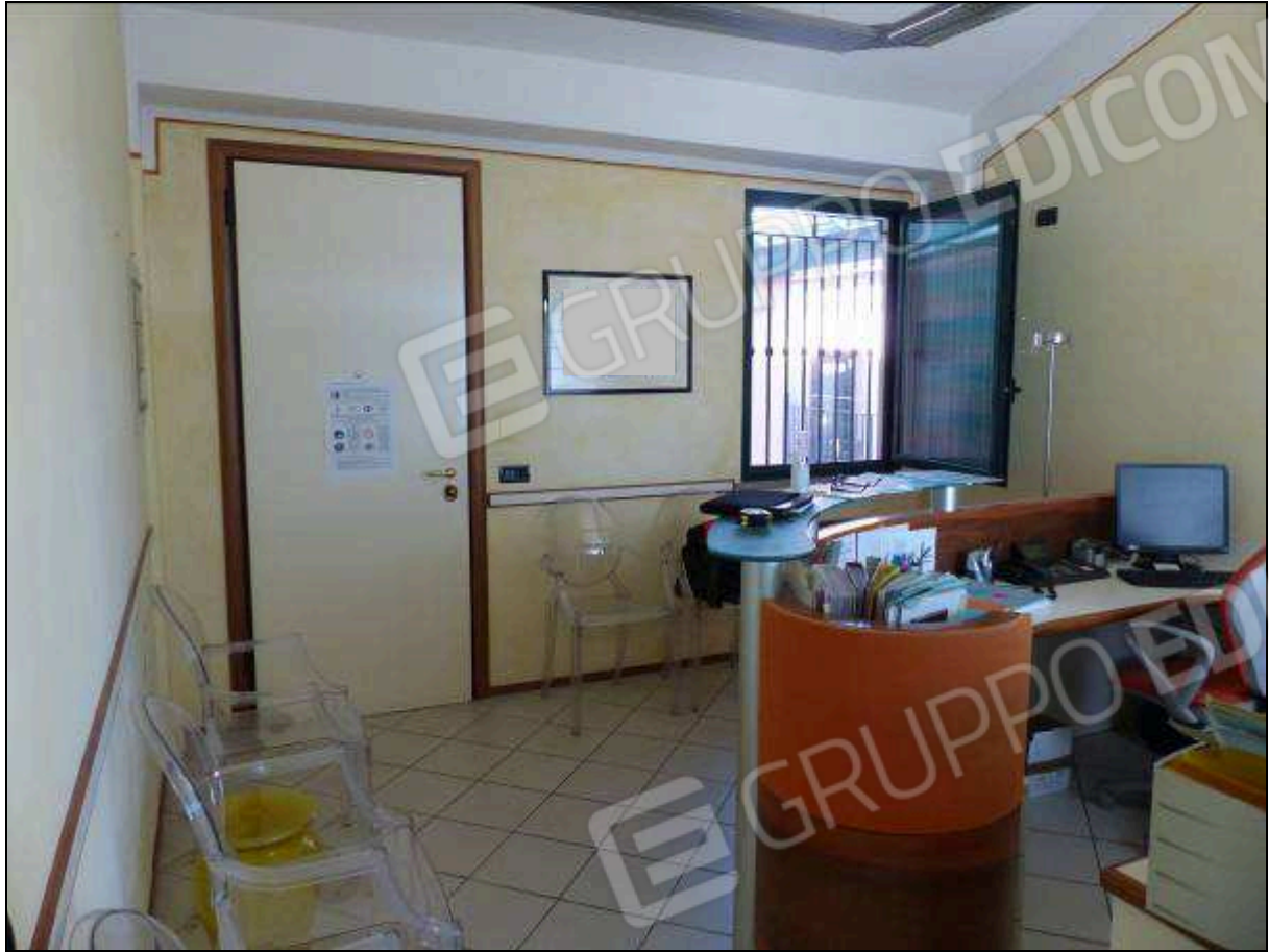
FOTO 15 – Piano secondo: ufficio all'ingresso dell'unità immobiliare in oggetto.