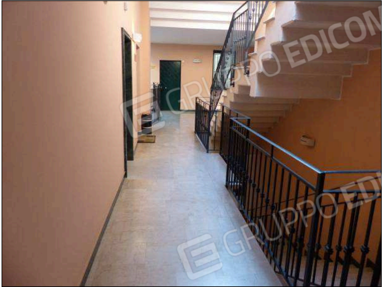
FOTO 8 – Piano primo: ballatoio condominiale, comune all'unità immobiliare di interesse.