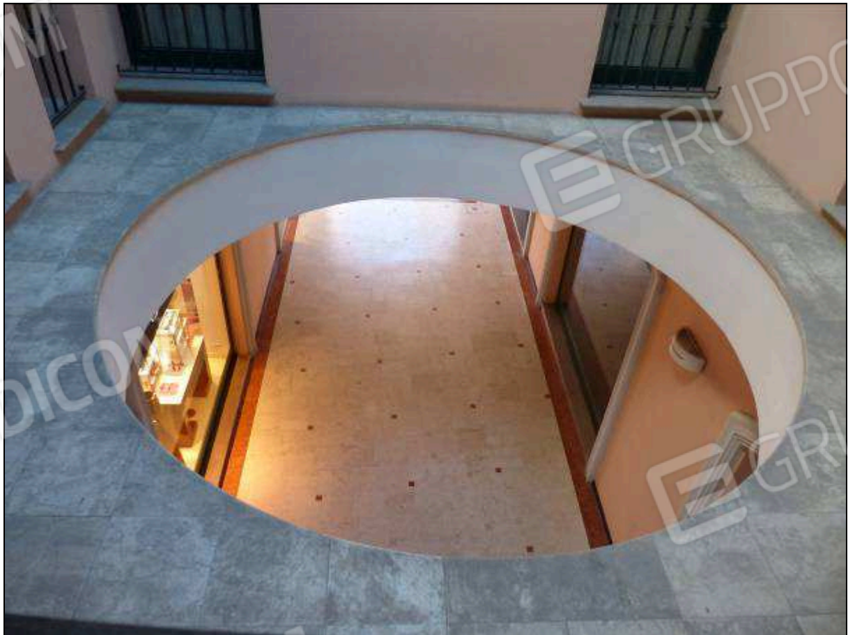
FOTO 9 – Piano primo: pozzo di luce condominiale, comune all'unità immobiliare di interesse.