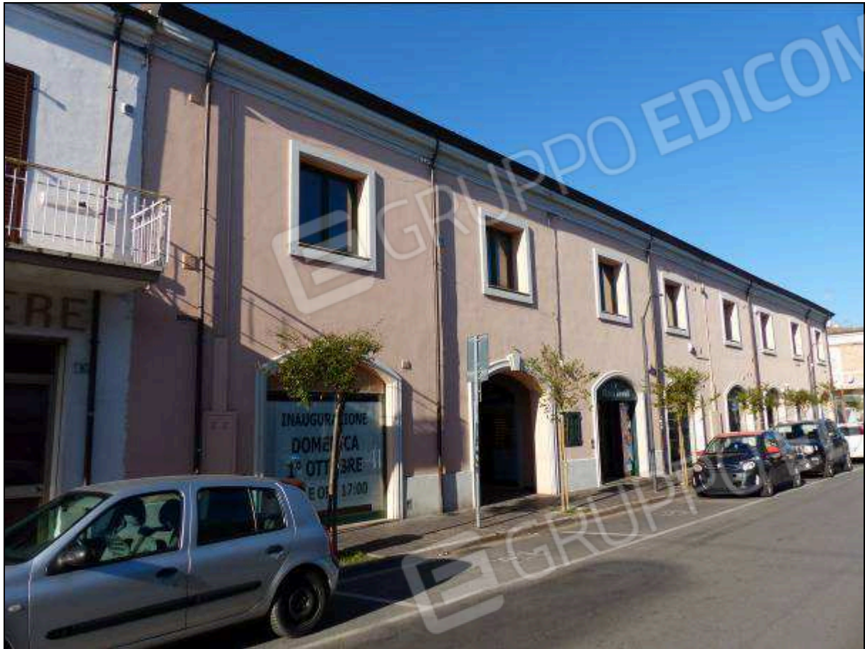
FOTO 1 – Prospetto principale, su Via Bucci, dell'edificio a cui appartiene l'immobile di interesse.