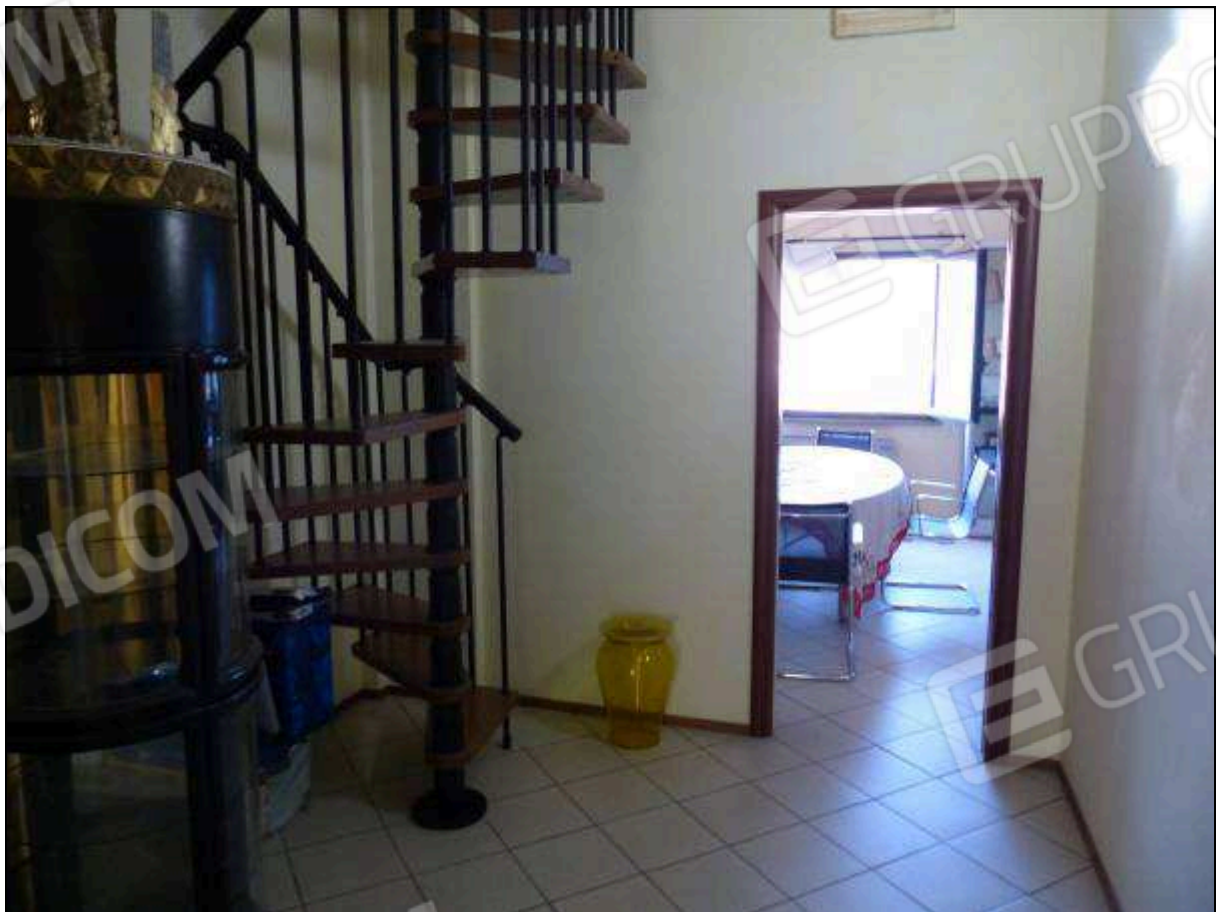
FOTO 29 – Piano secondo: disimpegno di ingresso all'ufficio sul retro.