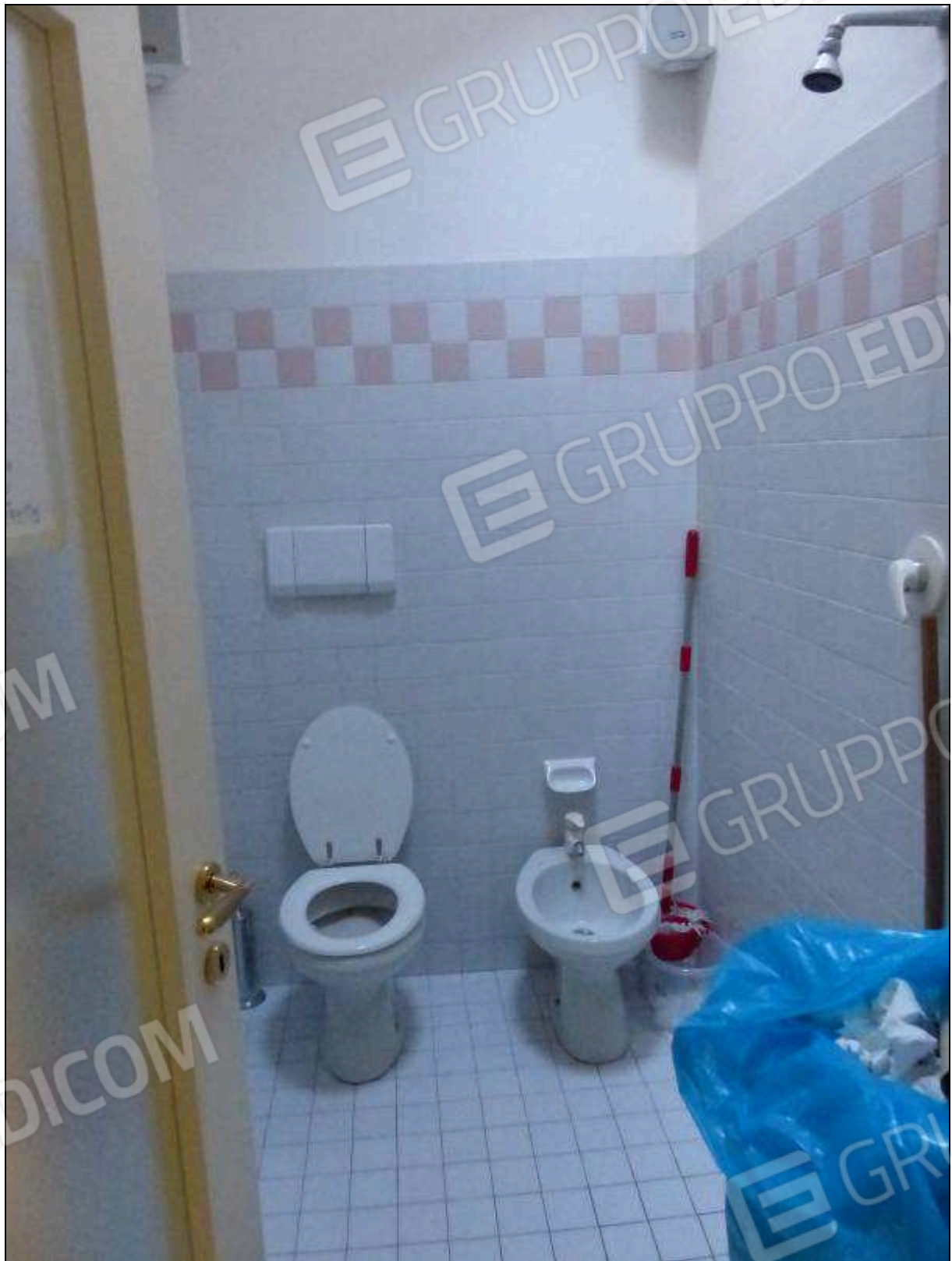
FOTO 21 – Piano secondo: bagno dell'unità immobiliare in oggetto.