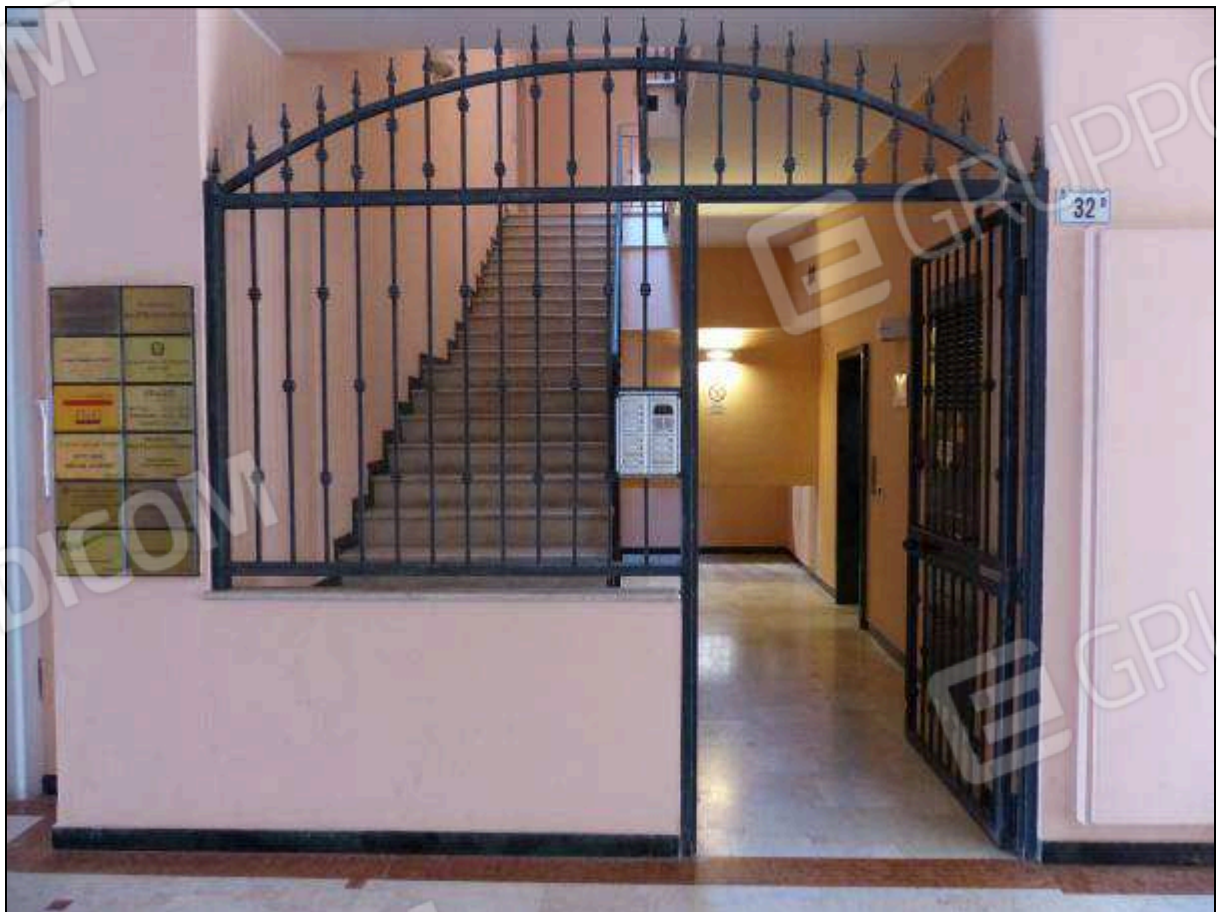
FOTO 6 – Androne di ingresso comune all'unità immobiliare di interesse.