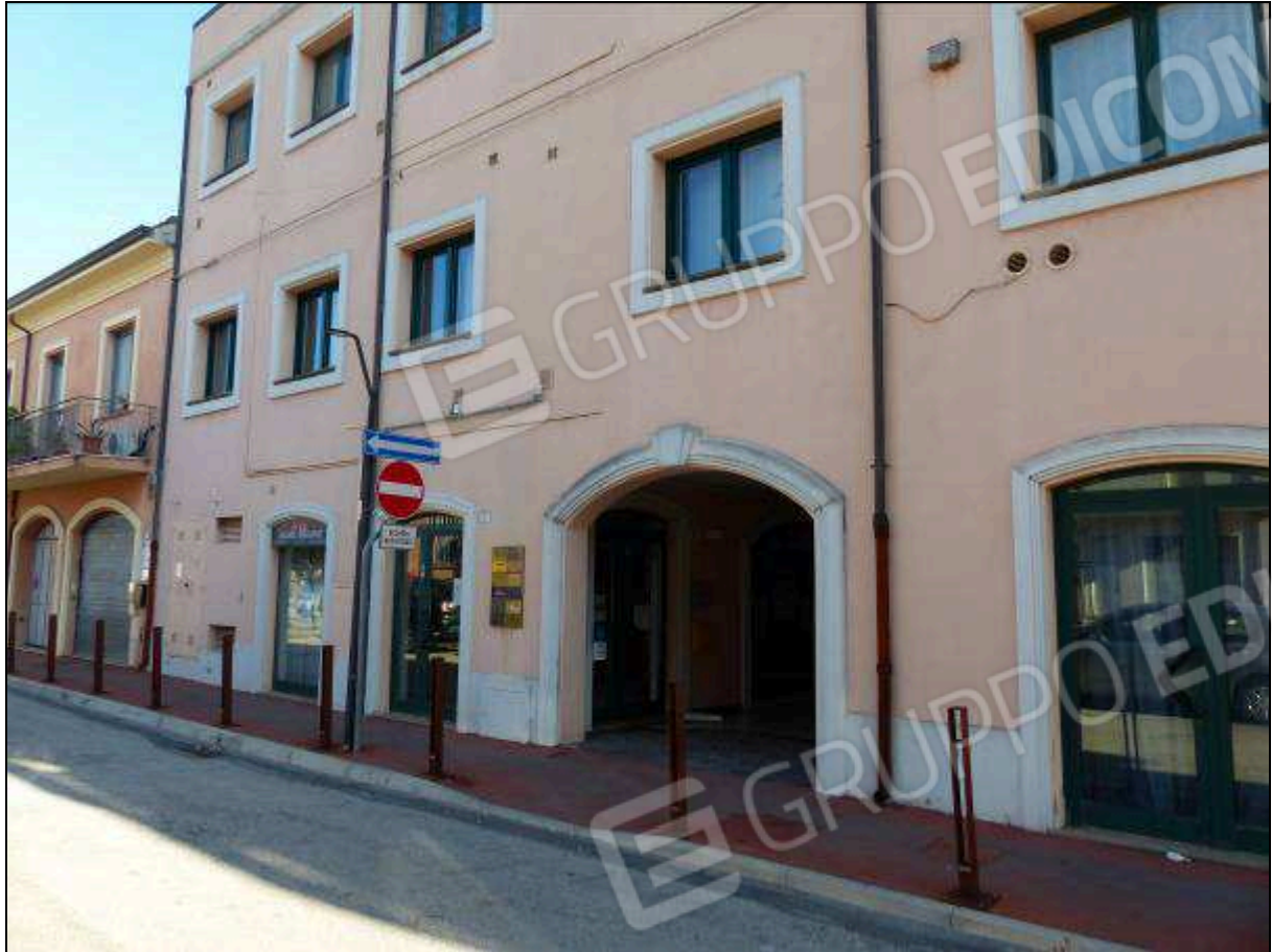
FOTO 3 – Portale di ingresso, in affaccio su Via Bucci, che conduce alla galleria comune.