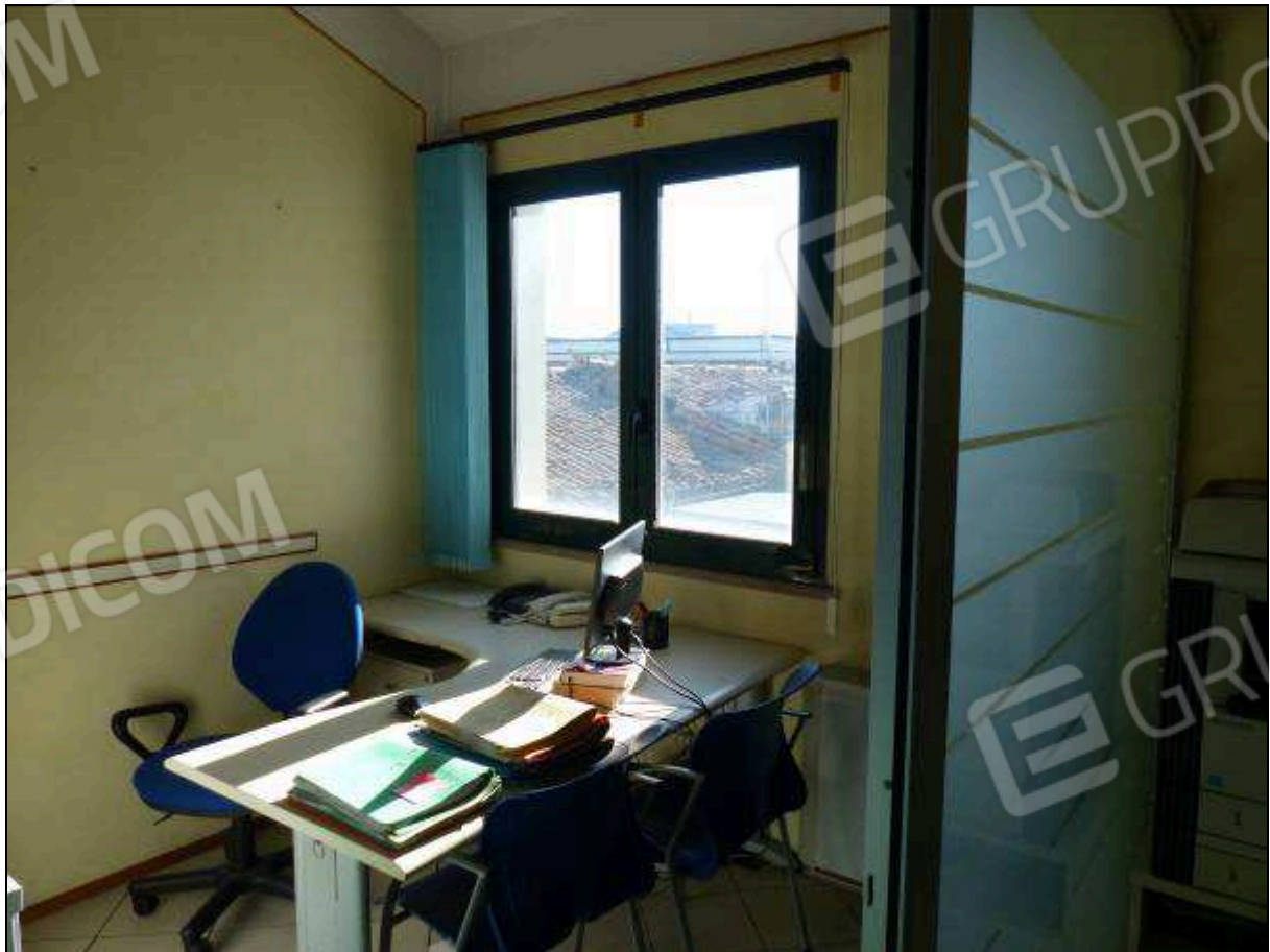
FOTO 18 – Piano secondo: ufficio all'ingresso dell'unità immobiliare in oggetto.