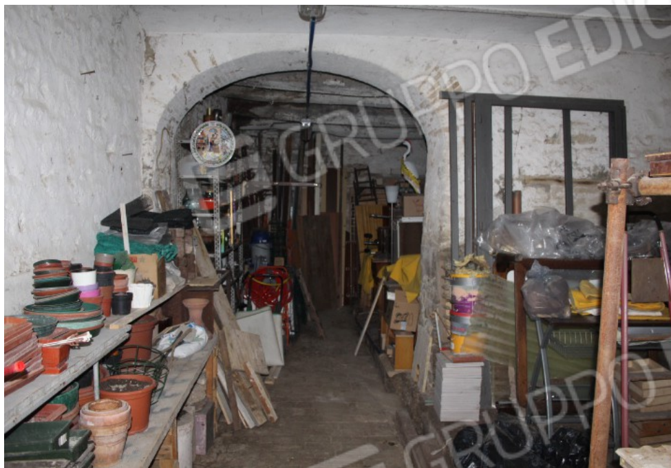
cantina piano terra