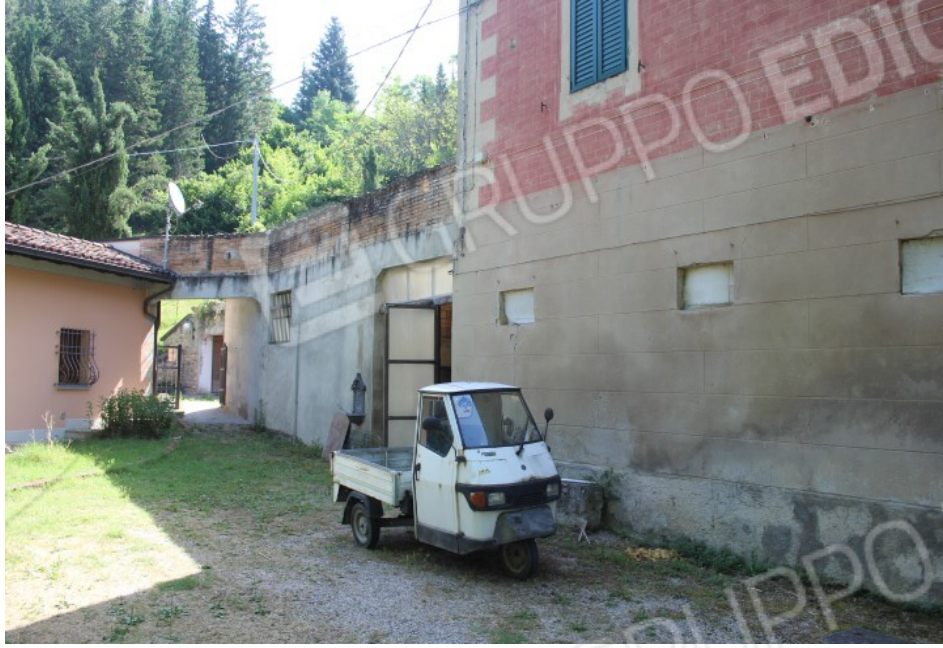
vista sul fianco del fabbricato