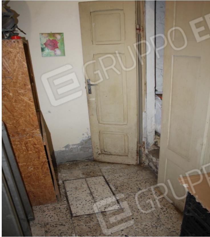
porzione di terrazzo piano primo