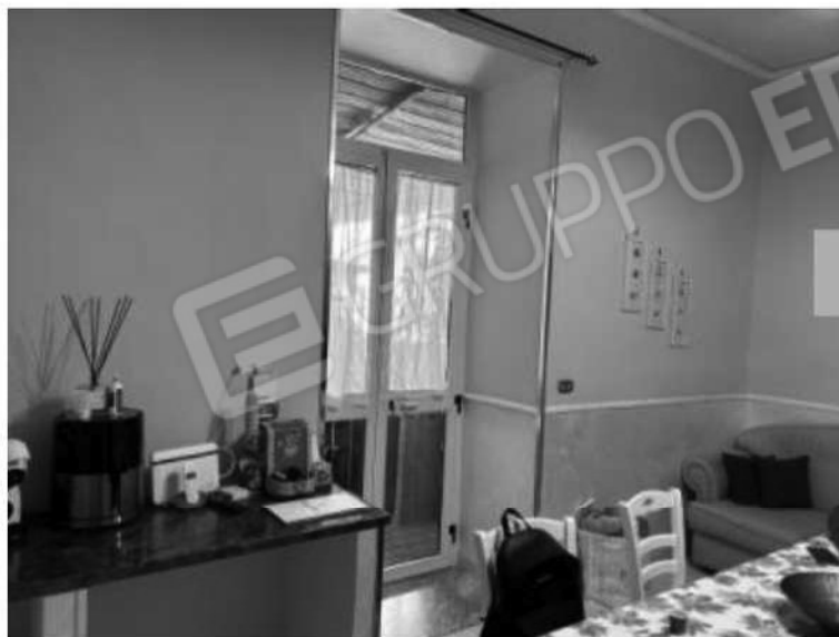
Foto n. 21 – Cucina