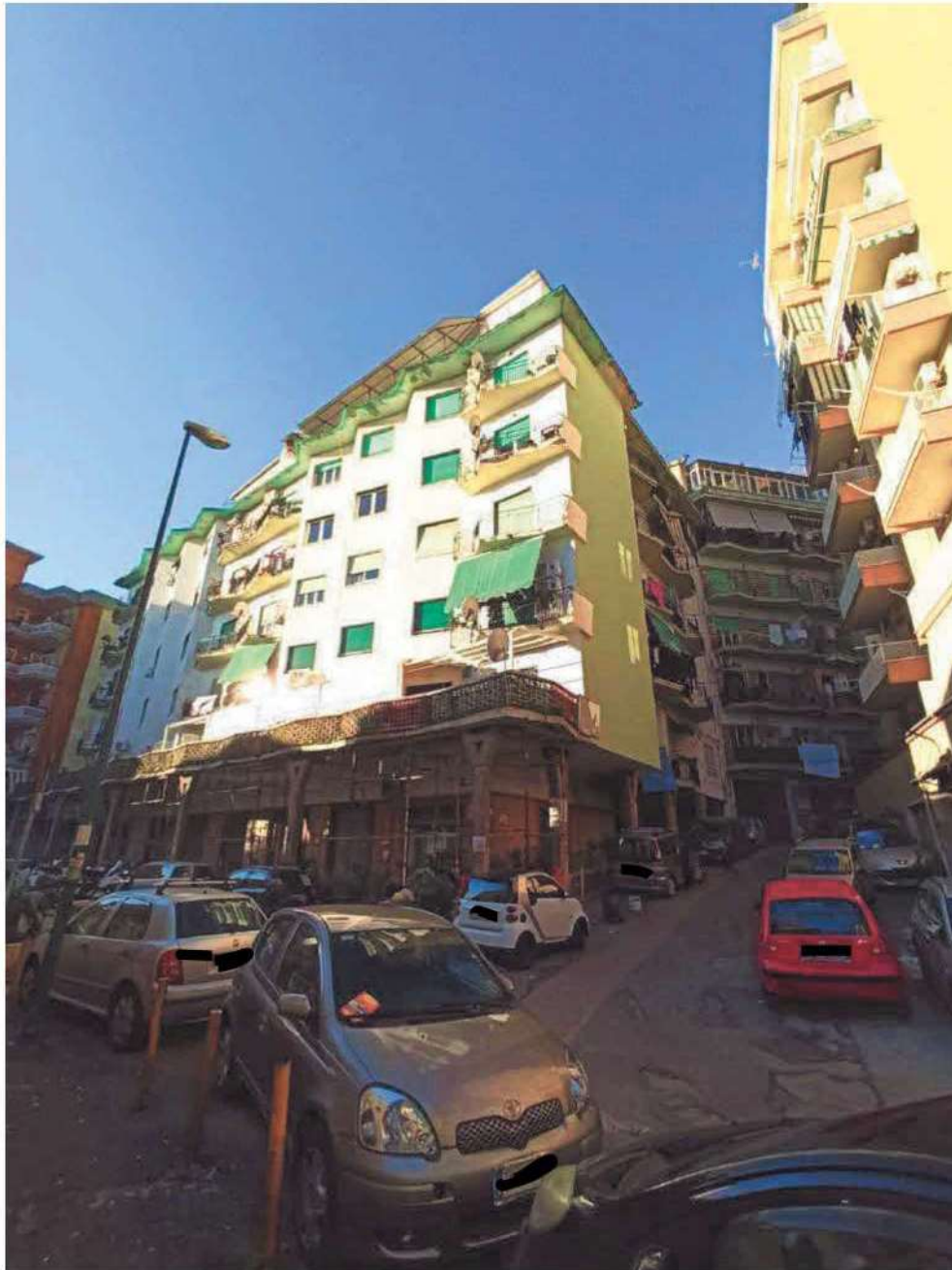
Vista esterna dell'edificio