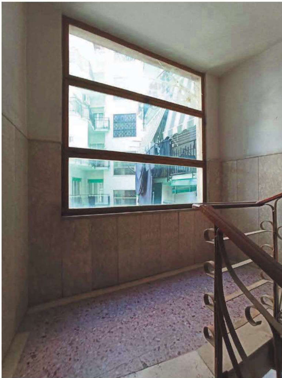
Vano scale interno all'edificio