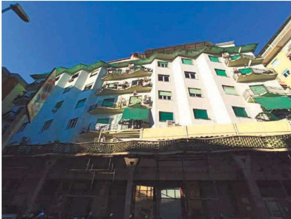
Facciata secondaria edificio