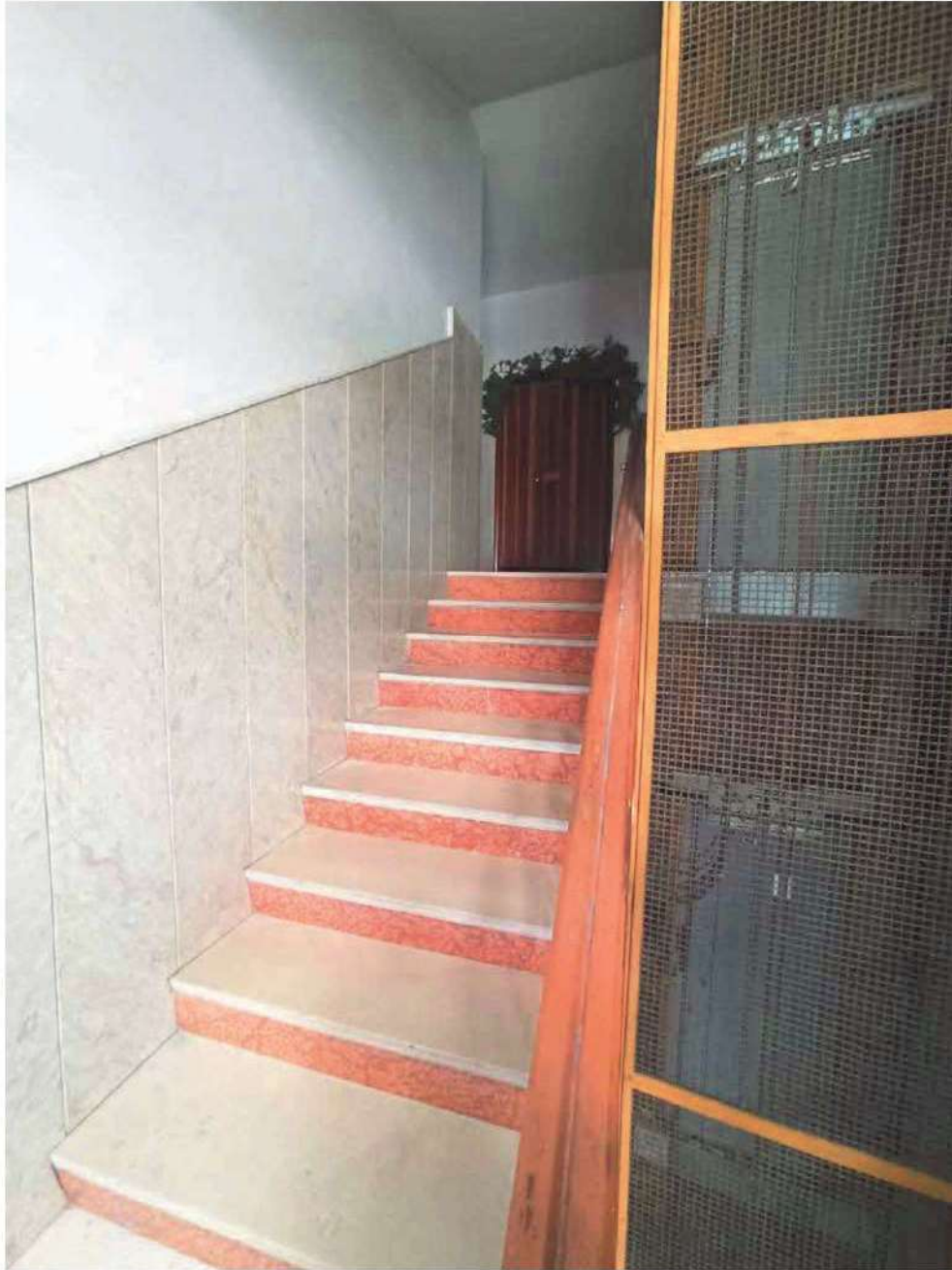
Vano scale interno all'edificio