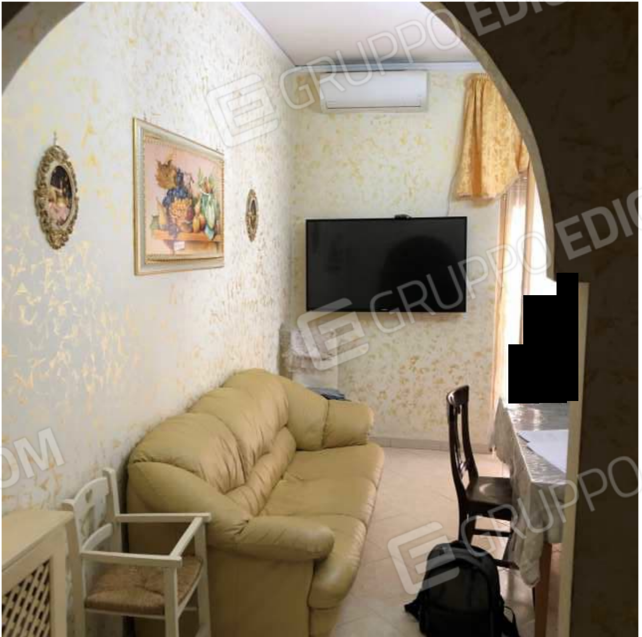
Vista della Cucina e Sala da Pranzo