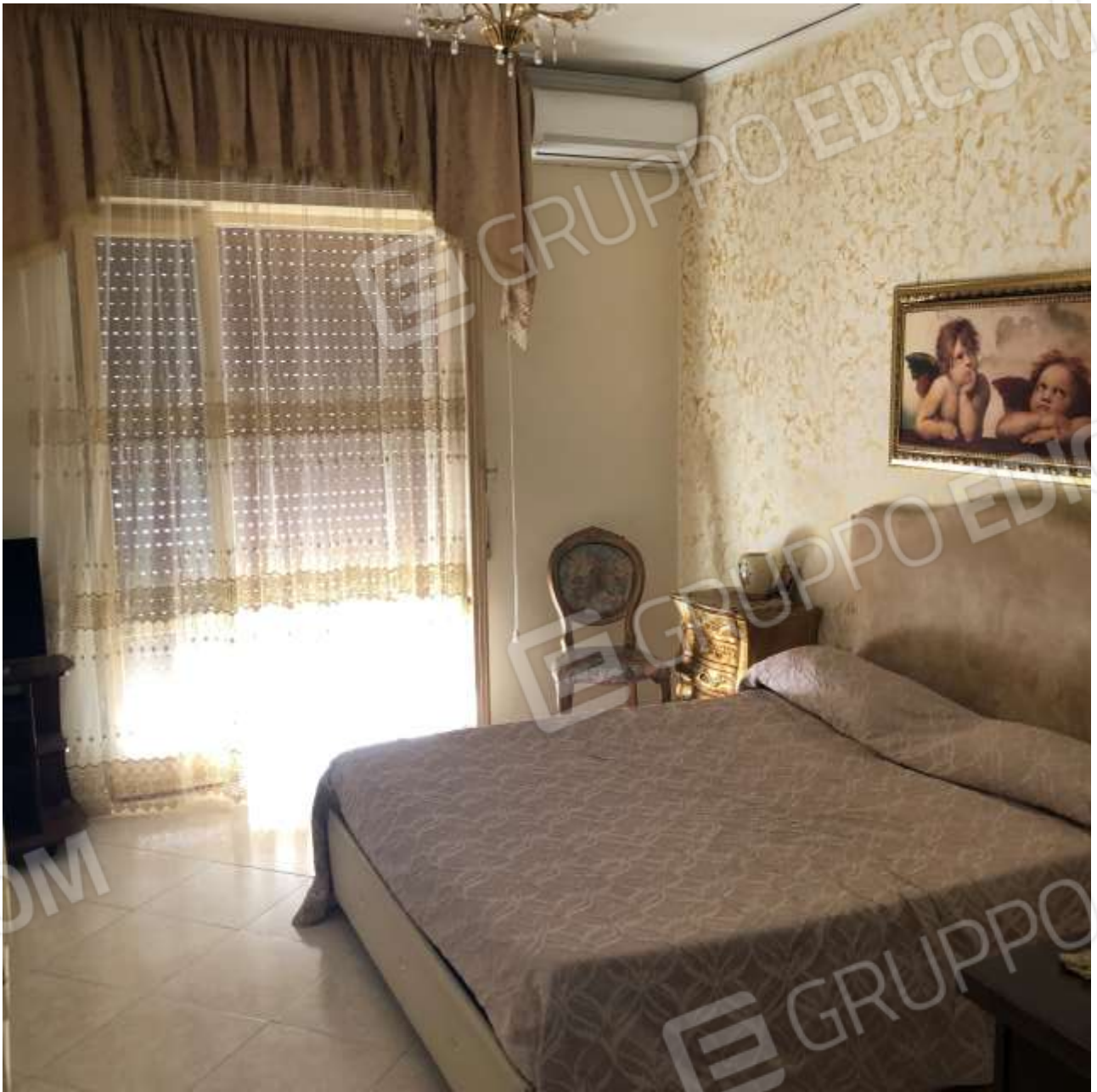
Camera da Letto 2