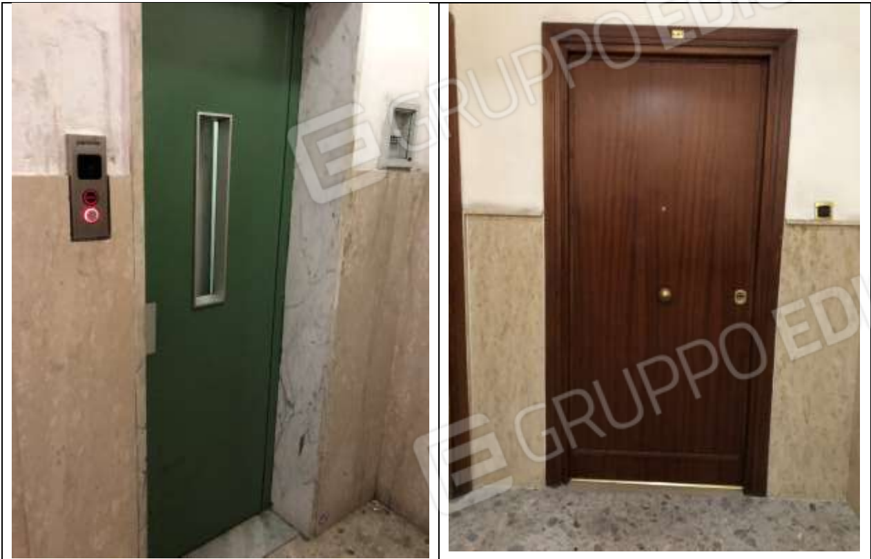
Vista dell'ascensore al piano e della porta di accesso all'unità abitativa