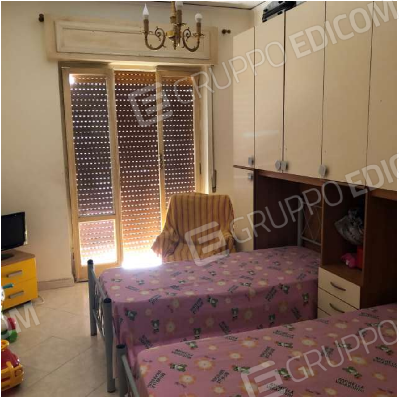
Camera da Letto 1