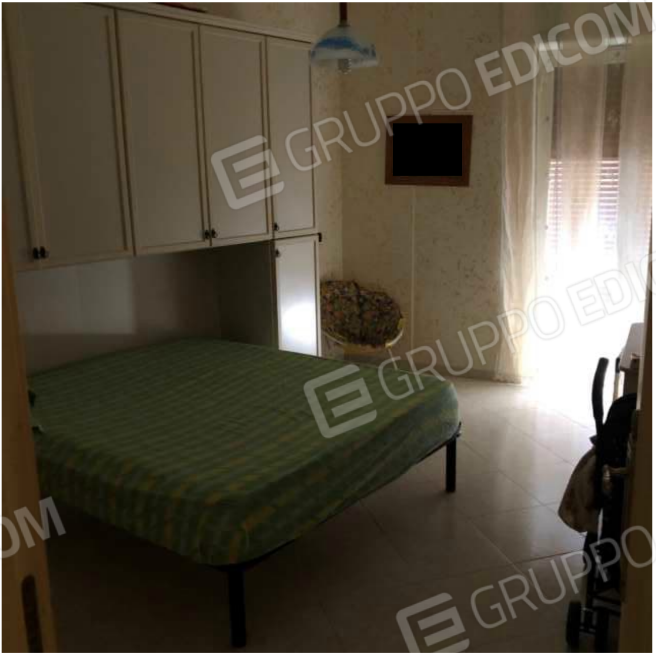
Camera da Letto 3