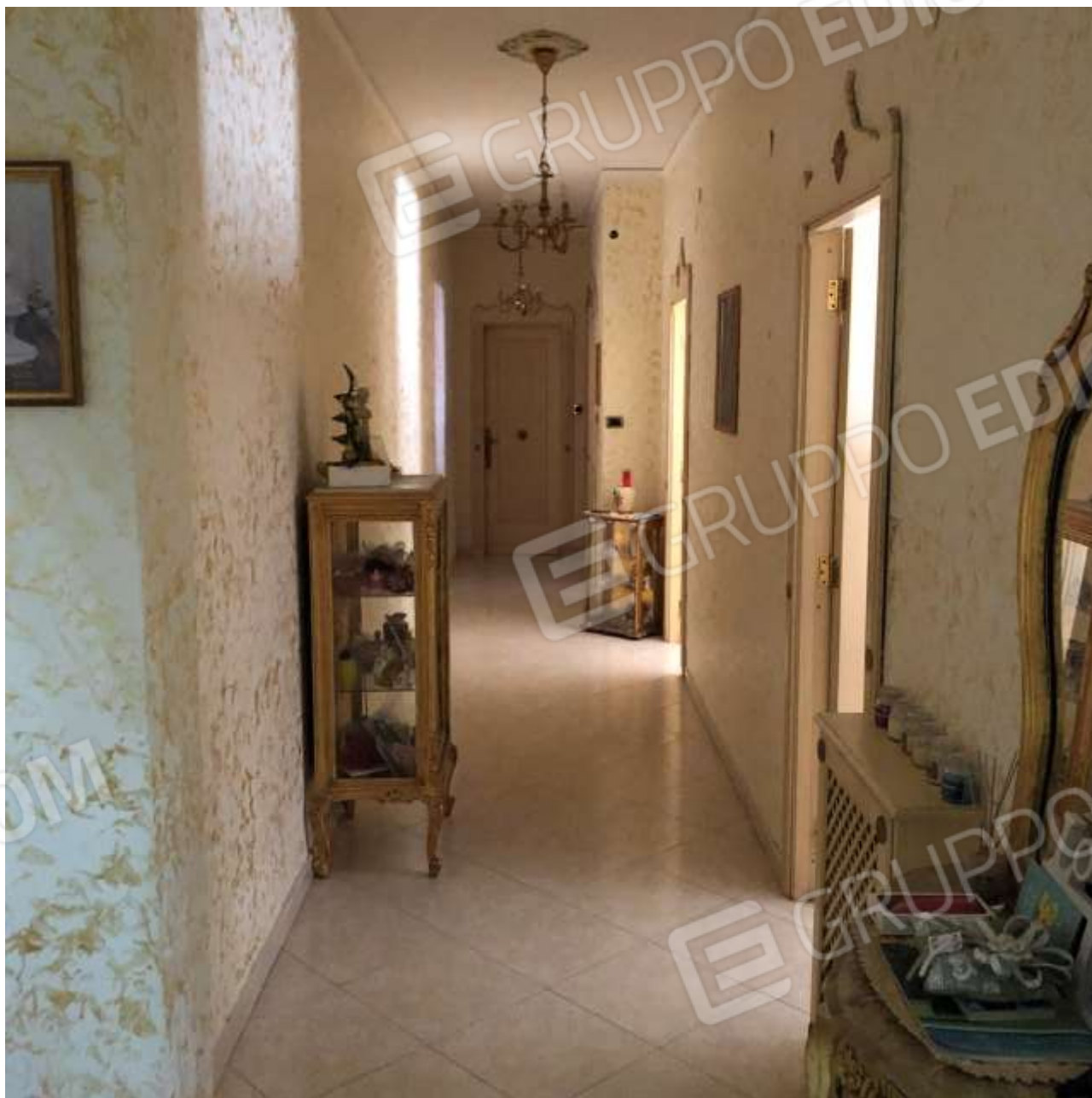
Vista dell'ingresso e del corridoio di collegamento interno