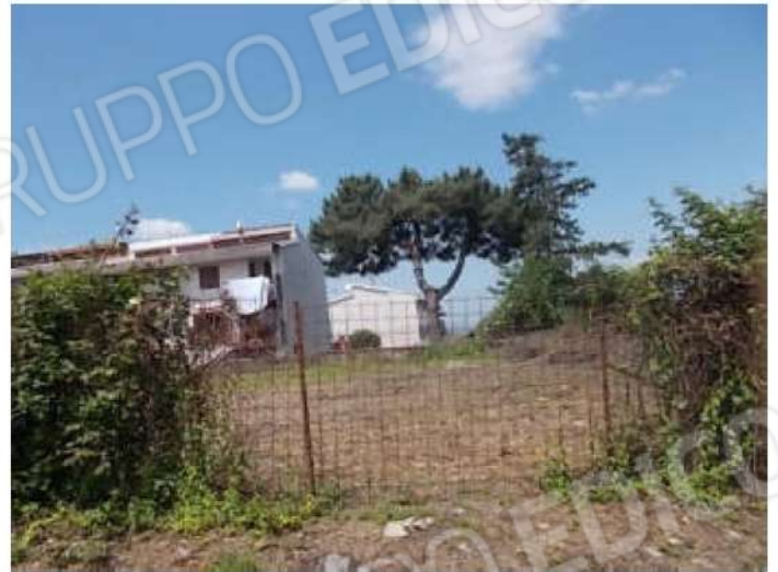
altre viste della strada privata, si noti la pendenza della stessa, a destra e la porzione di terreno liberata recentemente dai rovi