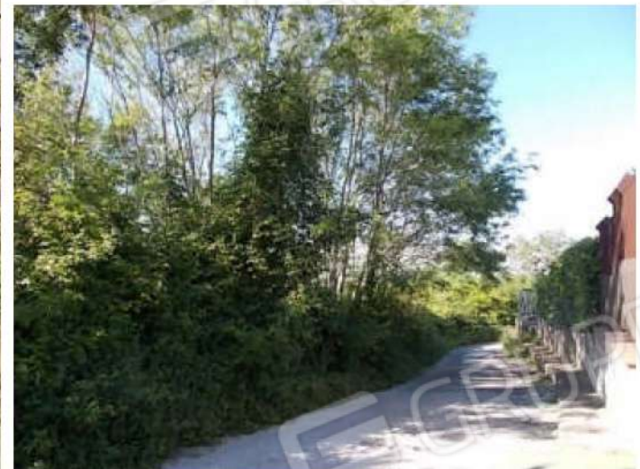
altre viste della strada privata, si noti la porzione di terreno infestata dai rovi