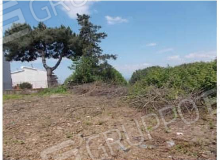
viste della porzione del terreno oggetto di divisione recentemente liberata dai rovi