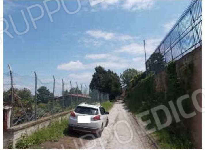
altre viste della strada privata e del confine sud del terreno oggetto di divisione