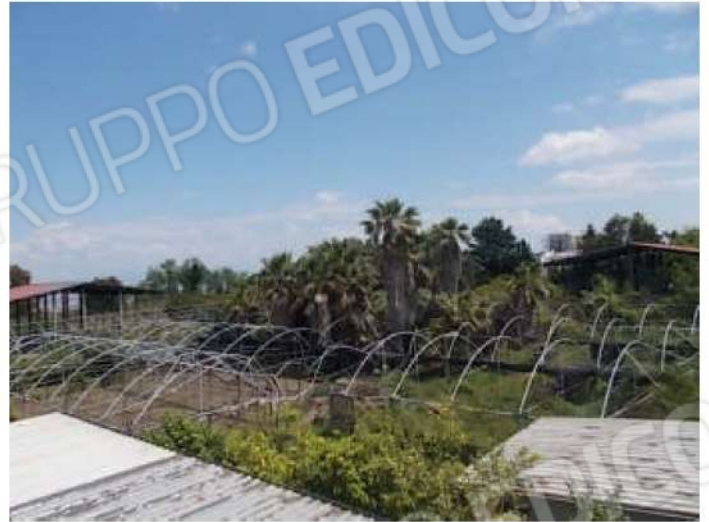
viste della porzione di terreno ad est del piccolo fabbricato abusivo