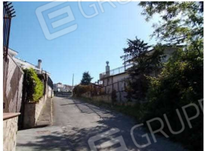
strada privata che si diparte da Via del Mare civico 53, e conduce al cancello d'ingresso all'area in possesso dei comproprietari