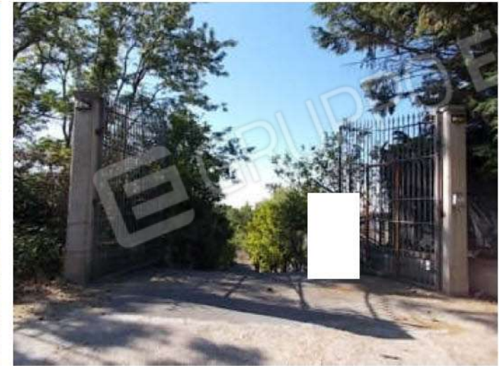
viste della strada privata nella parte dove è stato realizzato il cancello d'ingresso alla superficie in possesso dei comproprietari