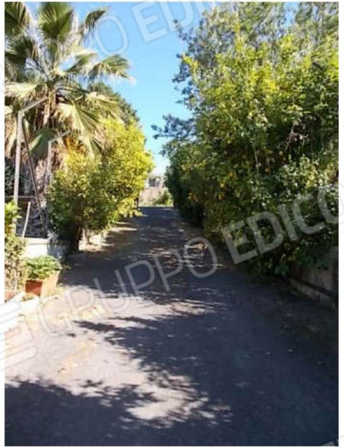
viste della rampa d'ingresso dove viene esercitata la servitù di passaggio a favore della particella n. 95 estranea alla divisione