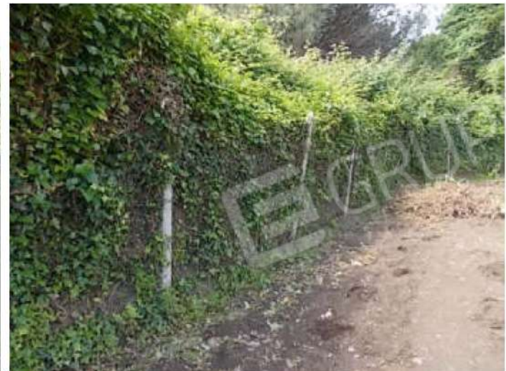
viste dalla particella limitrofa n. 95 del confine nord nella parte infestata dai rovi