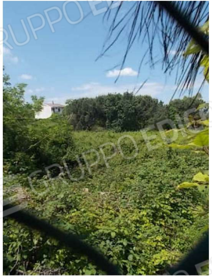
viste dalla rampa di accesso della porzione infestata dai rovi