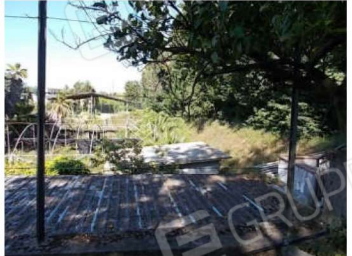
viste del piccolo fabbricato abusivo e della porzione di terreno ad est dello stesso