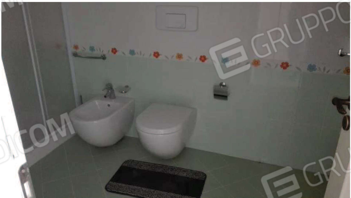
veduta di uno dei servizi igienici