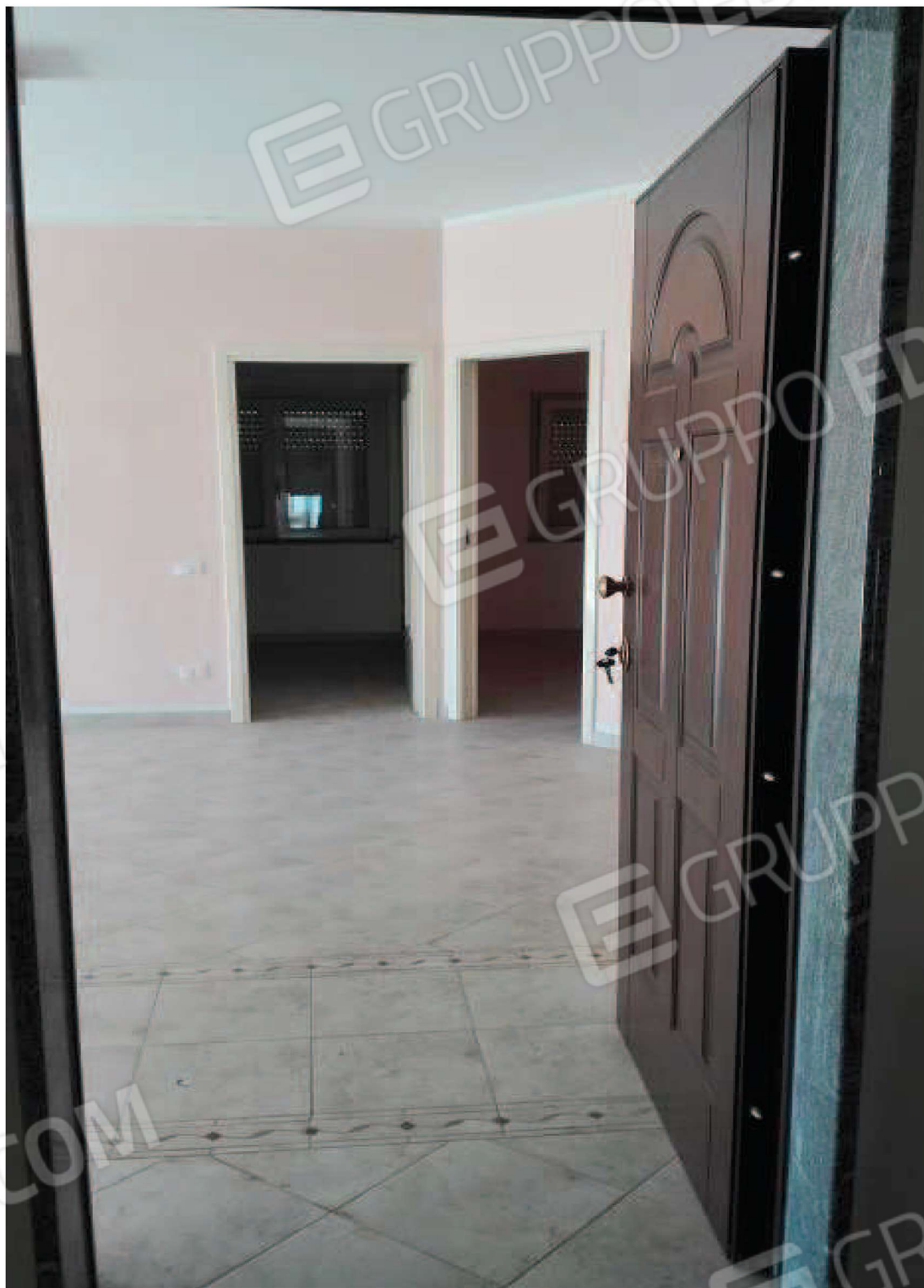
veduta della hall di ingresso