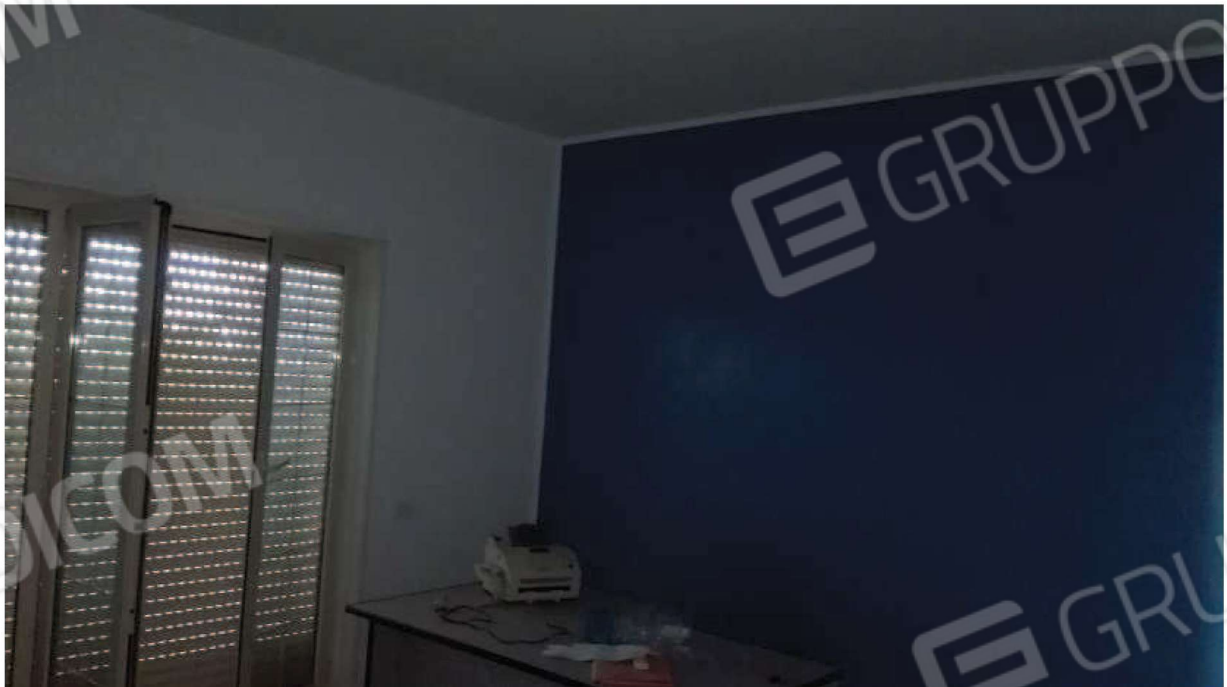
veduta di una delle camere destinate ad ufficio