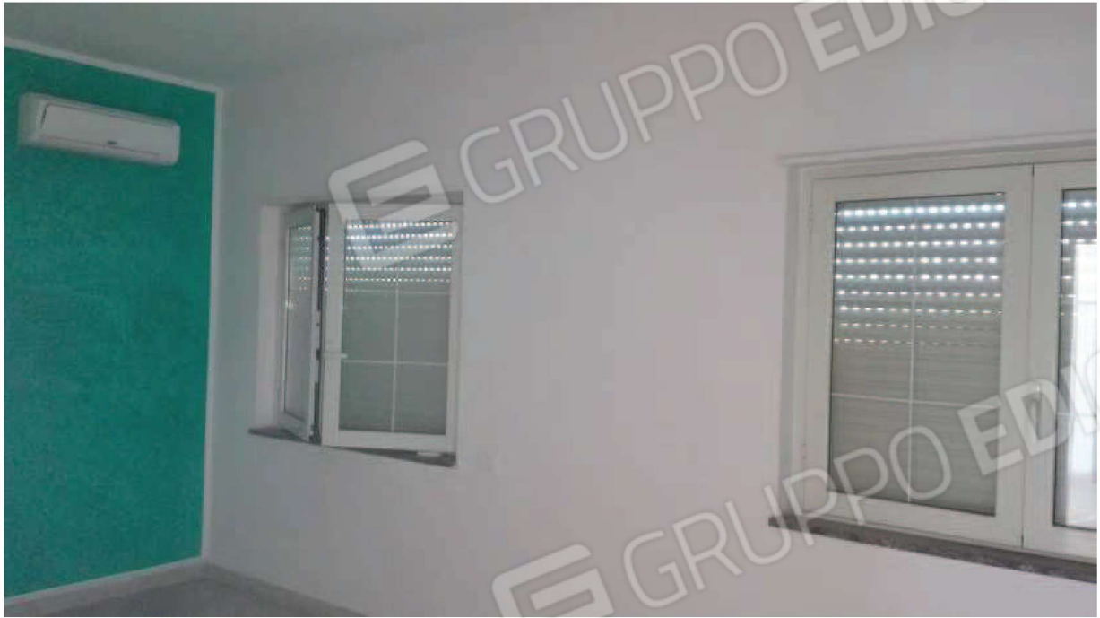
veduta di una delle camere , dotata di climatizzatore, libera da arredi