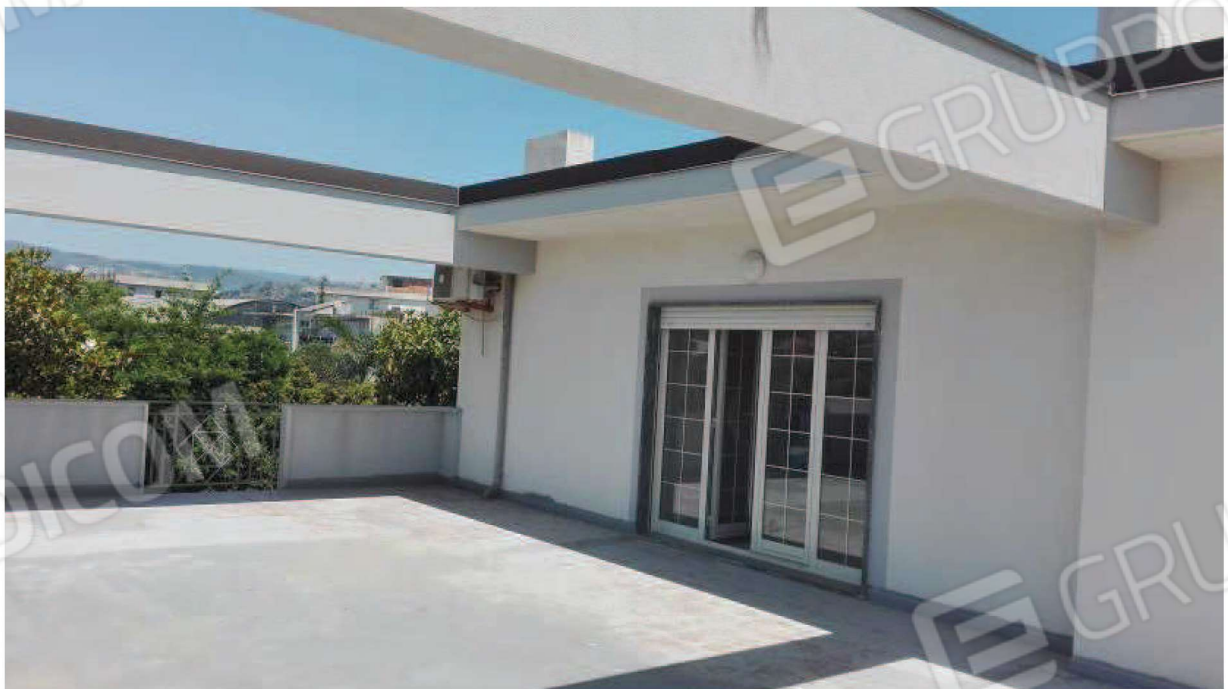
Inquadramento della finestra della hall aperta sul lastrico solare