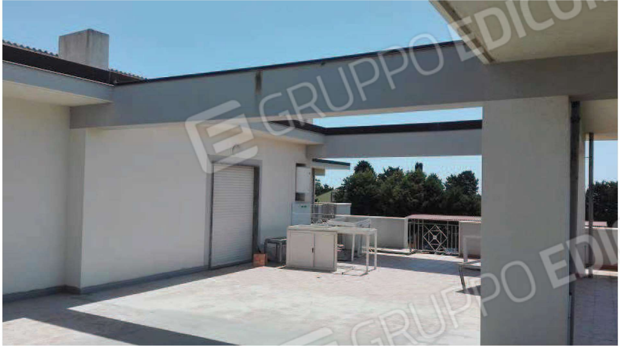
Il pergolato in c.a. sul luogo del lastrico solare