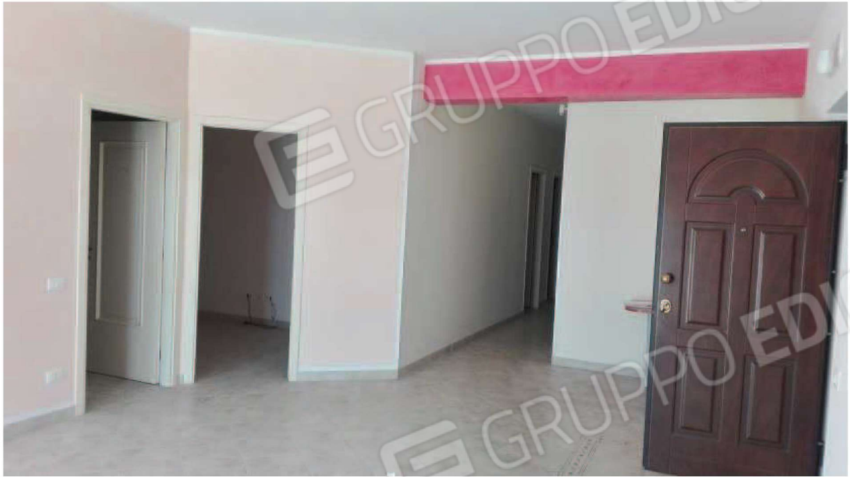
veduta della zona giorno . Inquadra la porta di ingresso e le aperture interne