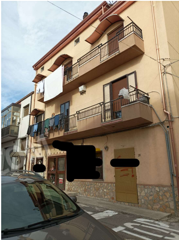
FACCIATA ESTERNA APPARTAMENTO POSTO AL 2° PIANO