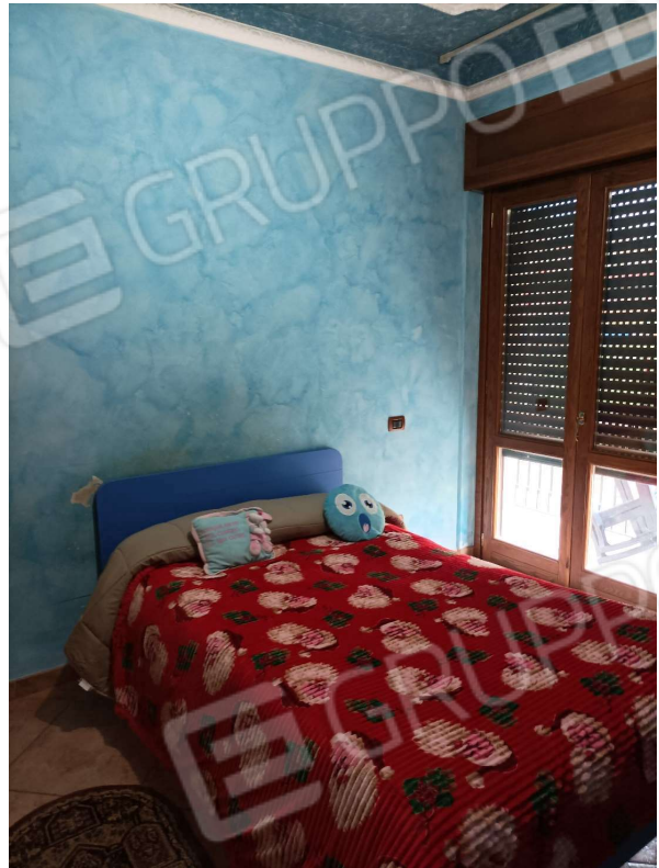
STANZA DA LETTO