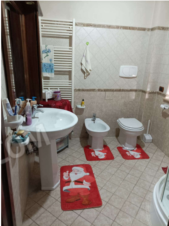
BAGNO (IN STANZA MATRIMONIALE)