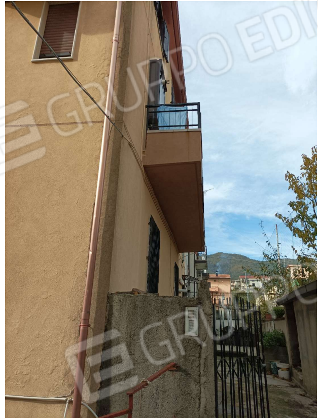
ESTERNO INGRESSO EDIFICIO