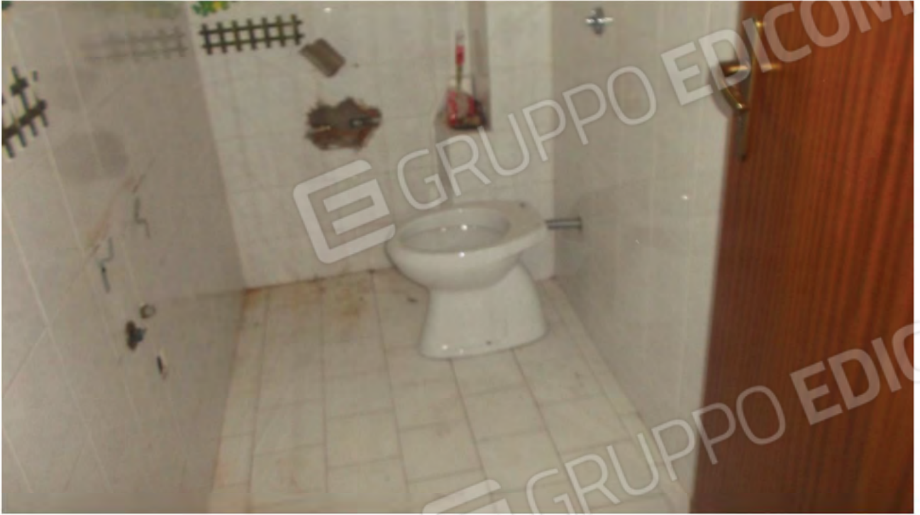
Foto 7 Servizio