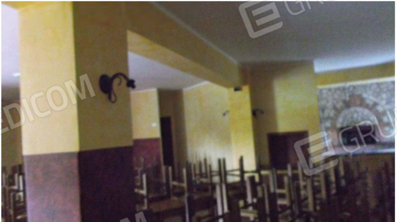
Foto 2 Sala con vista accesso servizi e zona forno