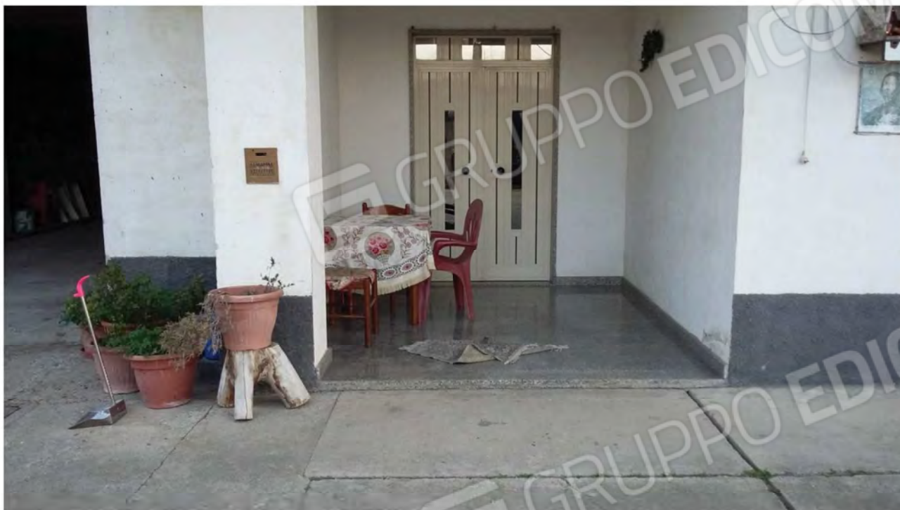
Foto 11 Esterno Corte livello seminterrato: ingresso condominiale