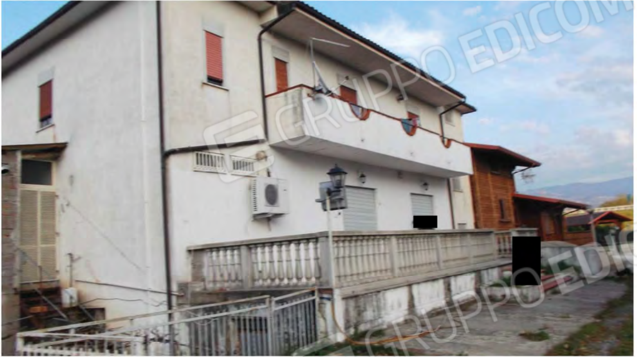
Foto 9 Esterno