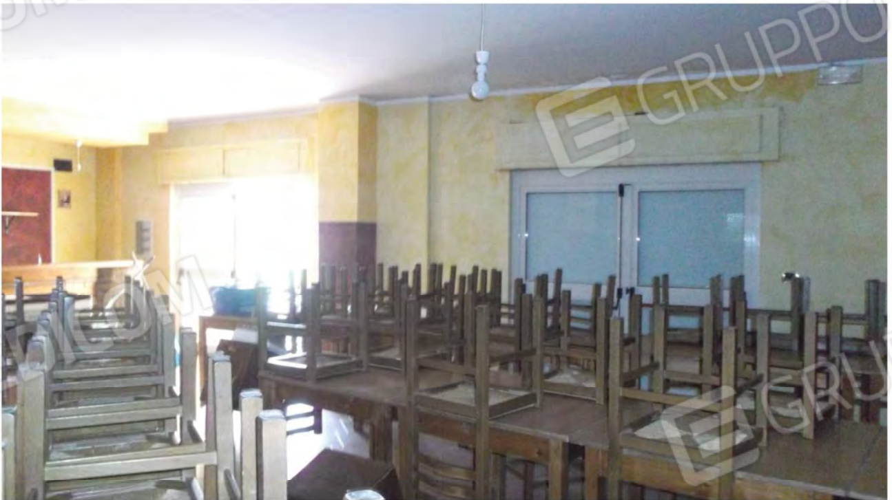
Foto 4 Sala con vista angolo bar e vetrate adiacenti lastrico solare