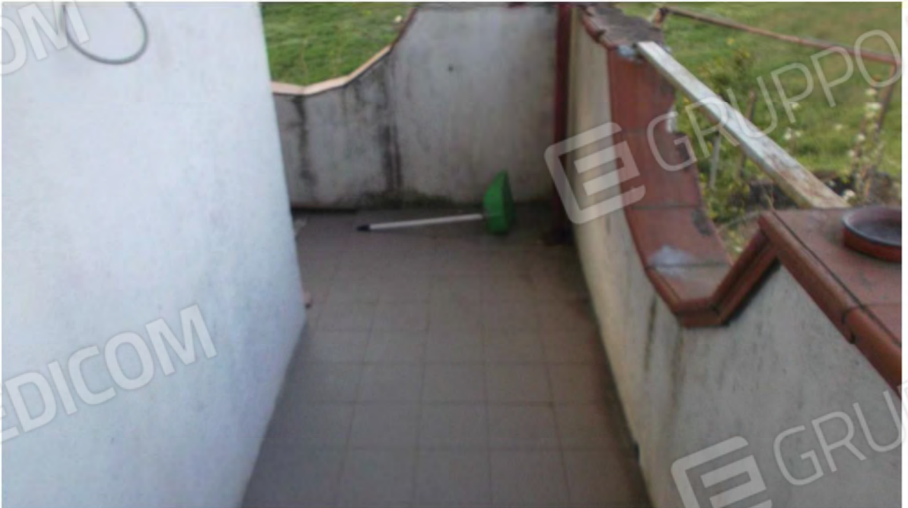
Foto 8 Balcone