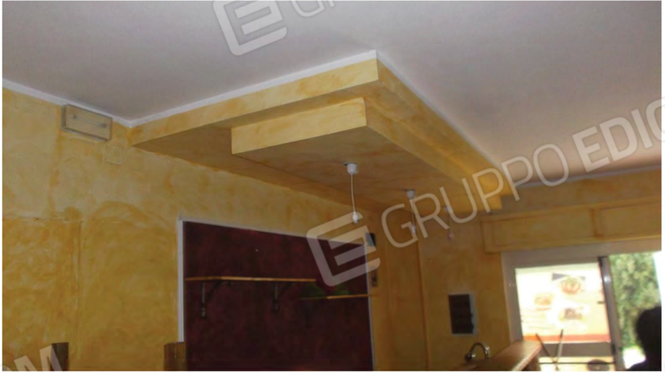
Foto 1 Angolo Bar