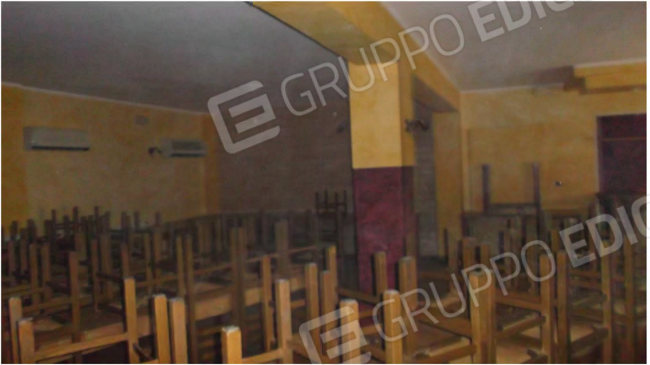
Foto 3 Sala con vista parete divisoria in legno e porta accesso scale interne