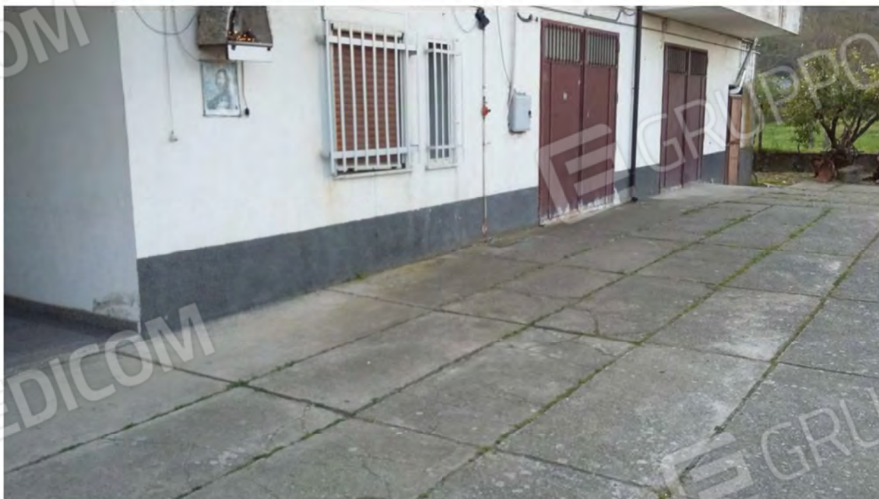
Foto 12 Esterno Corte livello seminterrato: parte ingresso condominiale e locali adiacenti non interessati dalla stima