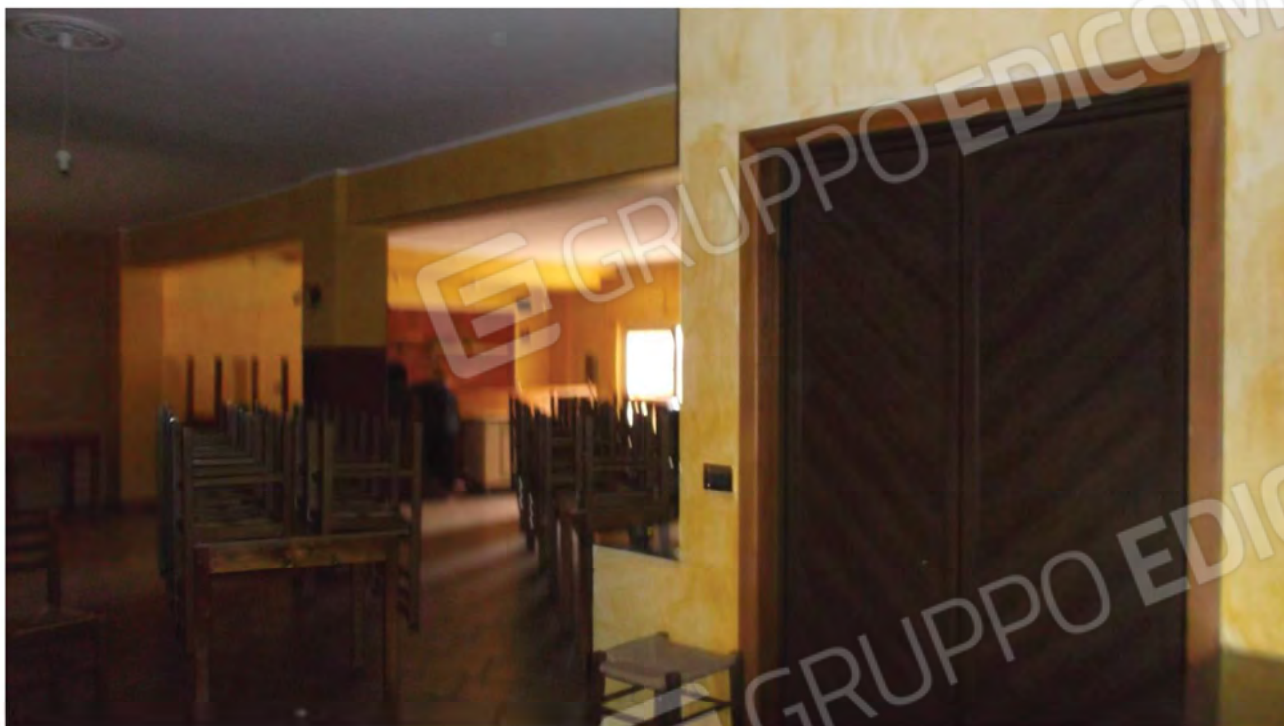
Foto 5 Sala interna con accesso cucina