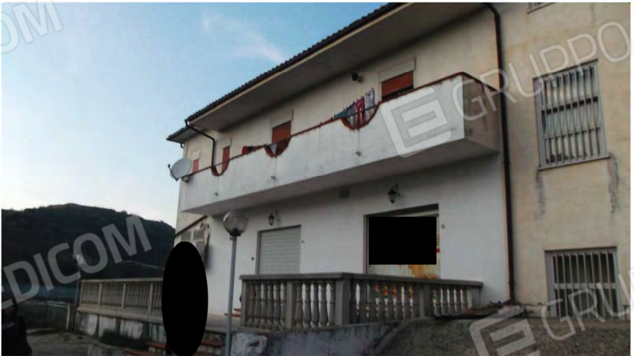
Foto 10 Esterno