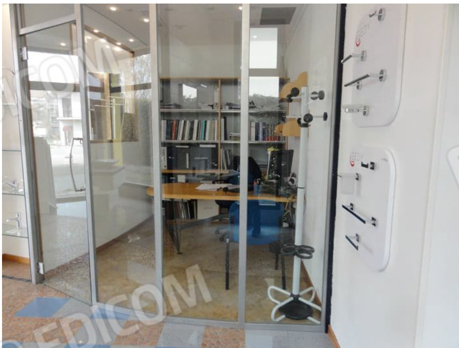
BOX UFFICIO AL PIANO TERRA