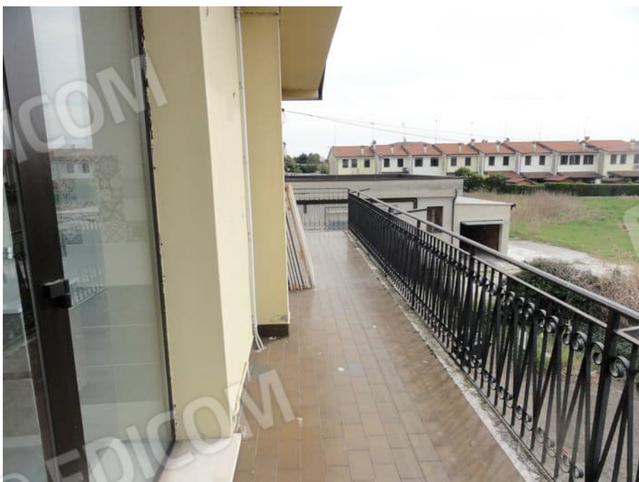
POGGIOLO A SUD