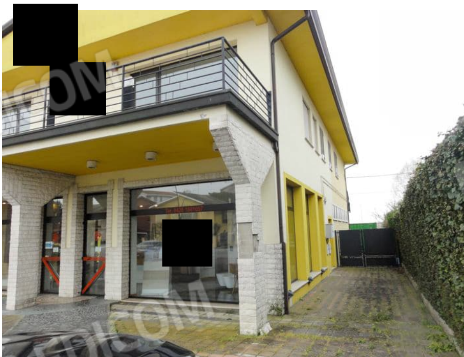
VISTA OVEST ACCESSO CARRAIO E PEDONALE