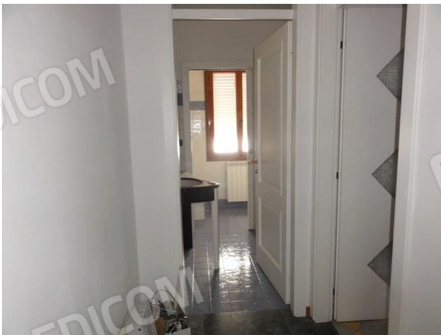
ANTI BAGNO P.PRIMO