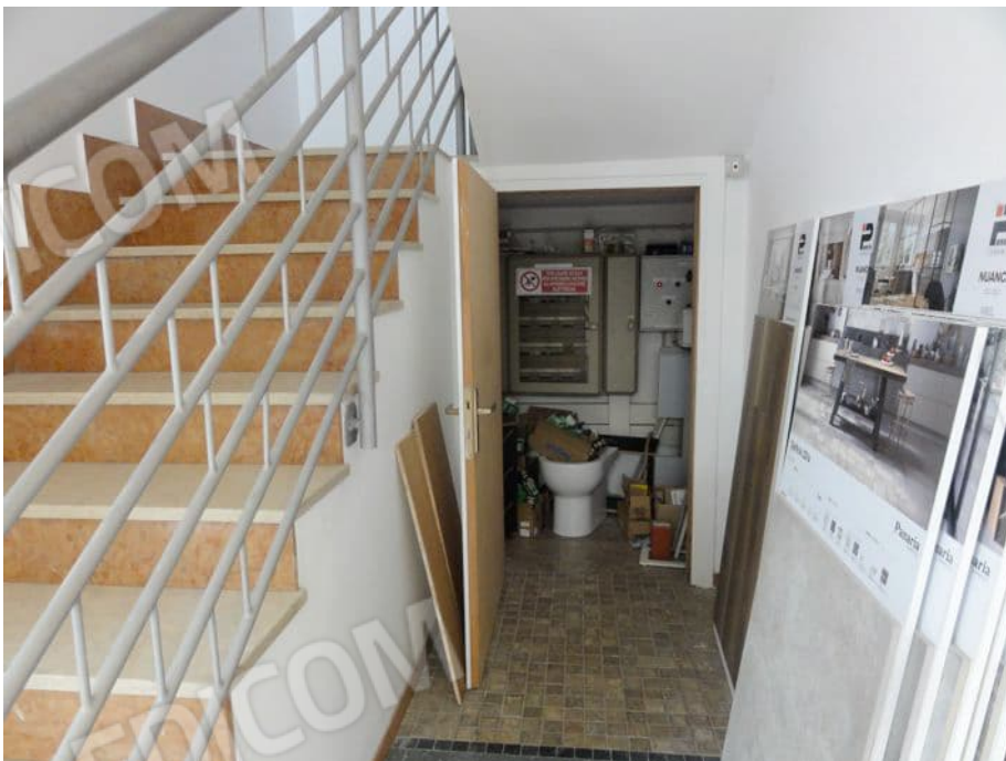
VANO SCALA E SOTTOSCALA