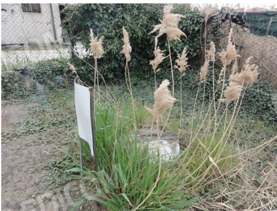
SERBATOIO GPL DISMESSO