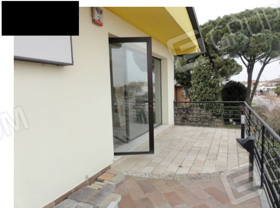
TERRAZZA A NORD