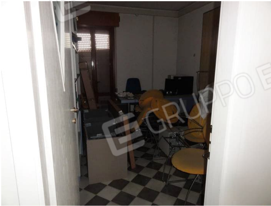
UFFICIO P. PRIMO