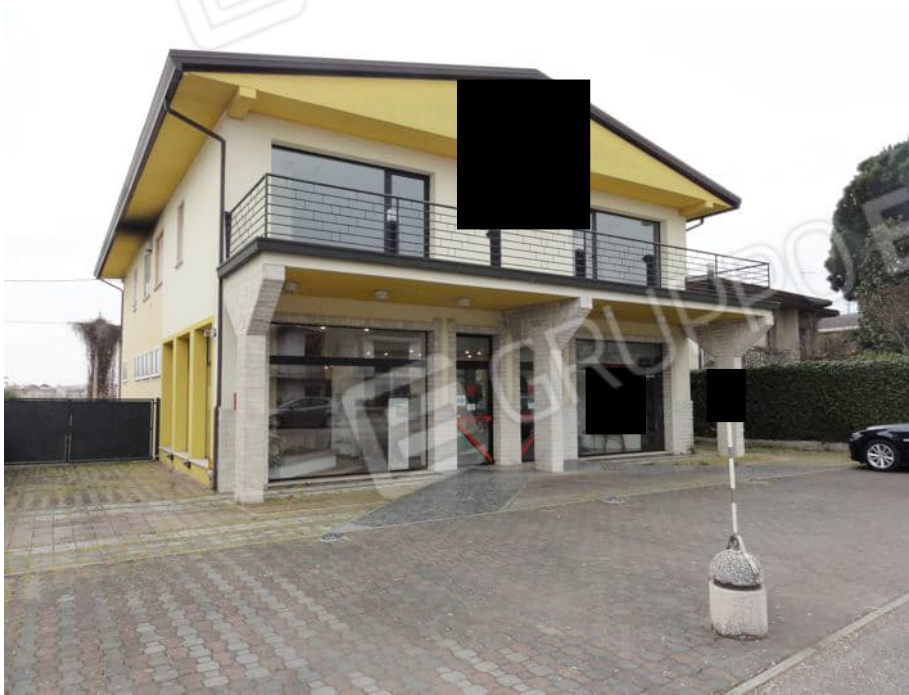
VISTA NORD DA VIA G. MAZZINI