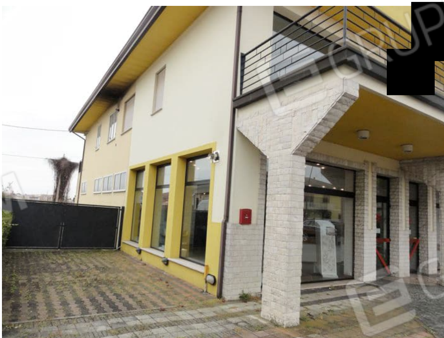
VISTA EST E ACCESSO CARRAIO