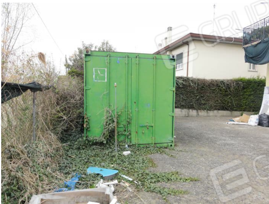
CONTAINER NON AUTORIZZATO