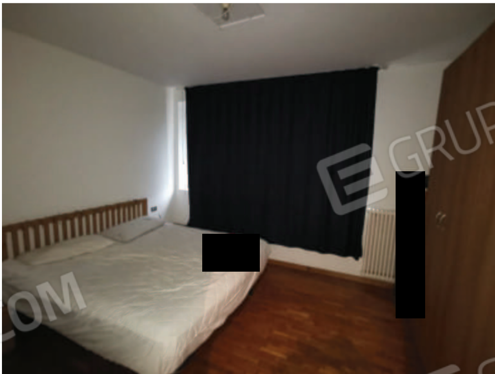
IMMAGINE 6 - particolare interno appartamento (vano letto)