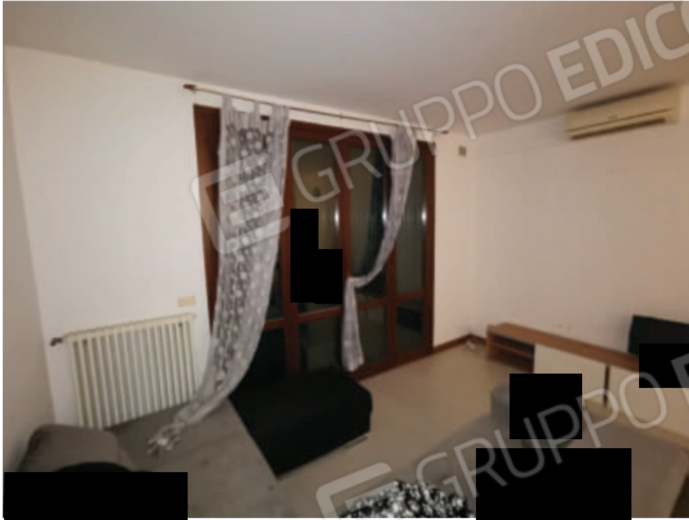
IMMAGINE 5 - particolare interno appartamento (soggiorno)