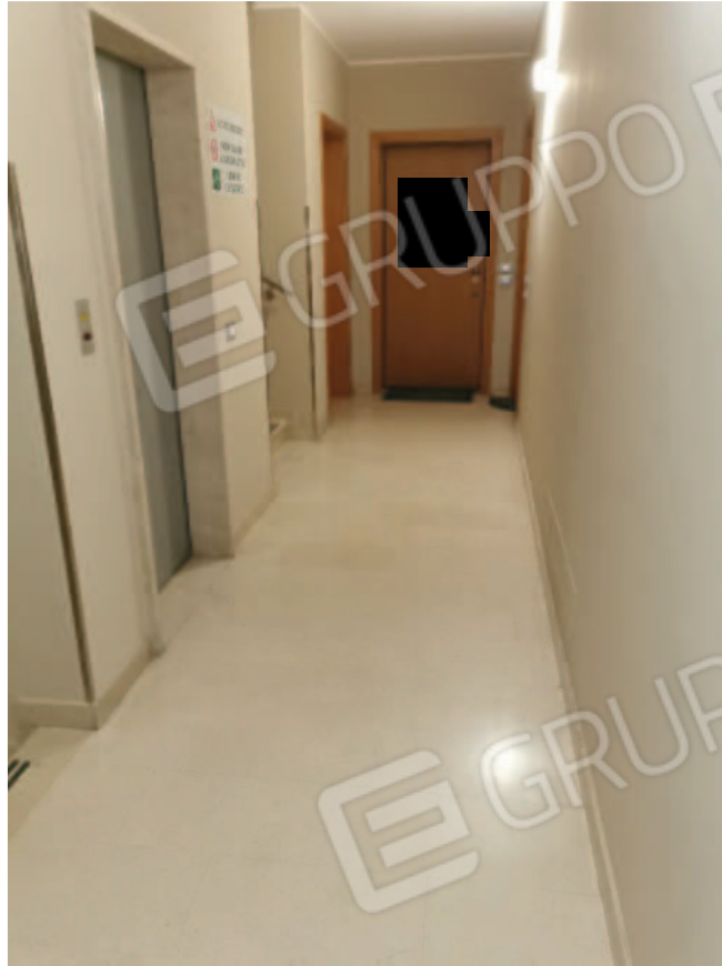
IMMAGINE 3 - corridoio, vano scala e ascensore condominiali