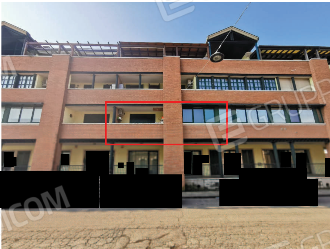
IMMAGINE 2 - prospetto principale