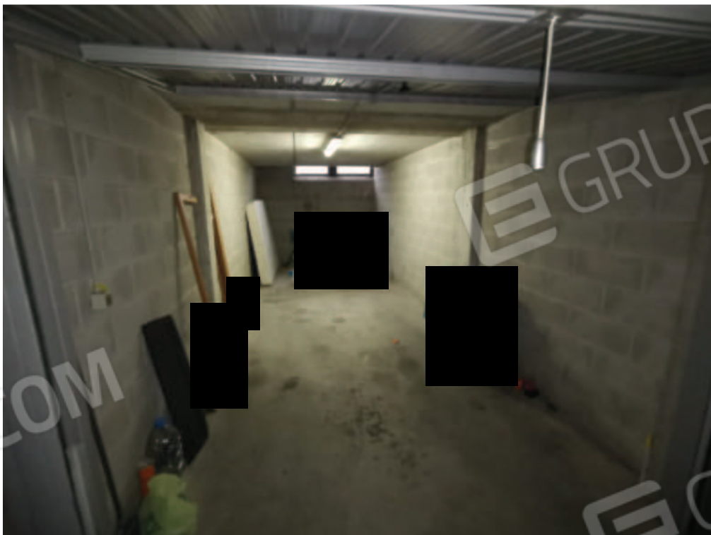
IMMAGINE 8 - particolare interno garage