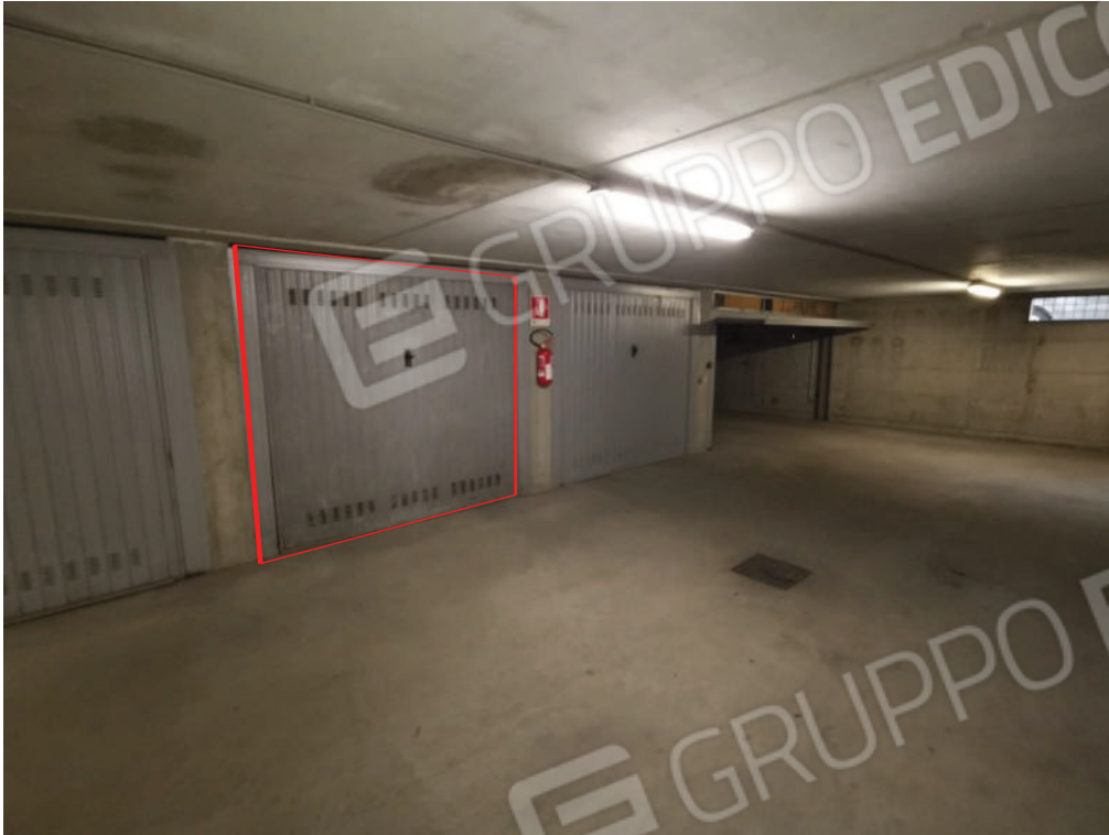
IMMAGINE 7 - garage e corsia di manovra