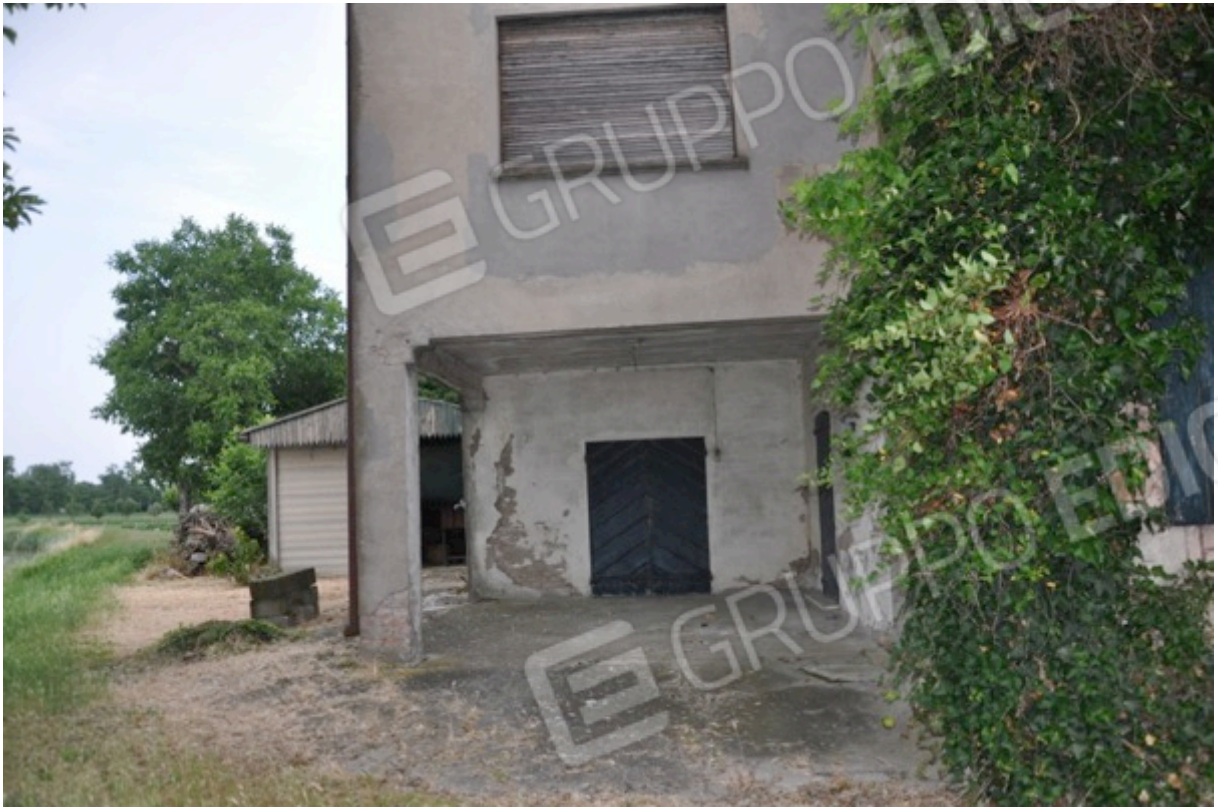
5. Prospetto ovest.