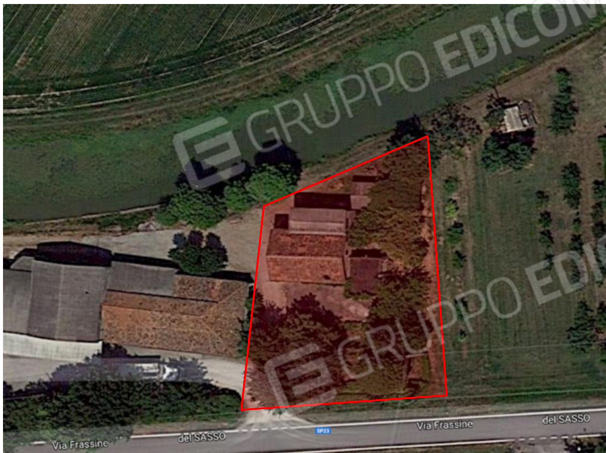
1. Individuazione approssimativa del lotto.