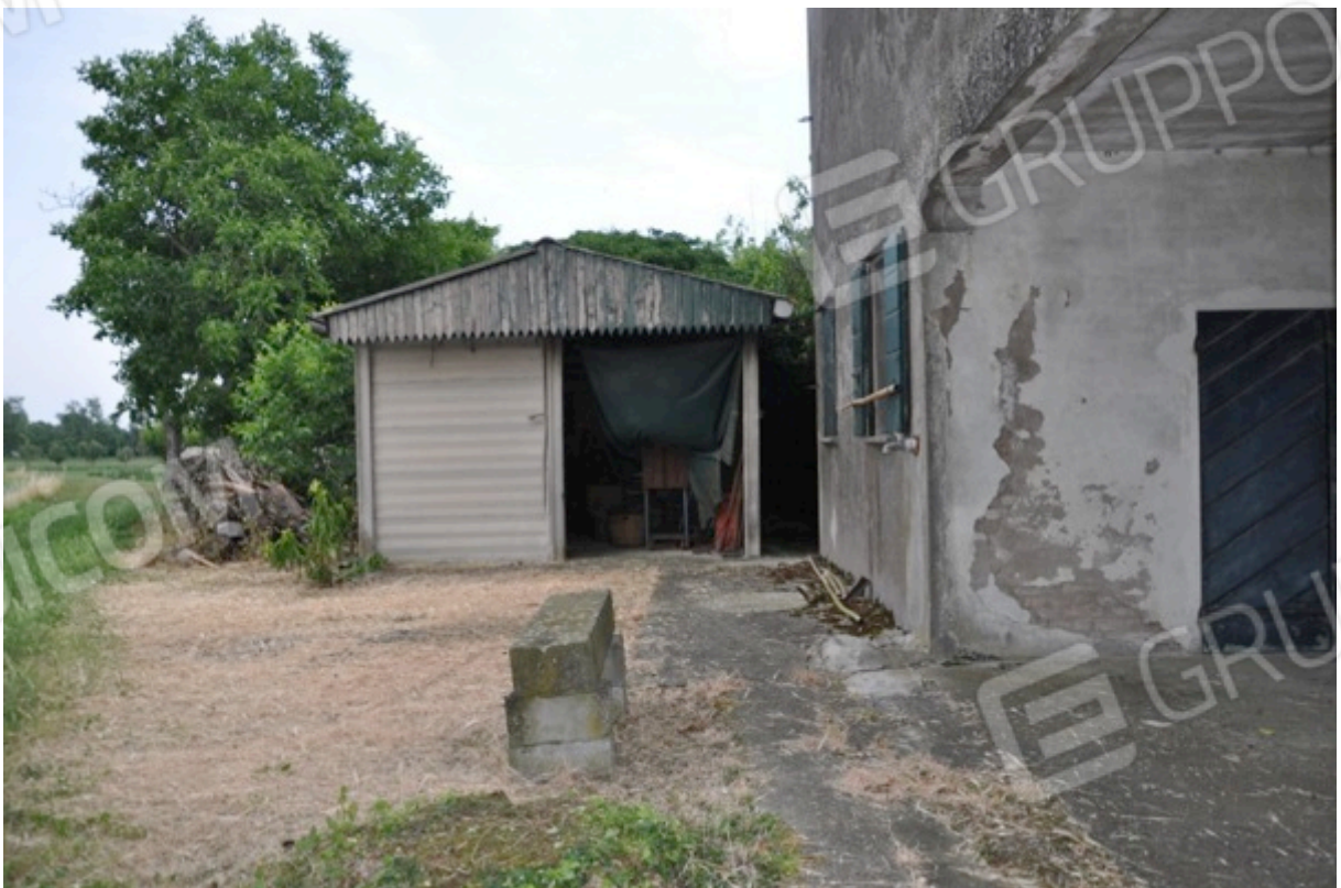
6. Particolare del manufatto abusivo.