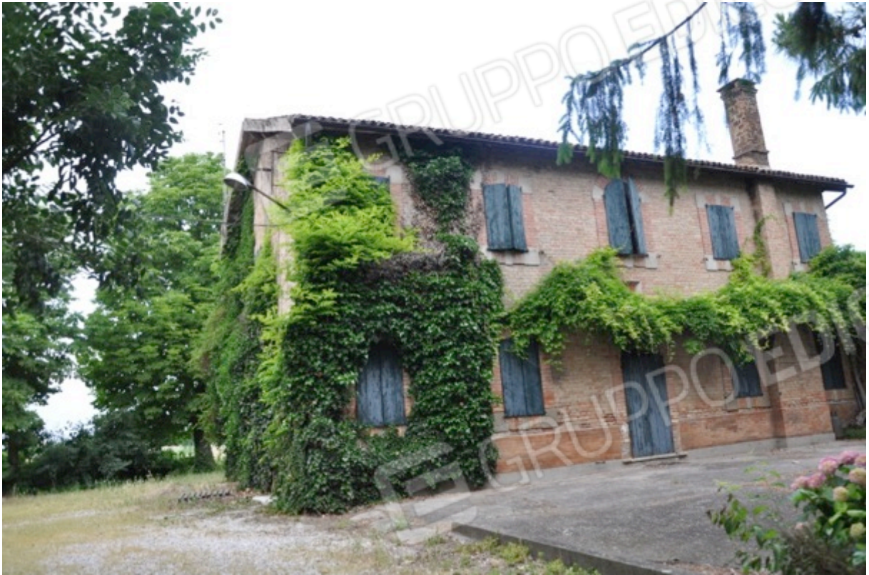
3. Prospetto sud.