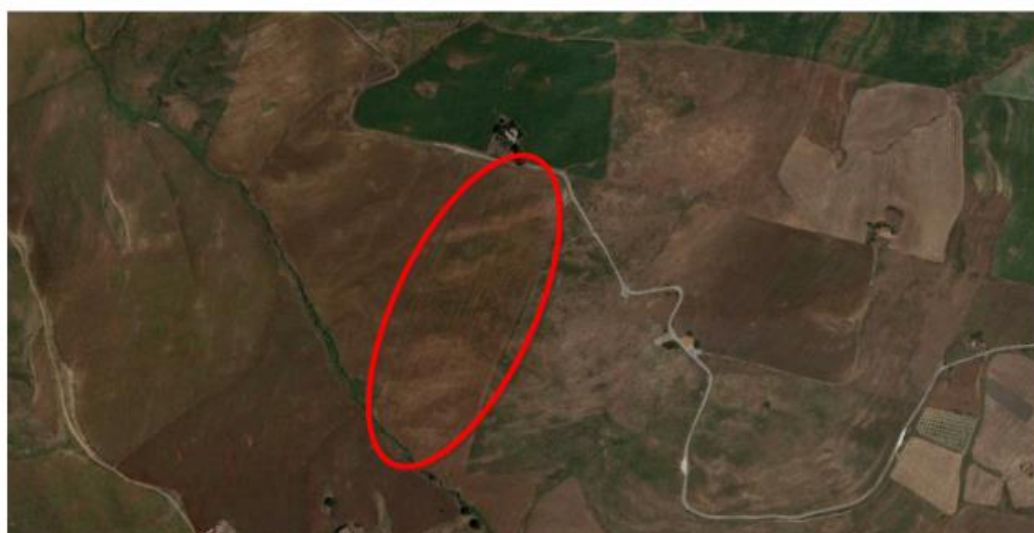
Figura 2 – Vista satellitare dei beni