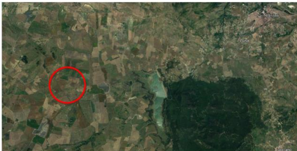
Figura 1 - Inquadramento territoriale dei beni oggetto di pignoramento