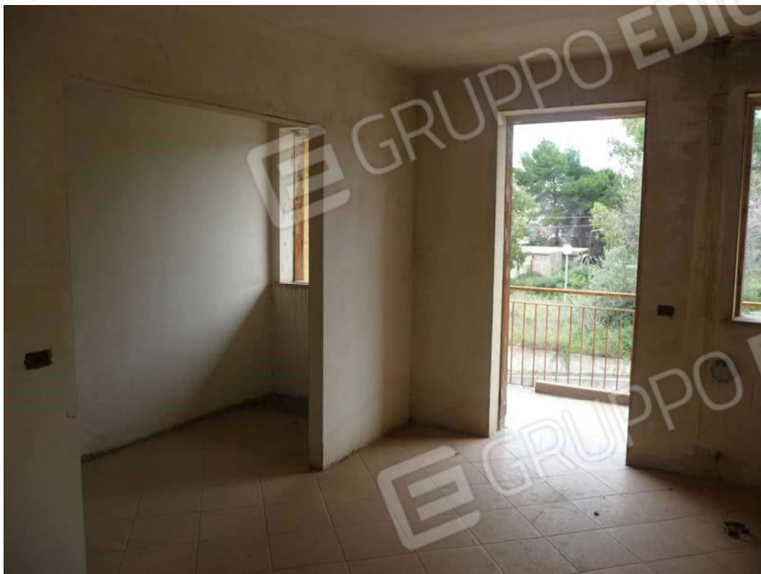
Comune di MESSINA Foglio di mappa n 20 part.IIa 1874 SUB 3 Piano Primo Sottotetto