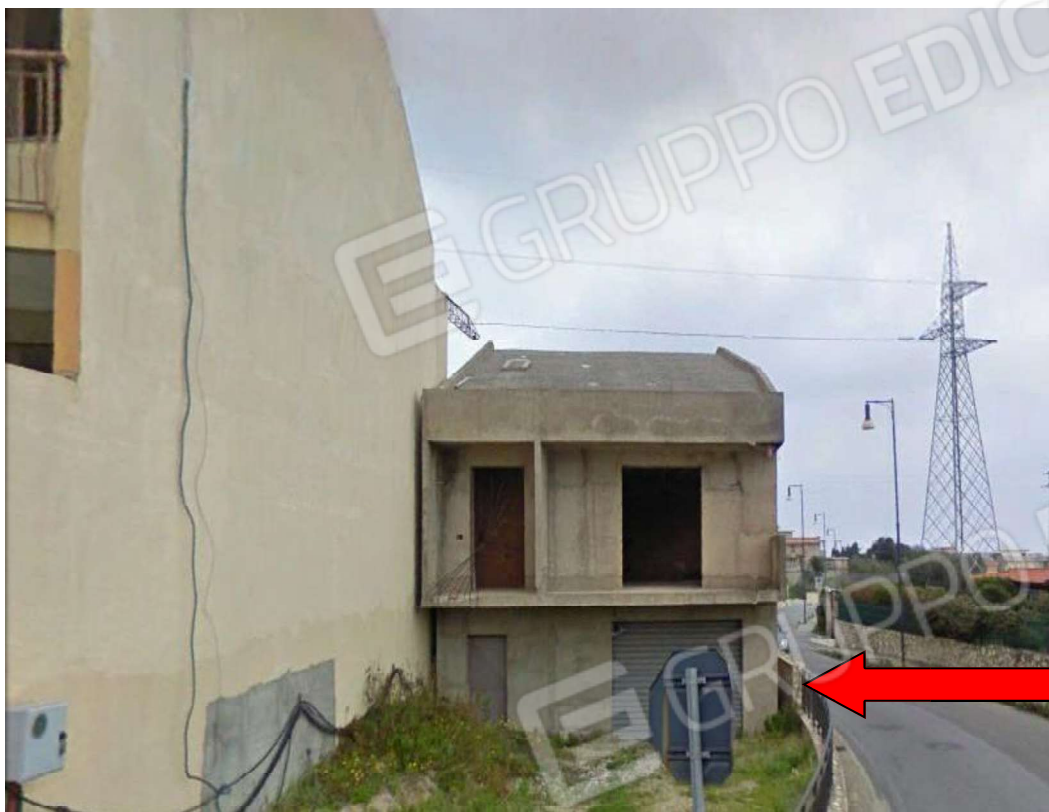
Comune di MESSINA Foglio di mappa n 20 part.IIa 1876 SUB 1 Piano Cantinato