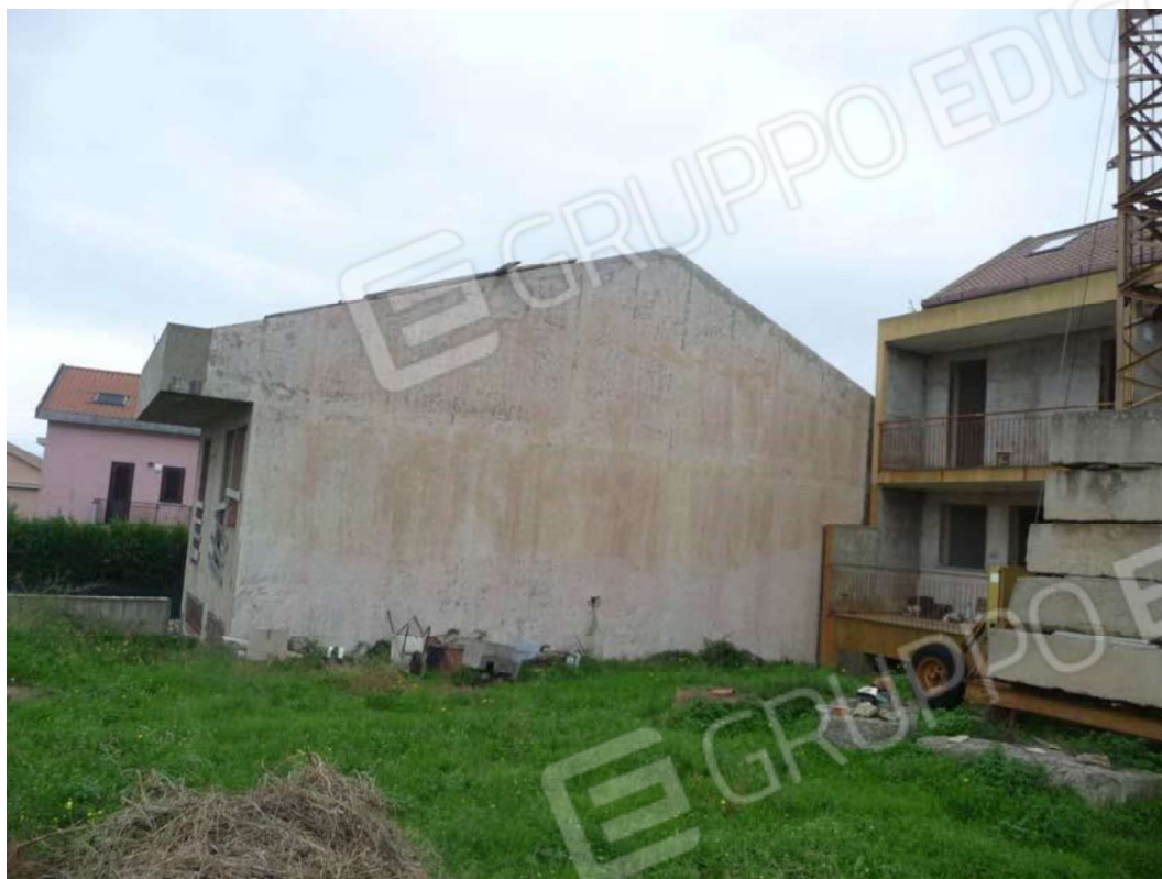
Comune di MESSINA Foglio di mappa n 20 part.IIa 1876 SUB 1-2 Comune di MESSINA Foglio di mappa n 20 part.IIa 1876 SUB 2