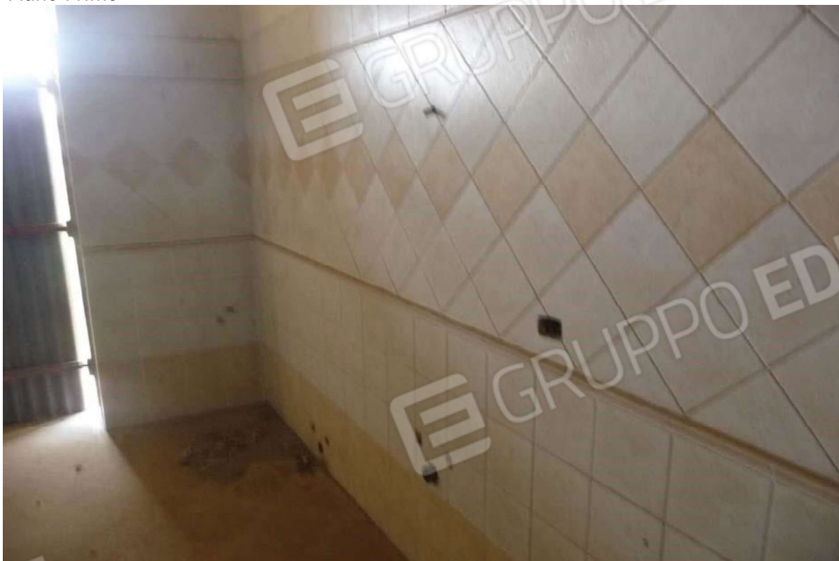
Comune di MESSINA Foglio di mappa n 20 part.IIa 1874 SUB 2- Piano Primo