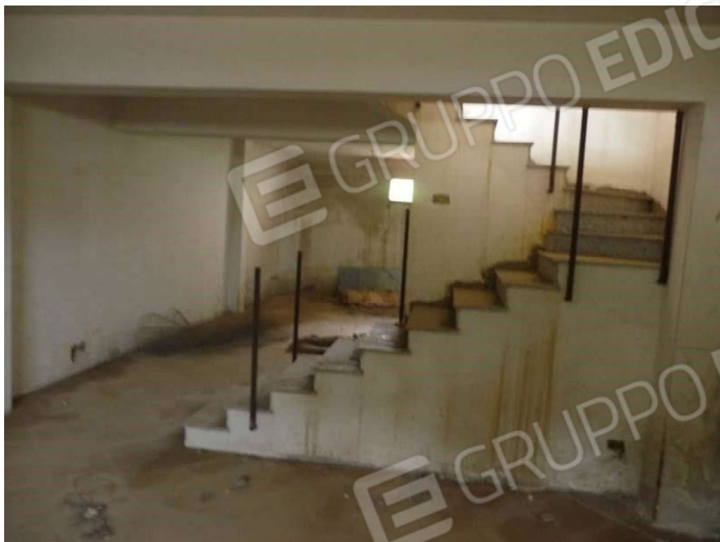
Comune di MESSINA Foglio di mappa n 20 part.IIa 1874 SUB 5