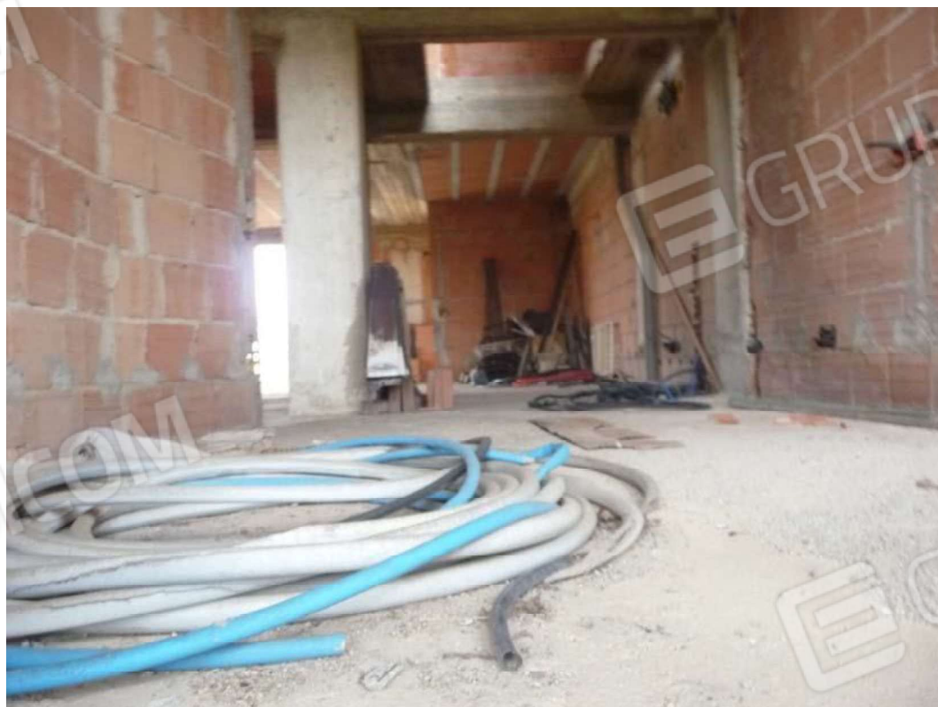
Comune di MESSINA Foglio di mappa n 20 part.IIa 1876 SUB 2