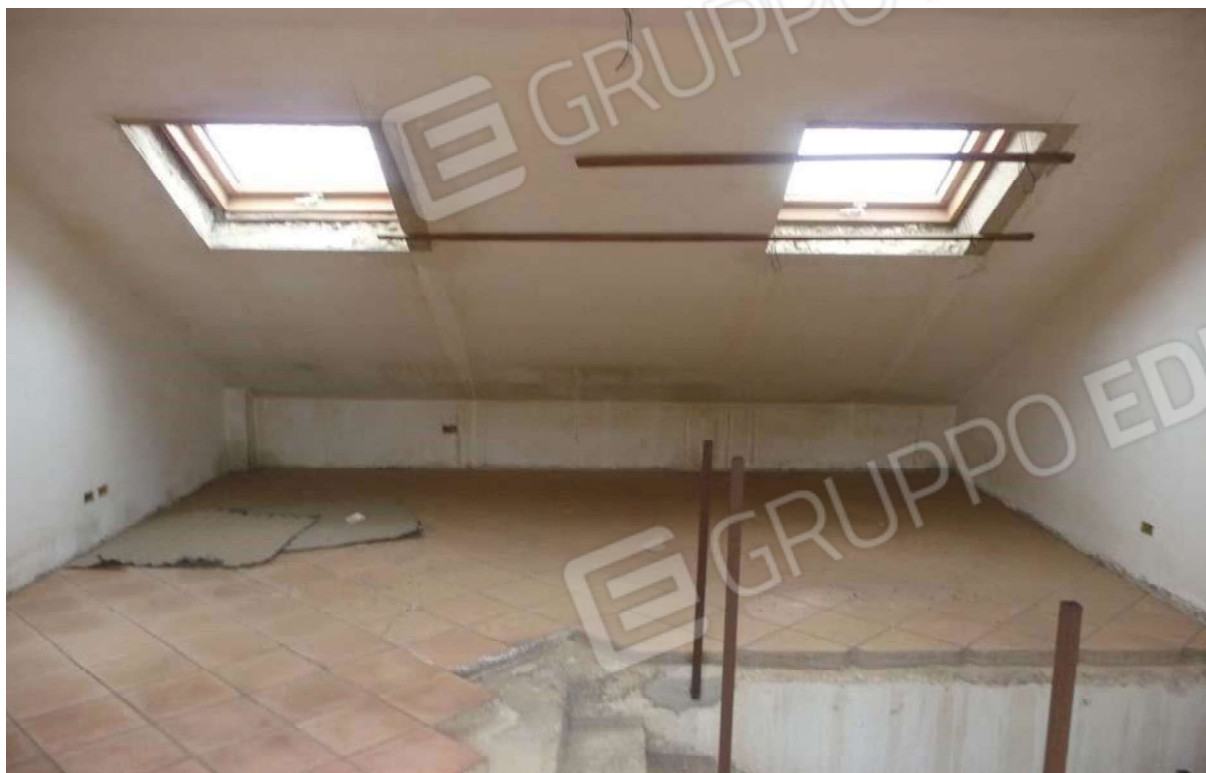
Comune di MESSINA Foglio di mappa n 20 part.IIa 1874 SUB 2- Sottotetto