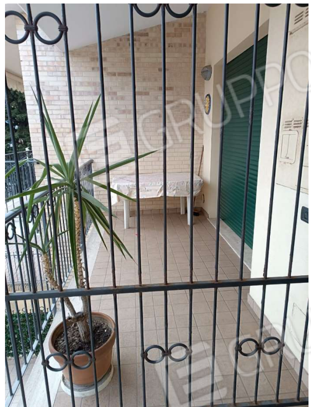
Foto 4_Balcone lato est