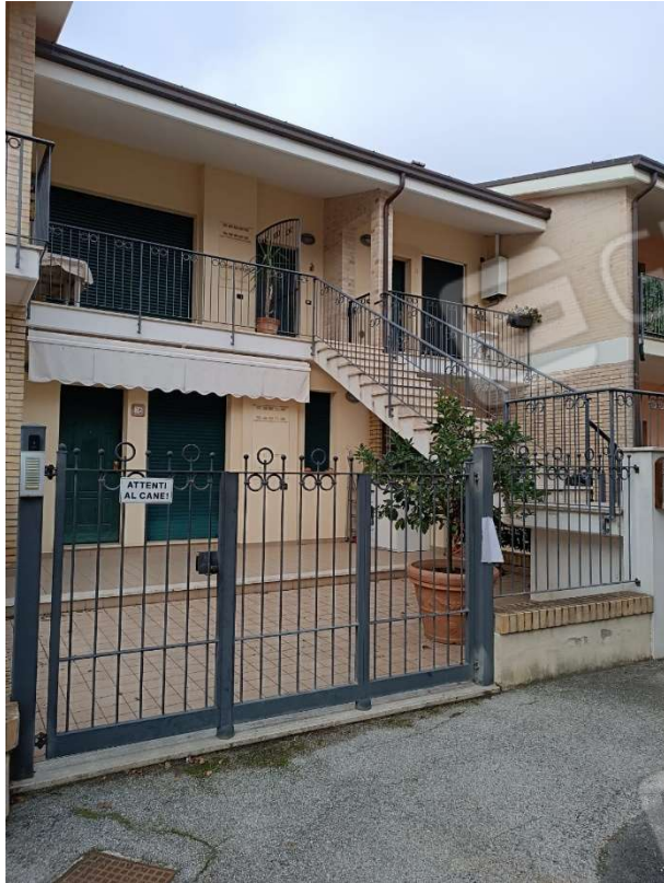
Foto 1_Ingresso su via Luigi Luzzatti