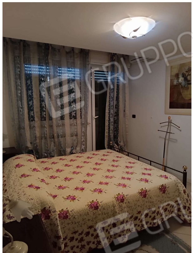
Foto 8_Camera matrimoniale