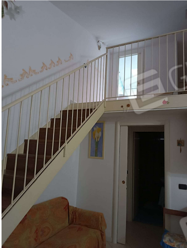
Foto 5_Scala soppalco