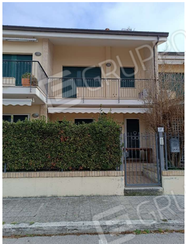
Foto 12_Balcone ovest su via Scarlatti