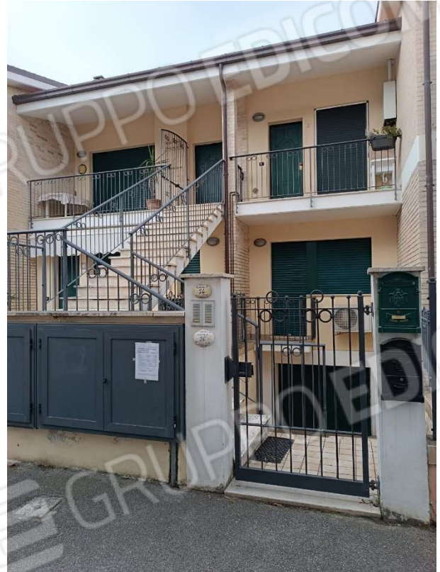
Foto 2_Ingresso su via Luigi Luzzatti