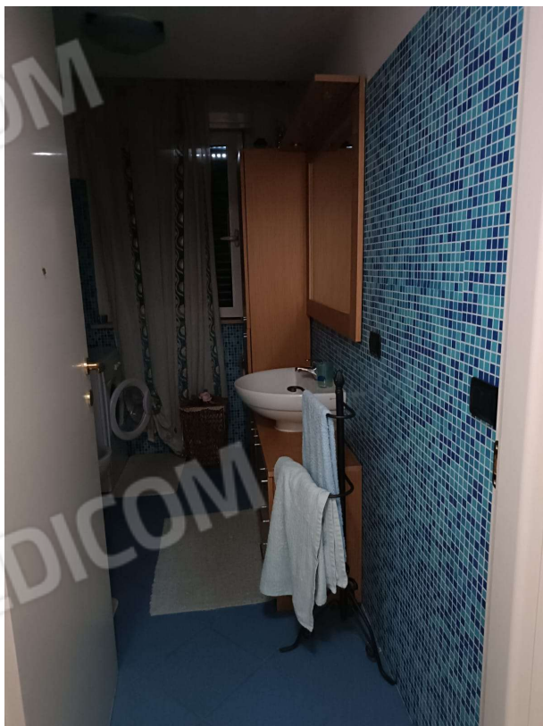
Foto 7_Bagno piano primo