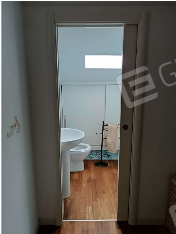
Foto 9_Bagno soppalco